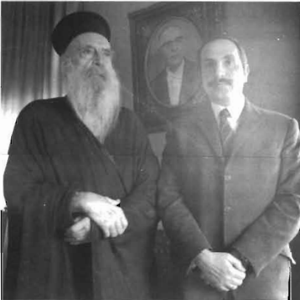
Φανάρι 1972 με τον Οικουμενικό Πατριάρχη Αθηνάγορα.