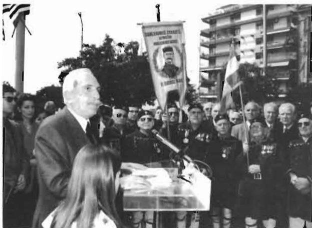
Θεσσαλονίκη, κεντρικός ομιλητής στα αποκαλυπτήρια του ανδριάντα του Παύλου Μελά.