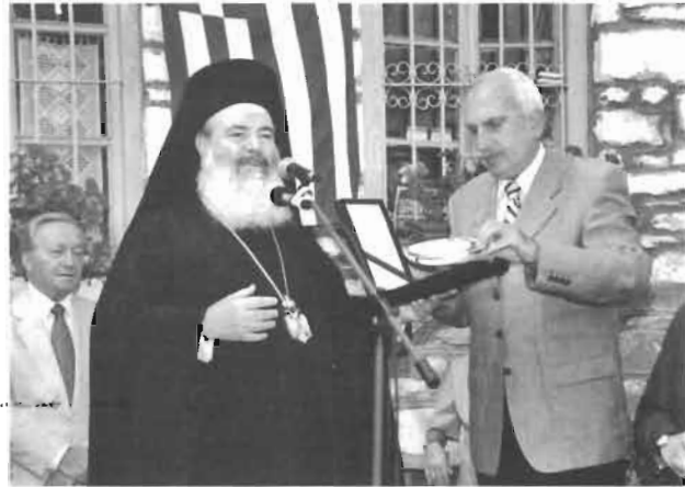
2002 Νυμφαίο. Υποδεχόμενος τον Αρχιεπίσκοπο Αθηνών και πάσης Ελλάδος Χριστόδουλο.