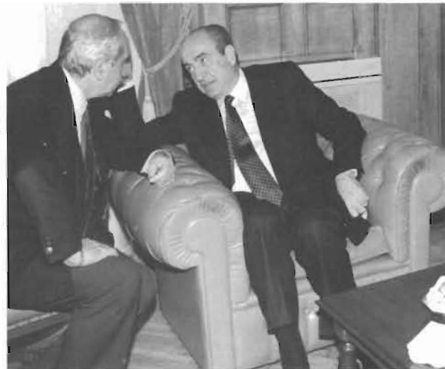
1990-1993 Σύμβουλος του Πρωθυπουργού Κων. Μητσοτάκη στα εθνικά θέματα Μακεδονίας-Θράκης.