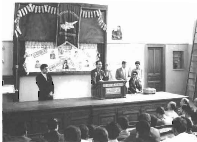
Πανεπιστήμιο 1956, στο βήμα για τον Κυπριακό αγώνα.