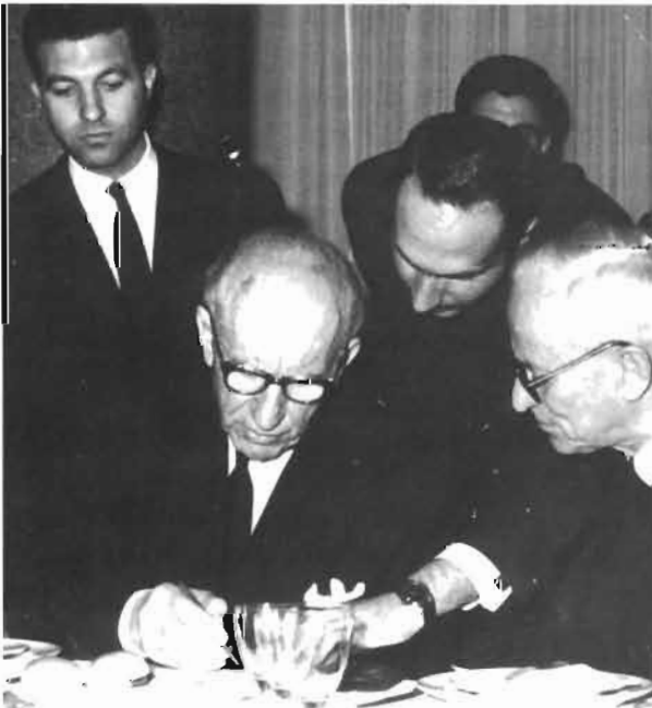
Θεσσαλονίκη 1964. Με τον Πρωθυπουργό Γεώργιο Α. Παπανδρέου (δεξιά ο υφυπουργός Κώστας Ταλιαδούρος).