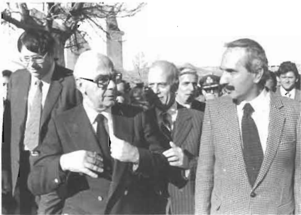
1981 Αμύνταιο. Με τον Πρωθυπουργό Γεώργιο Ι. Ράλλη. Διακρίνονται οι υπουργοί Στέφανος Μάνος και Νικ. Μάρτης.