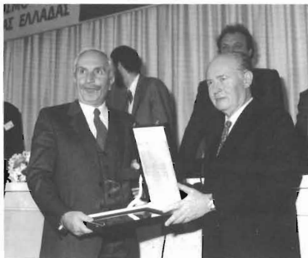
Θεσσαλονίκη, ο Πρόεδρος της Κυπριακής Δημοκρατίας Γ. Βασιλείου τον τιμά για τους αγώνες του στο Κυπριακό.