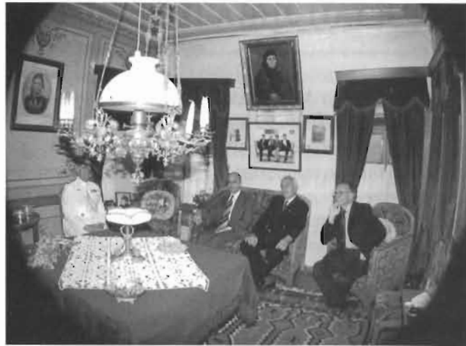
Νυμφαίο 2000. Ο Πρόεδρος της Δημοκρατίας Κωστής Στεφανόπουλος στο αρχοντικό του.