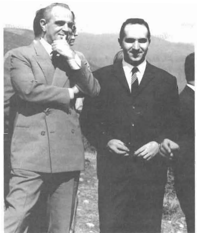
1961. Κέλλη Φλώρινας με τον Κωνσταντίνο Καραμανλή