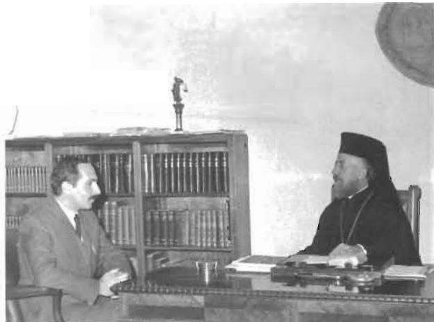
Λευκωσία 1970 με τον Πρόεδρο Αρχιεπίσκοπο Μακάριο.