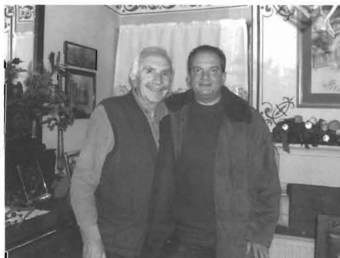
Νυμφαίο Χριστούγεννα 2006, υποδέχεται στο αρχοντικό του τον Πρωθυπουργό Κώστα Αλ. Καραμανλή.