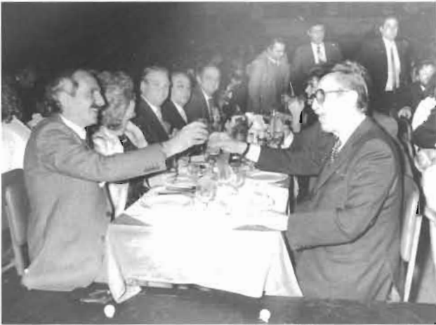
Θεσσαλονίκη 1982 με τον Ευ. Αβέρωφ, Πρόεδρο της Ν.Δ. Αριστερά ο Αλέκος Γ. Καραμανλής, πατέρας του τέως Πρωθυπουργού.