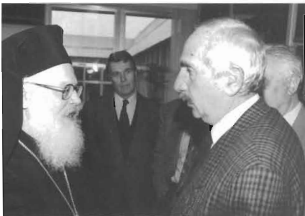
Θεσσαλονίκη, με τον Αρχιεπίσκοπο Αλβανίας Αναστάσιο.