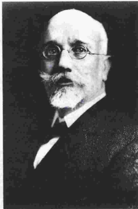
Στα τέσσερα περίπου χρόνια 1911-1913, ο Ελευθέριος Βενιζέλος εκσυγχρόνισε εκ βάθρων την Ελλάδα, την εξόπλισε και την διπλασίασε. Κατοχύρωσε συνταγματικά την μονιμότητα των δημοσίων υπαλλήλων. Μετά έξι χρόνια, όμως, την παρεβίασε ωμά

Στα τέσσερα περίπου χρόνια 1911-1913, ο Ελευθέριος Βενιζέλος εκσυγχρόνισε εκ βάθρων την Ελλάδα, την εξόπλισε και την διπλασίασε. Κατοχύρωσε συνταγματικά την μονιμότητα των δημοσίων υπαλλήλων. Μετά έξι χρόνια, όμως, την παρεβίασε ωμά. Όταν το 1917 υπό τα τηλεβόλα του γαλλικού στόλου επανήλθε Πρωθυπουργός στην Αθήνα που είχαν καταλάβει τα αφρικανικά αποικιακά στρατεύματα της Γαλλίας, αυτός ο μεγάλος Ευρωπαίος φιλελεύθερος εκσυγχρονιστής απεστράτευσε το 40% των μόνιμων