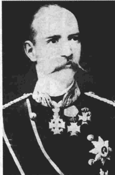
Από τον Νοέμβριο 1863, που ανέλαβε Βασιλεύς ο Γεώργιος Α', μέχρι τον Φεβρουάριο 1874 σχηματίστηκαν 21 κυβερνήσεις και έγιναν πέντε εκλογές!

Την 1η Νοεμβρίου 1920 ο Ελ. Βενιζέλος προκηρύσσει εκλογές ενώ το Έθνος μάχεται με την ψυχή στο στόμα στην Μικρά Ασία. Τις κερδίζουν οι Λαϊκοί με ένα συνασπισμό μικρών