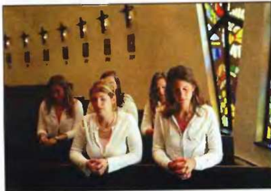
Η θρησκευτικότητα διακρίνει την Αμερική από τις περισσότερες άλλες Δυτικές κοινωνίες