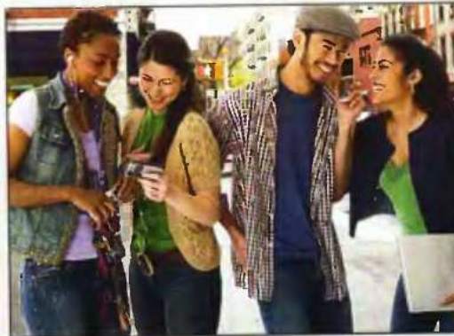
Το πολυπολιτισμικό κίνημα σκόπευε να αντικαταστήσει την κυρίαρχη αγγλοπροτεσταντική κουλτούρα της Αμερικής με άλλες κουλτούρες