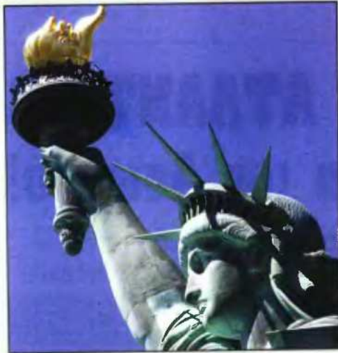
Οι Αμερικανοί αισθάνονται περήφανοι για τη χώρα τους σε πείσμα των ελίτ