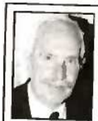
Του ΝΙΚΟΥ ΜΕΡΤΖΙΟΥ

Η θεατή σε αρκετούς πολιτική όψη της παγκοσμιοποίησης παραπέμπει σε κώδικες - κλειδιά οι οποίοι, με επίκεντρο τις Ηνωμένες Πολιτείες επίσης, επιδιώκουν ταυτόσημο το ίδιο αποτέλεσμα: την αποδόμηση των Εθνών, τον κατακερματισμό των Κρατών, την υπονόμηση της εθνικής κυριαρχίας, την πολτοποίηση της εκπαιδευτικής διαδικασίας, την αποσύνθεση των λαών σε αντίπαλες μεταξύ τους μειονότητες, τον κλονισμό της αυτοπεποίθησής και τη μετατροπή των πολιτών σε μιαν ομοιόμορφη αγέλη καταναλωτών.