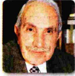
άρθρο του ΝΙΚΟΛΑΟΥ Ι. ΜΕΡΤΖΟΥ*

* Προέδρου της Εταιρείας Μακεδονικών Σπουδών, δημοσιογράφου και συγγραφέα