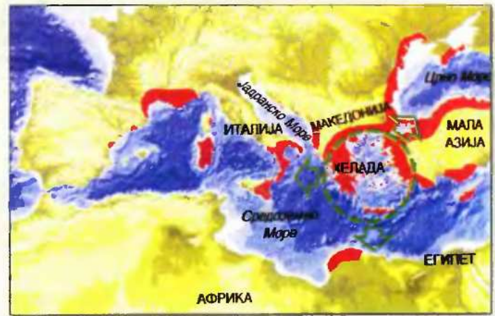
Χάρτης της Μακεδονίας κατά την Αρχαιότητα. (Ιστορικός Αβλαβός), Σκόπια 1992. Με κόκκινο χρώμα η Ελλάδα και οι ελληνικές αποικίες του 10ου και 9ου αιώνα π.Χ. όταν δεν υπήρχε συγκροτημένο μακεδονικό κράτος, όπως το παρουσιάζει ο χάρτης.