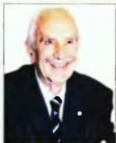
Του ΝΙΚΟΛΑΟΥ ΜΕΡΤΖΟΥ

Η γεωστρατηγική της Μακεδονίας και ιστορική ανασκόπηση του Μακεδονικού