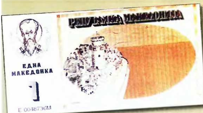
Χαρτονόμισμα της FYROM της δεκαετίας του 1990, στο οποίο απεικονίζεται η Θεσσαλονίκη και το έμβλημά της, ο Λευκός Πύργος.