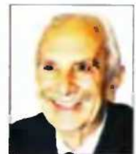
Γράφει ο Νίκος Μέρτζος Γεωστρατηγική και ιστορία του προβλήματος