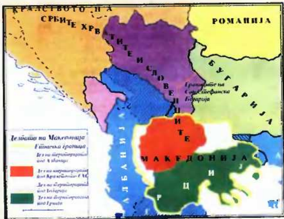
Χάρτης με τον τίτλο «Ο διαμελισμός της Μακεδονίας». Η κίτρινη γραμμή δηλώνει τα «εθνοτικά σύνορα» και με πρόβονο χρώμα οριοθετείται «το τμήμα της περιοχής υπό την Ελλάδα». (Εγκυκλίδιο Ιστορίας της Δημοκρατίας), Έκδοση 2005, σ. 54.

Εν τω μεταξύ, στη διάρκεια του Μεσοπολέμου η Ρωσία έχει μετασχηματισθεί σε Ένωση Σοβιετικών Σοσιαλιστικών Δημοκρατιών, γεγονός που για το νέο κομμουνιστικό καθεστώς σημαίνει ότι δικαί-