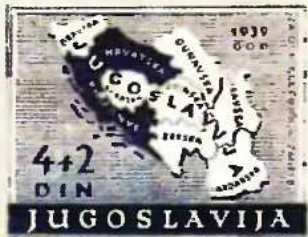
Γιουγκοσλαβικό γραμματοσήμο του 1939, με τον όρο Vardarska για τη σημερινή FYROM

Τ η Μακεδονία ήλεγαν αρχικά και διέσχιζαν στη συνέχεια όσες ιστορικές πολεμικές εκστρατείες άλλαξαν άρδην ή απείλησαν να αλλάξουν άρδην τον παγκόσμιο χάρτη. Ενδεικτικά από την Ανατολή προς τη Δύση πρώτοι οι Μίδοι και μετά οι Οθωμανοί. Από τη Δύση προς την Ανατολή διαδοχικά ο Μέγας Αλέξανδρος, οι Ρωμαίοι, οι Νορμανδοί και οι μοιραίοι Σταυροφόροι. Στους δύο Παγκόσμιους Πολέμους οι Γερμανοί, σύμμαχοι των Βουλγάρων, αναμετρήθηκαν στη Μακεδονία με τους Γάλλους και τους Αγγλούς, συμμάχους των Ελλήνων. Τον τελευταίο μισό αιώνα, τέλος, κατά τον Ψυχρό Πόλεμο Ανατολής-Δύσης, η Μακεδονία αποτελούσε ένα από τα κρισιμότερα σύνορα και ευάλωτα πεδία διαμάχης ανάμεσα στους δύο αντίπαλους κόσμους και στρατιωτικο-πολιτικούς συνα-