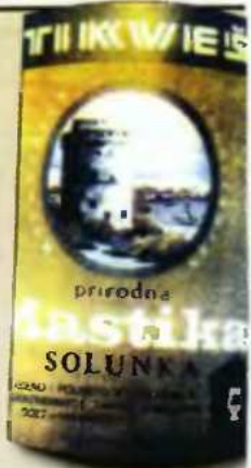
Επέκτο προϊόντος, στην οποία απεικονίζεται ο Λευκός Πύργος.

Οι Έλληνες Μακεδόνες επαναστατούν στον Ολυμπο και τα Πέτρια, στην Ελιμεία και την Άνω Μακεδονία. Οι άλλες Μεγάλες Δυνάμεις αντιδρούν, για να εξουδετερώσουν τη Ρωσία, και αμέσως στο Συνέδριο του Βερολίνου καταργούν τη Μεγάλη Βουλγαρία. Αναγνωρίζουν, όμως, υποτελή στο σουλτάνο την πρώτη Βουλγαρική Ηγεμονία, η οποία πολύ σύντομα προσαρτά την Ανατολική Ρωμυλία. Εκεί δημιουργηθεί πια ένα ισχυρό ορμητήριο και η Μεγάλη Ίδέα των Βουλγάρων, αντιπροσώπων της Ρωσίας, με αμετακίνητο στόχο τη Μακεδονία. Εκεί κυρούν όταν οι Έλληνες Μακεδόνες αντιδρούν σθεναρά στην παραπλάνηση, στον προσπλυτισμό, στην εξαγορά, στη διαβολή, ακόμη και στην απειλή. Αυτό το διάστημα ιδρύουν οι Βούλγαροι στη Θεσσαλονίκη την «Εσωτερική Μακεδονική Επαναστατική Οργάνωση», γνωστή με το βουλγαρικό αρτικλέκτο της ΒΜΡΟ, η οποία εξαπολύει τρομοκρατία στη Μακεδονία. Είναι ακριβώς το κόμμα που κυβερνά σήμερα το κράτος των Σκοπιών!