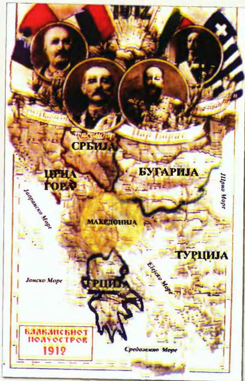
Εγχειρίδιο Ιστορίας της Δημοκρατίας. Τίτλος κάρτης: «Ο κάρτης της Βαλκανικής Χερσονήσου και οι βασιλείς του». Ο πρωτότυπος κάρτης του 1912 έχει παραπονήθει, προκειμένου να δηλωθούν τα «εθνοτικά και γεωγραφικά σύνορα της Μακεδονίας». (Σκόπιο 2005, σ. 16).

Το 1903, ημέρα του Προφήτη Ηλία, οι Βούλγαροι κηρύσσουν την εξέγερση του Τίντεν, ενώ προηγουμένως προβαίνουν σε θεαματικές τρομοκρατικές δυναμιτιστικές ενέργειες μέσα στη Θεσσαλονίκη. Το σύνθημά τους είναι «Η Μακεδονία στους Μακεδόνες», με στόχο την αυτονομία να διαδεχθεί η προσάρτηση της Μακεδονίας στη Βουλγαρία κατά το προηγούμενο της Ανατολικής Ρωμυλίας. Η διακήρυξη επεξηγεί ότι Μακεδόνες εννοεί όλους τους κατοίκους της γεωγραφικής αυτής περιοχής -Έλληνες, Βουλγάρους, Σέρβους, Αρβανίτες, Εβραίους, ακόμη και Τούρκους. Τα αντίποινα των Οθωμανών είναι τρομερά, τα θύματα στα πυρπολημένα χωριά εκατοντάδες άμαχα και αθώα γυναίκοπαίδα. Οι γραβατωμένοι Βραχμάνες του Γένους στους αθηναϊκούς καφεζέδες κηρύσσουν χαρήνη τη Μακεδονία. Όχι, όμως, και το Έθνος. Το 1904 ανέρχεται στη Μακεδονία, επί κεφαλής 40 Μακεδονομάχων, ο Παύλος Μελάς και σύντομα πέφτει νεκρός στα Κορέστια στο χωριό Στάπτιοα. Ο θάνατός του θα σημαίνει ανασταση. Συγκλονίζεται και αφυπνίζεται η Αθήνα, συναγειρείται ο ζωντανός ελλητισμός, παλικάρια από την Κρήτη και τον Μωριά, από τη Ρούμελη και τα νησιά, ακόμη κι από την Κύπρο τρέχουν στη Μακεδονία, αγωνίζονται, υπερασπίζονται, τιμωρούν και πολλά μαρτυρούν. Μέσα σε 4 χρόνια οι Έλληνες επικρατούν. Όμως, αν δεν είχαν εγερθεί, αγωνισθεί και θυσιασθεί κατά χιλιάδες οι αυτάρχθονες ολαβόφοροι Μακεδόνες, τα πάντα θα είχαν καθεί.