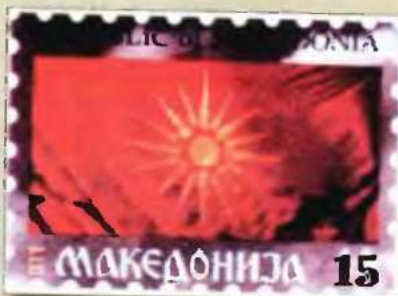
Γραμματόσημο που απεικονίζει τον ήλιο της Βεργίνας. Κυκλοφόρησε από το Κρατικό Ταχυδρομείο της FYROM το 1992.