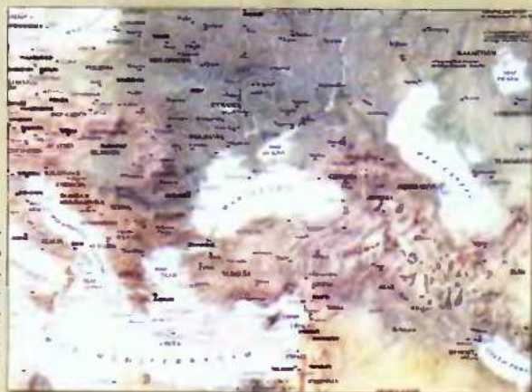
Η σύγχρονη Μεσοβαλκανική Ζώνη, ο συντομότερος στρατηγικός δρόμος της Δύσης από την Αδριατική προς τη Μαύρη Θάλασσα, την Κασπία και την Υπερκασπία.