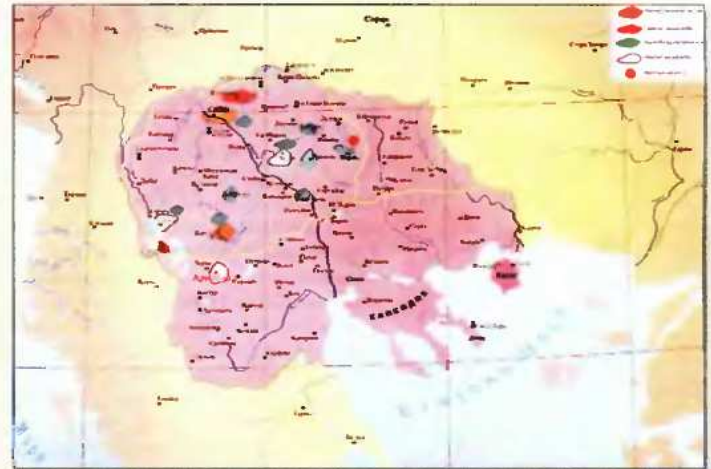
Χάρτης της Μακεδονίας κατά την προϊστορική περίοδο όπως μας λέει ο ιστορικός Άβλας των Σκοπιών. Μόνο που κατά την προϊστορική περίοδο δεν υπήρχε Μακεδονικό κράτος.

Το 1878, ύστερα από νικηφόρα πολεμική προέλαση στο πρόστιο Αγίου Στέφανου της Κωνσταντινούπολης, η Ρωσία εξαναγκάζει την Οθωμανική Αυτοκρατορία να αναγνωρίσει τη Μεγάλη Βουλγαρία στην οποία ενσωματώνεται η Μακεδονία.