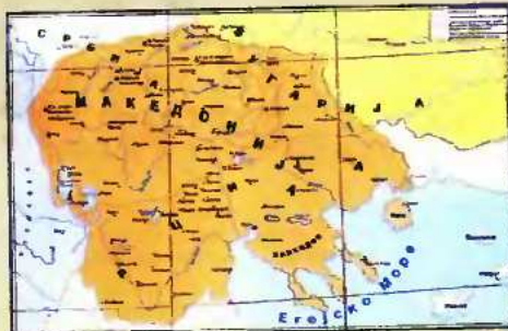
Τίτο-Δημητρώφ το 1947 προέβλεπε την ένταξη της Βουλγαρίας, ως Ομοσπονδίας Δημοκρατίας, στη ΣΟΔΓ, την αναγνώριση «μακεδονικής μειονότητας» στη βουλγαρική «Μακεδονία του Πλίν» και την κατάκτηση ολόκληρης της ελληνικής Μακεδονίας.

Κρατικό απόρρητο αρχεία σήμερα επιβεβαιώνουν ότι η συμφωνία του Μπλενι με ταξύ