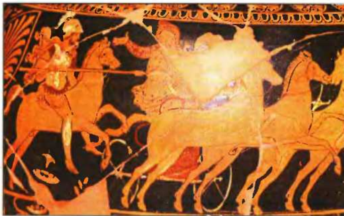
Το ακόντιο του Αλεξάνδρου τρέπει σε φυγή τον Δαρείο (αμφωρέας από την Κάτω Ιταλία, 4ος αι. π.Χ.)

δου «Ο Μέγας Αλέξανδρος στην περσική επική ποίηση».