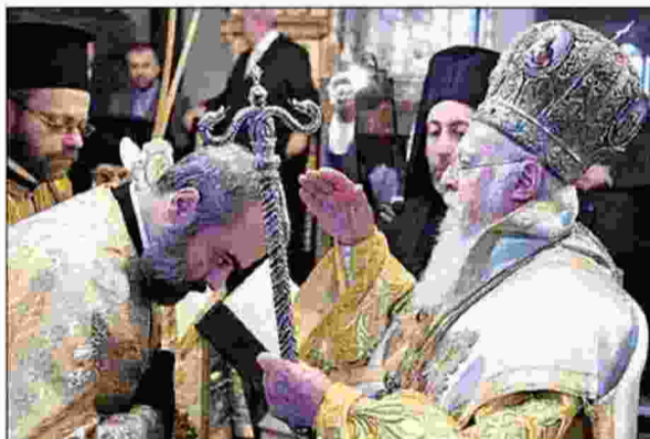
Η χειροτονία του νέου μητροπολίτη Σμύρνης από τον Οικουμενικό Πατριάρχη

Συλλήψεις, εκτοπισμοί, βιασμοί, βασανιστήρια και εν ψυχρώ δολοφονίες ηλικιωμένων, γυναικών και βρεφών ολοκληρώνουν τη δαυτική εικόνα των τελευταίων ωρών της αρχόντισσας Σμύρνης.