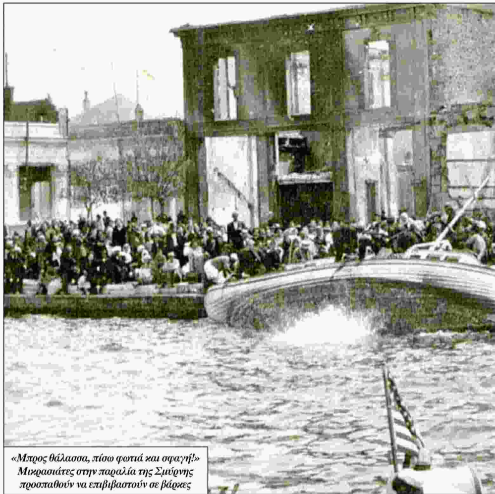
«Μπρος θάλασσα, πίσω φωτιά και σφαγή!» Μικρασιάτες στην παραλία της Σμύρνης προσπαθούν να επιβιβαστούν σε βάρκες

Η θάλασσα δεν είναι πια εμπόδιο. Χιλιάδες άνθρωποι πέφτουνε και πνίγονται. Τα κορμιά σκεπάζουνε τα νερά σα να 'ναι μώλος. Οι δρόμοι γεμίζουνε κι αδειάζουνε και ξαναγεμίζουνε. Νέοι, γέροι, γυναίκες, παιδιά ποδοπατούνται, στριμώχνονται, λιπο-