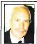
Του ΝΙΚΟΥ ΜΕΡΤΖΟΥ*

Με απαξιωτικούς χαρακτηρισμούς και ασύστατες πληροφορίες το δημοσίευμα προσβάλλει τη Θεσσαλονίκη, την ιστορική αλήθεια, την κοινή νοημοσύνη και τον Μεγάλο Αναμορφωτή.