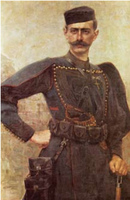
Πάυλος Μελάς, η θυσία του εσήμανε την ανάσταση.

Αλλά τα ειρηνικά διαλείμματα είναι ολιγοστά. Τα επόμενα χρόνια ξεσπούν νέες θύελλες. Η Ρωσική Αυτοκρατορία τώρα πια κλυδωνίζεται και εντέλει αυτοβυθίζεται. Τη διαδέχεται η Γερμανία, η οποία στους δύο Παγκοσμίους Πολέμους χρησιμοποιεί ως σύμμαχο όργανό της τη Βουλγαρία επιδιώκοντας την αυτοκρατορική γερμανική επικράτηση προς Ανατολάς: την περίφημη Drag nach Osten .