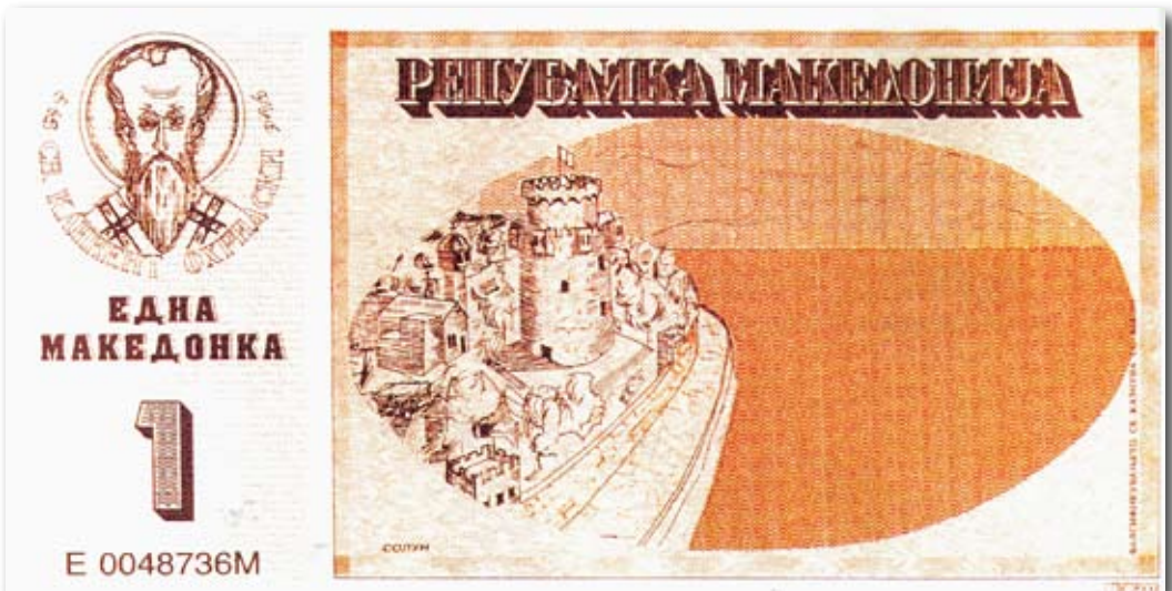
Αναμνηστικό χαρτονόμισμα συναλλακτικής αξίας που κυκλοφόρησε στα Σκόπια ευθύς μετά την ανεξαρτησία τους. Εικονίζεται η Θεσσαλονίκη.