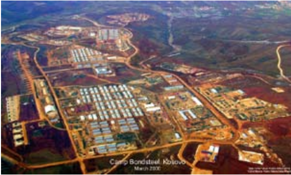
Η αμερικανική στρατιωτική βάση Bondsteel στο Κοσσυφοπέδιο, στα σύνορα με τα Σκόπια.

της ψυχροπολεμικής εποχής (NATO, προνομιακή συμμαχία με την Αμερική, δυτική άμυνα κατά των Σλάβων κ.ά.), στον θρίαμβο του δυτικού συνασπισμού επί του ανατολικού, στην ιστορία και στις αμερικανικές προτροπές προς οικονομική «διείσδυση» στα Βαλκάνια. Έτσι, τα επόμενα 22 χρόνια η Αθήνα δεν κατόρθωσε να κατανοήσει τη νέα αμερικανική στρατηγική, να αναλύσει τη νέα ισορροπία στην περιοχή μας και να εξισορροπήσει τα αμερικανικά συμφέροντα με τα ελληνικά.