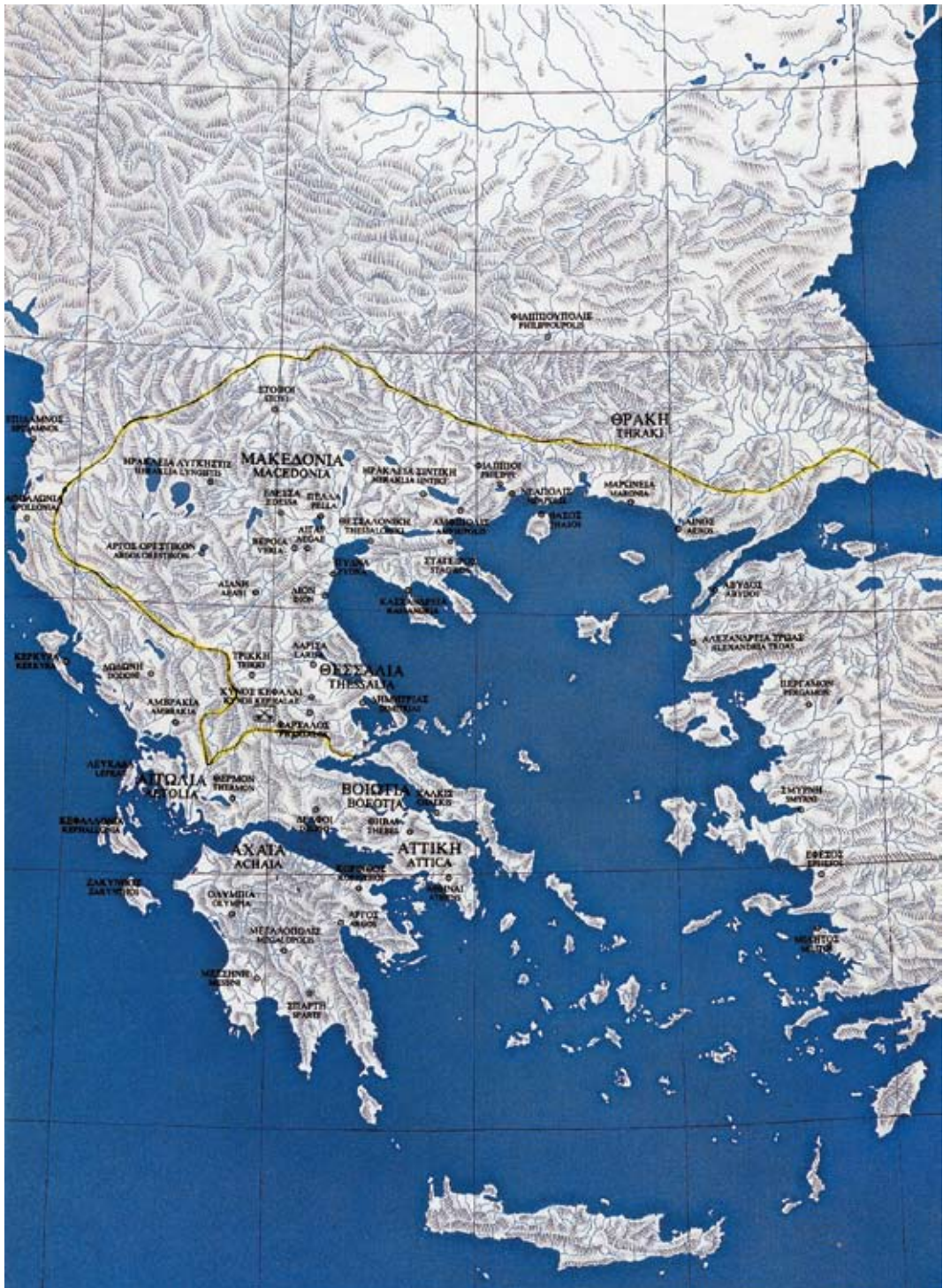
Η Μακεδονία γέφυρα Δύσης – Ανατολής και Βορρά – Νότου.