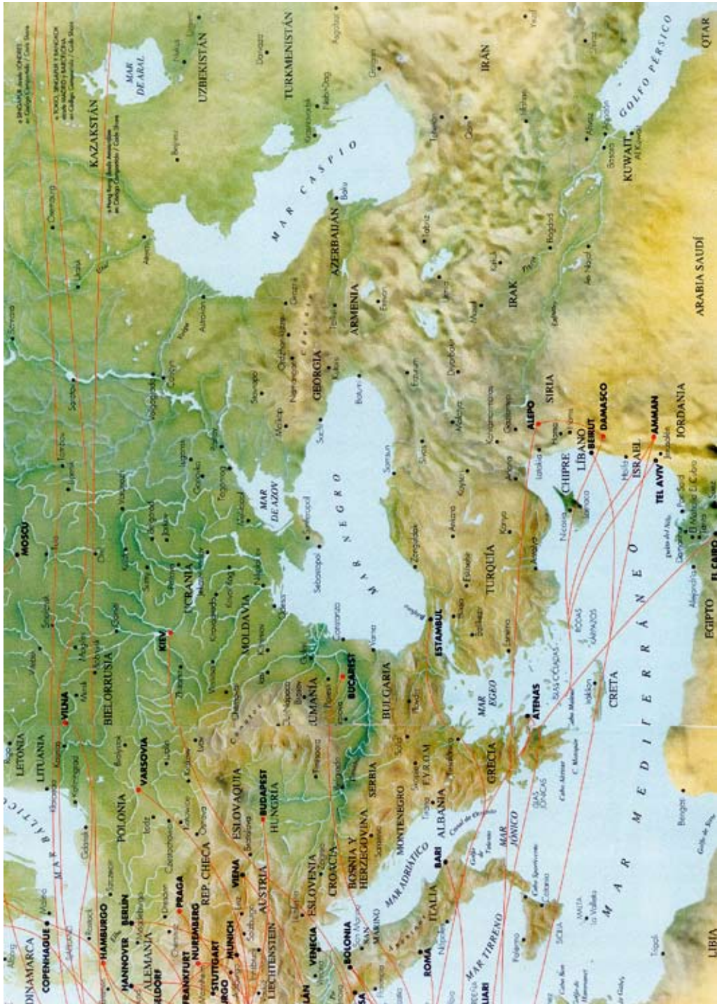
Η σύγχρονη Μεσοβαλκανική Ζώνη, ο συντομότερος στρατηγικός δρόμος της Δύσης από την Αδριατική προς τη Μαύρη Θάλασσα, την Κασπία και την Υπερκαυκασία.