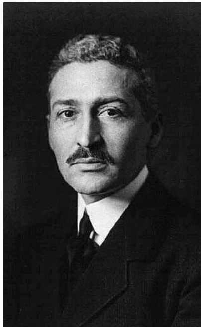
Ίων Δραγούμης, ο Μακεδών Εθναπόστολος.

Το 1908 επαναστατούν στη Μακεδονία οι Νεότουρκοι: υπόσχονται ελευθερία και ισοπολιτεία