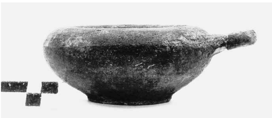
Εικ. 11. Γκρίζο εξάλειπτρο ΘΕ 267.