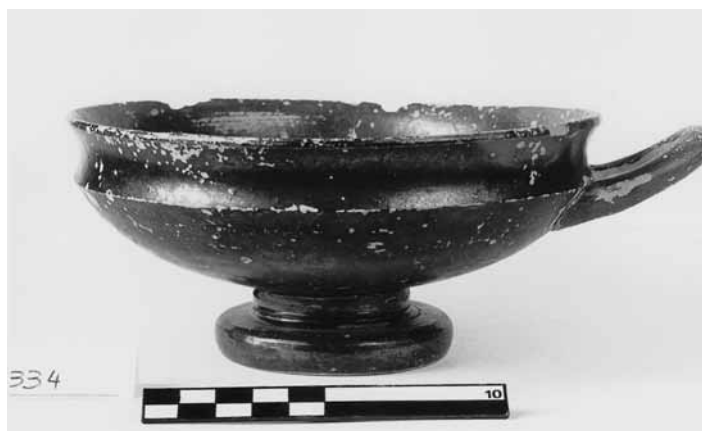
Εικ. 4. Αττική μελαμπαφής κύλικα τύπου Γ ΘΕ 334.