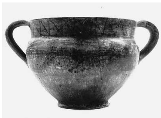
Εικ. 17. Γκρίζα κανθαροειδής κοτύλη ΘΕ 269.