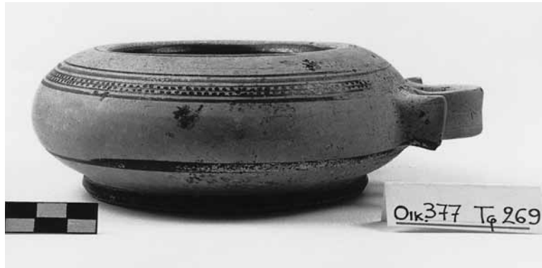
Εικ. 1. Εξάλειπτρο τάφου 269 / Οικ. 377.