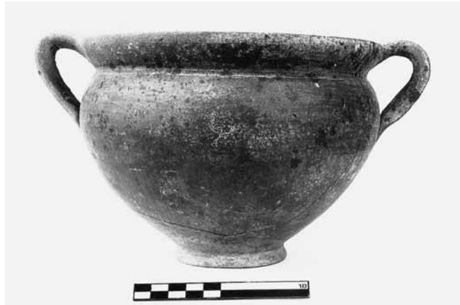
Εικ. 19. Γκρίζα κανθαροειδής κοτύλη ΘΕ 262.