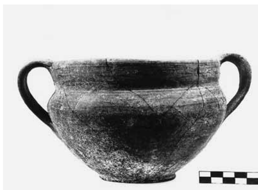
Εικ. 18. Γκρίζα κανθαροειδής κοτύλη ΘΕ 475.