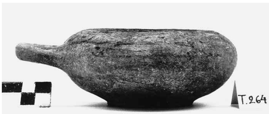
Εικ. 10. Γκρίζο εξάλειπτρο ΘΕ 335.