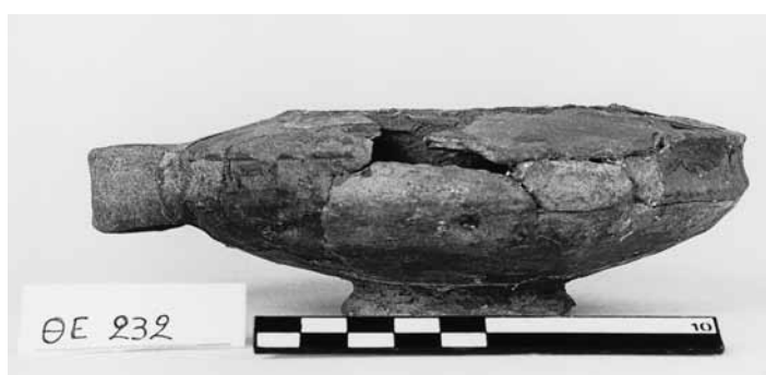
Εικ. 6. Γκρίζο εξάλειπτρο ΘΕ 232.