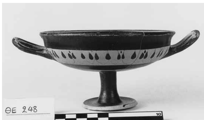
Εικ. 5. Αττική ταινιωτή κύλικα ΘΕ 248.