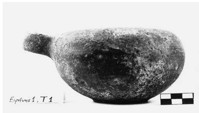
Εικ. 14. Γκρίζο εξάλειπτρο τάφου 1, οδού Ειρήνης 1.