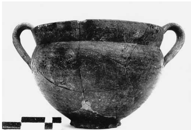
Εικ. 20. Γκρίζα κανθαροειδής κοτύλη ΘΕ 347.