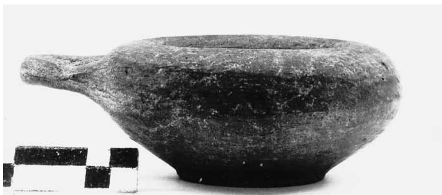
Εικ. 12. Γκρίζο εξάλειπτρο ΘΕ 270.