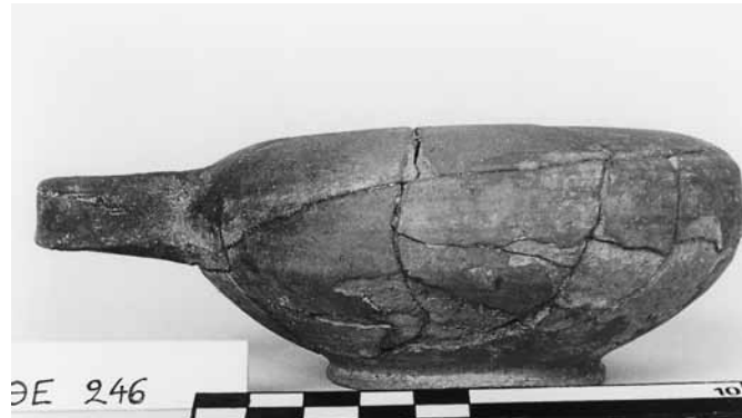
Εικ. 13. Γκρίζο εξάλειπτρο ΘΕ 246.