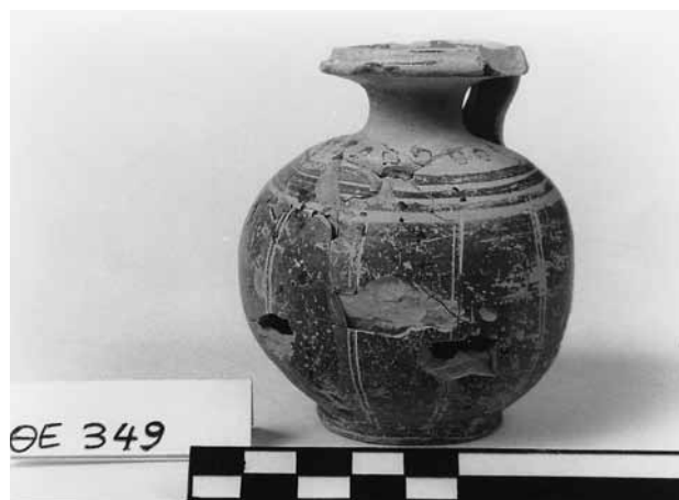
Εικ. 3. Σφαιρικός ατύβαλλος με βάση ΘΕ 349.