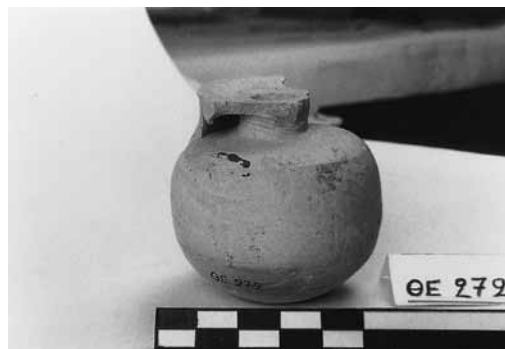
Εικ. 2. Σφαιρικός ατύβαλλος ΘΕ 272.