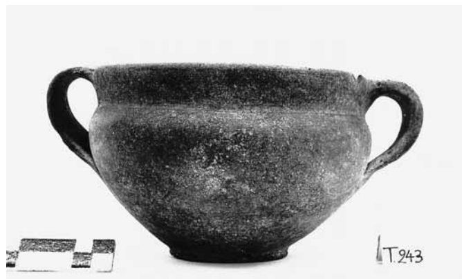
Εικ. 15. Γκρίζα κανθαροειδής κοτύλη ΘΕ 333.