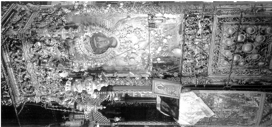
Εικ. 2. Το προσηνιητάριο του 1794 με την εικόνα του αγίου Γεωργίου Αχειροποιήτου.