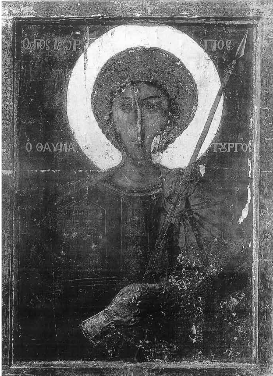
Εικ. 5. Άγιος Γεώργιος εξ Αραβίας χωρίς την επένδυση.