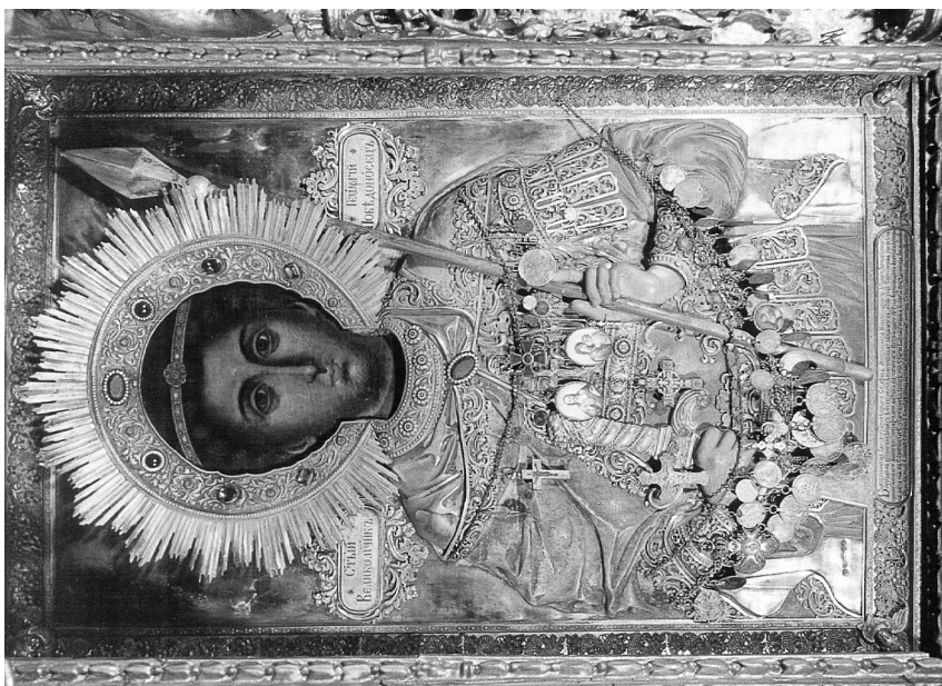
Εικ. 6. Άγιος Γεώργιος εκ Μολδαβίας.