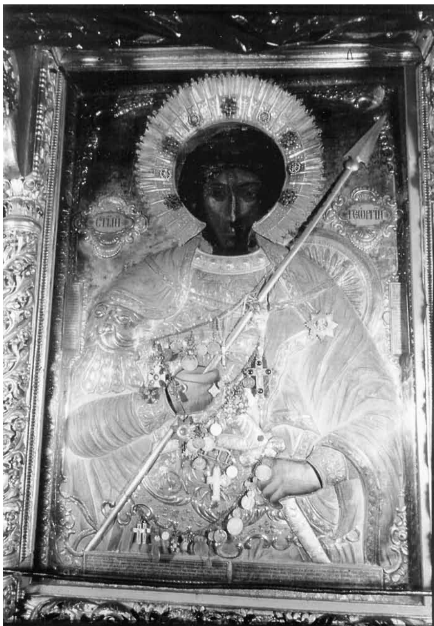
Εικ. 4. Άγιος Γεώργιος εξ Αραβίας.