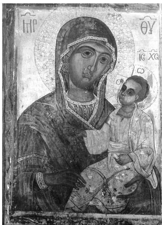
Εικ. 10. Παναγία Εσφαγμέ- νη.