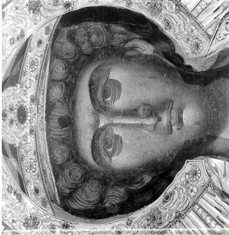
Εικ. 3. Άγιος Γεώργιος Αχειροποιήτος (λεπτομέρεια).