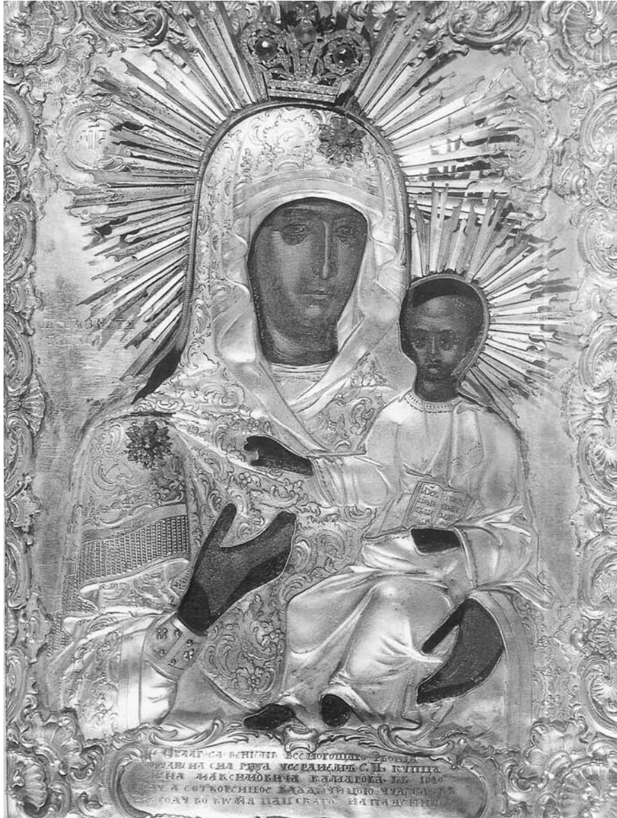
Εικ. 8. Παναγία Προαγγελομένη.