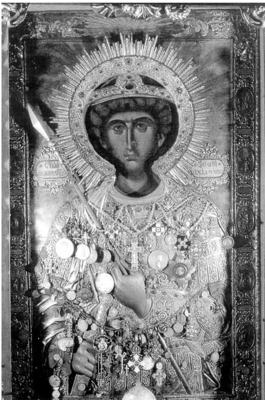
Εικ. 1. Άγιος Γεώργιος Αχειροποίητος.