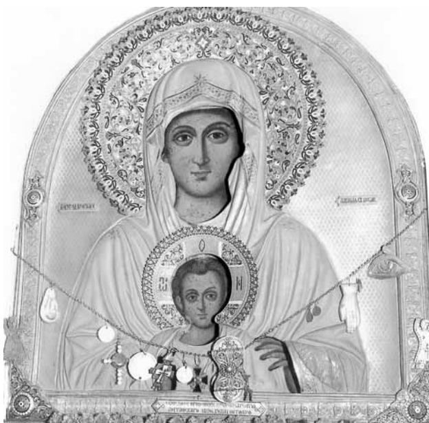
Εικ. 9. Παναγία Ελακού- ουσα.