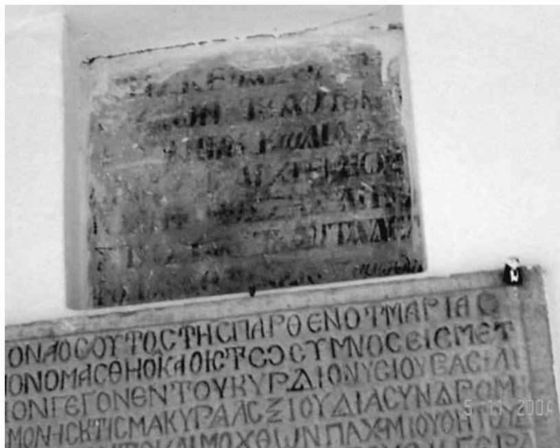
Εικ. 2. Ἡ ἐπιγραφή τῆς ἀνακαίνισης τοῦ ναοῦ τῆς Παναγίας Φανερωμένης.