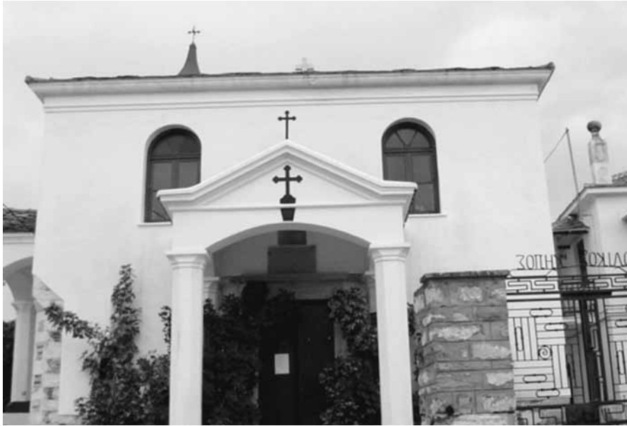
Εικ. 1. Ἡ ἐκκλησία τῆς Παναγίας Φανερωμένης.