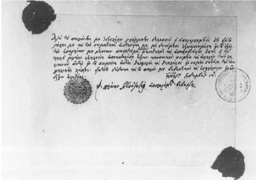
Εἰκ. 3. Ἡ παραίτηση τοῦ πρ. Νύσσης Ἰωσήφ.