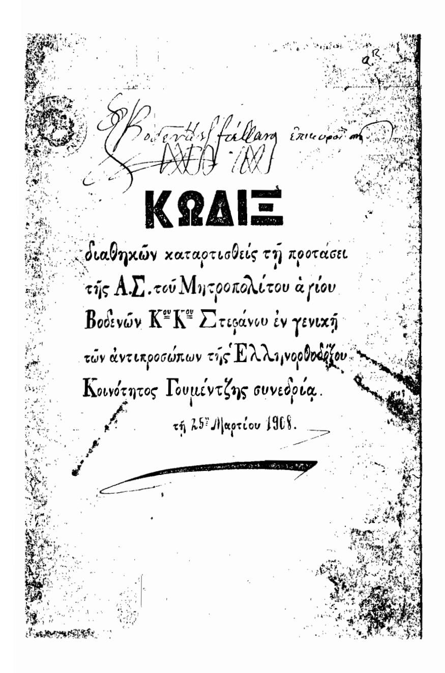
Το εξώφυλλο του κώδικα (\varphi.\alpha^R) με την ιδιόγραφη επικύρωση του Μητροπολίτη Βοδενών Στεφάνου.