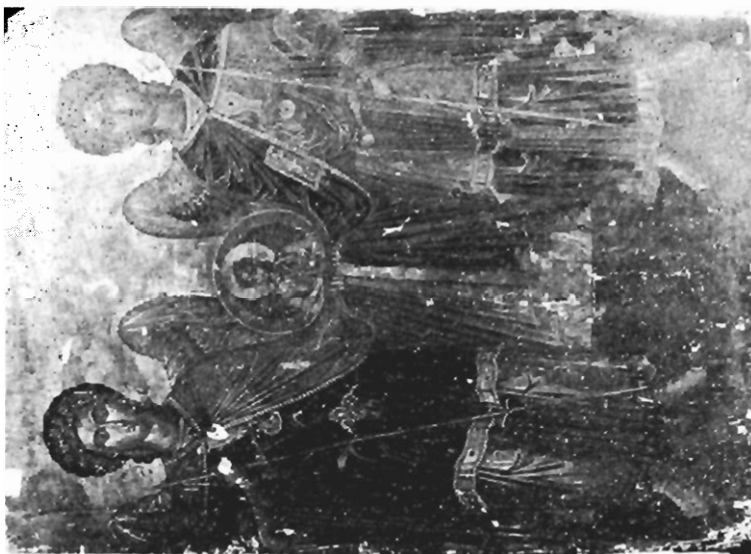
Εικ. 1. Μονή Μεγίστης Λαύρας. Εικόνα Συνάξεως τῶν Ἀρχαγγέλων.