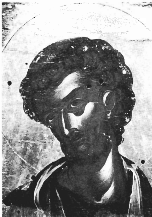
Είχ. 4. Μονή Ζάβορδας. Ὁ ἀπόστολος Λουκᾶς, λεπτομέρεια ἀπό τμήμα ἐπιστυλίου μέ θέμα τή Μεγάλη Δέηση.