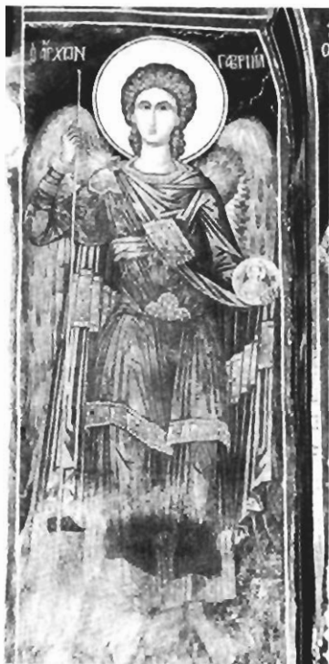
Είχ. 3. Μονή Μεγίστης Λαύρας. Ὁ ἄρχων Γαβριήλ ἀπό τό παρεκκλήσιο τοῦ ἁγίου Νικολάου (1560).