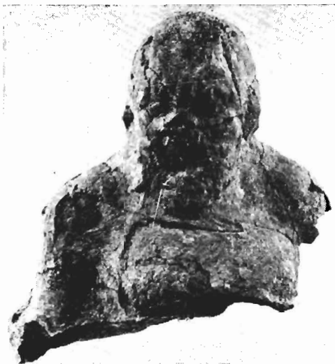
α. Τμήμα ειδωλίου, Μουσείο Πέλλας, αρ. ΒΕ 1976/302φ.