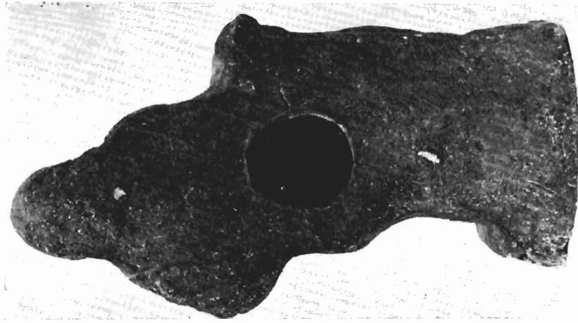
β. Ειδώλιο παιδαγωγού, Μουσείο Πελλάς, αφ. 1978/87, πίσω όψη.