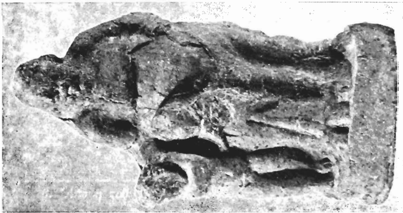
α. Ειδώλιο παιδαγωγού, Μουσείο Πέλλας, αρ. ΒΕ 1978/85.