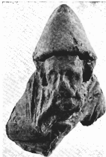
β. Τμήμα ειδωλίου παιδαγωγού(;) , Μουσείο Πέλλας, αρ. Ε 1544.