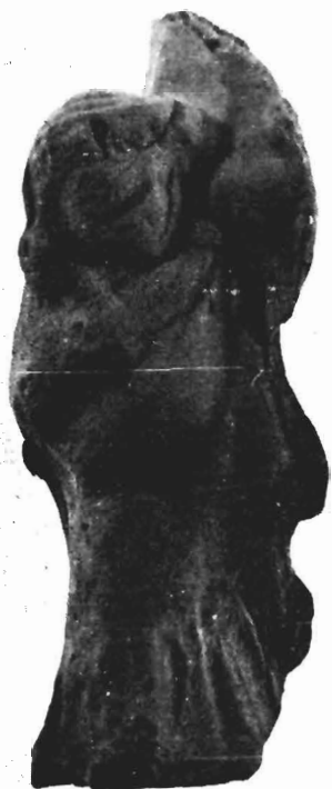
α. Τμήμα ειδωλίου, Μουσείο Πέλλας, αρ. E 233.