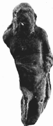
γ. Τμήματα ειδωλίων, Μουσείο Πέλλας, αρ. E 1347, E 599.