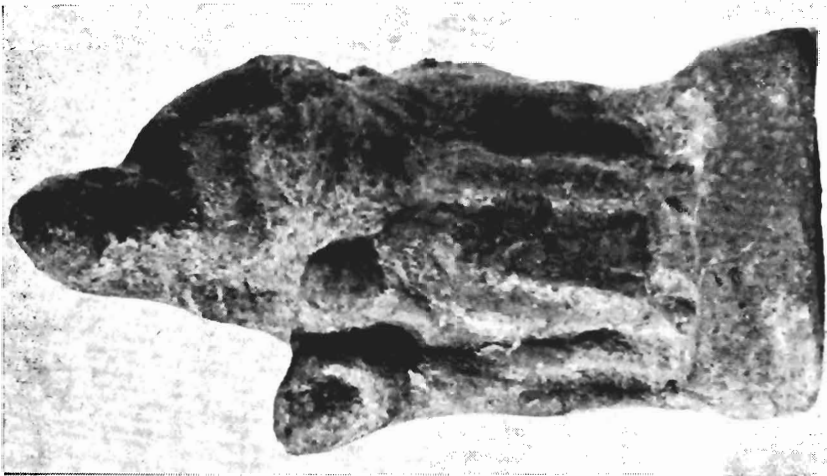
β. Ειδώλιο παιδαγωγού, Μουσείο Πέλλας, αρ. ΒΕ 1978/92.