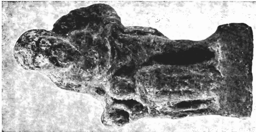
γ. Ειδώλιο παιδαγωγού, Μουσείο Πέλλας, αρ. ΒΕ 1978/93.