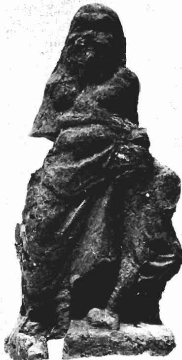
β. Ειδώλιο παιδαγωγού, Μουσείο Πέλλας, αρ. BE 1981/150.