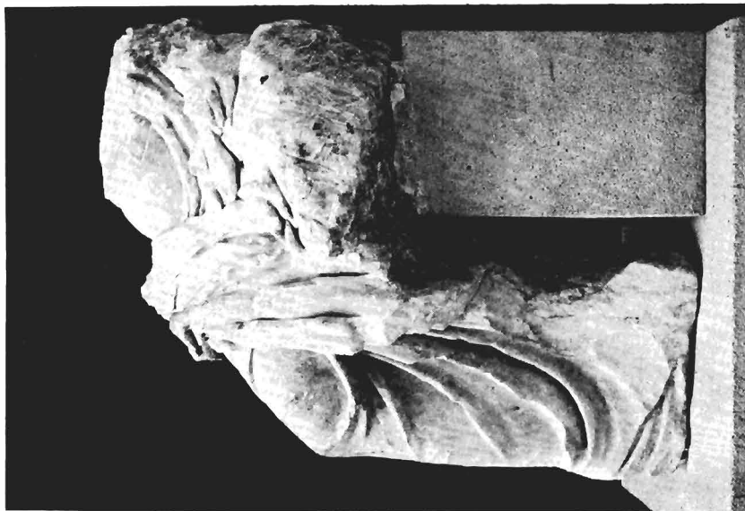
β. 'Αγαλμα αρ. ΓΛΠ Μουσείου Πέλλας. Πλάγια αριστερή πλευρά.