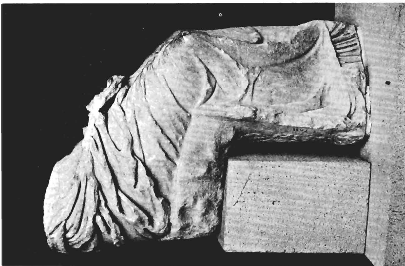
α. 'Αγαλμα αρ. ΓΛΠ Μουσείου Πέλλας. Πλάγια δεξιά πλευρά.