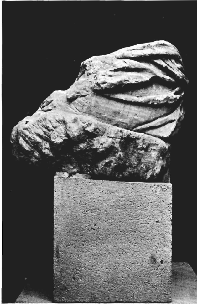
Άγαλμα αρ. ΓΑ 11 Μουσείου Πέλλας. Η πίσω πλευρά.