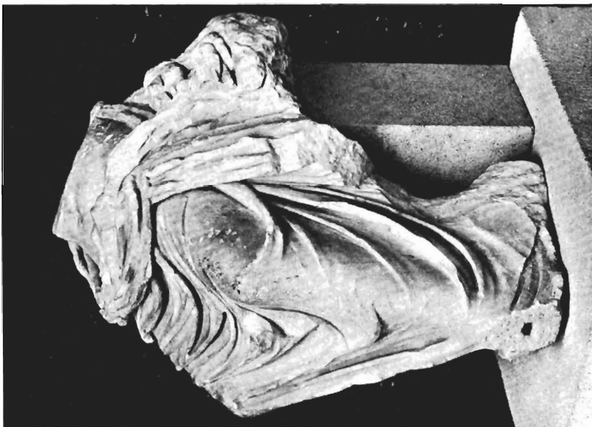
α. Ἀγαλμα αἰ. ΓΑΠΠ Μουσείου Πέλλας. Κόρυμα ὄψη.