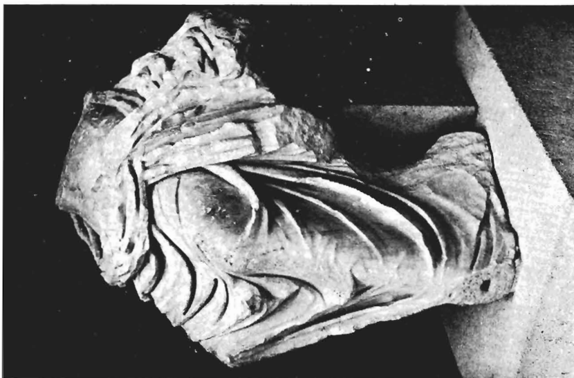
β. Ἀγαλμα αἰ. ΓΑΠΠ Μουσείου Πέλλας. Κόρυμα ὄψη.