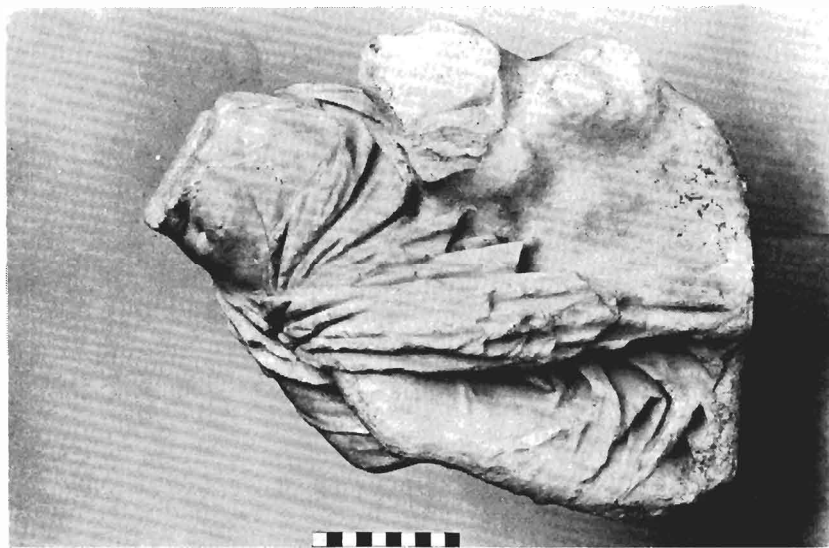
α. 'Αγαλμα S 1530 Αρχαίας Αγοράς Αθηνών. Πλάγια αριστερή πλευρά.