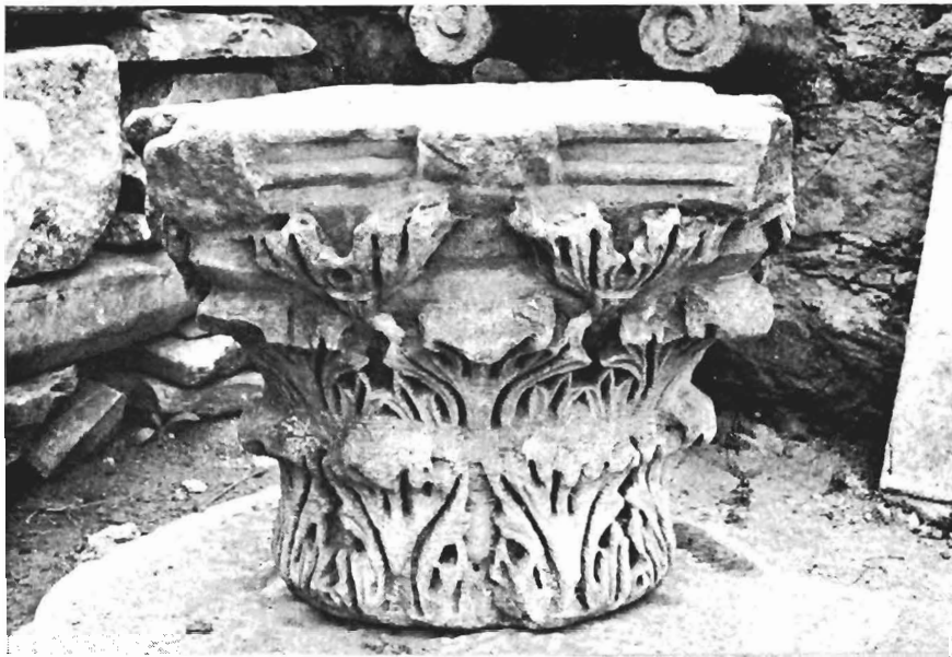
α, β. Κορινθιακό κιονόκρανο ΑΓ 44 (άρ. κατ. 10)