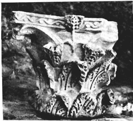
γ. Κιονόκρανο με άνεμιζόμενα φύλλα ΑΓ 38 (άρ. κατ. 24)