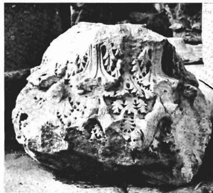
β,γ. Κιονόκρανο με ζῶα ΑΓ 45 (ἀρ. κατ. 31)