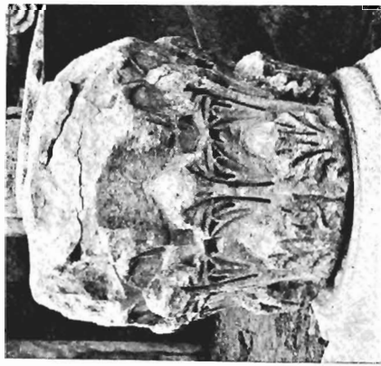
β. Κορινθιακό κιονόκρανο ΑΓ 27 (άρ. κατ. 6)