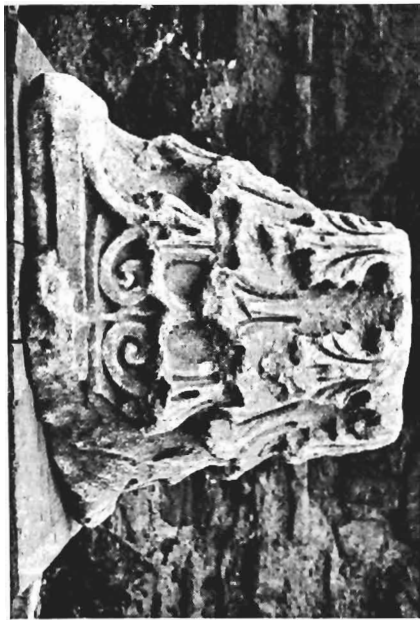
α. Κορινθιακό κιονόκρανο ΑΓ 28 (άρ. κατ. 5)