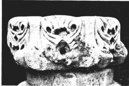
α. Τμήμα κορινθιακού κιονοκράνου ΑΓ 22 (ἀο. κατ. 15)