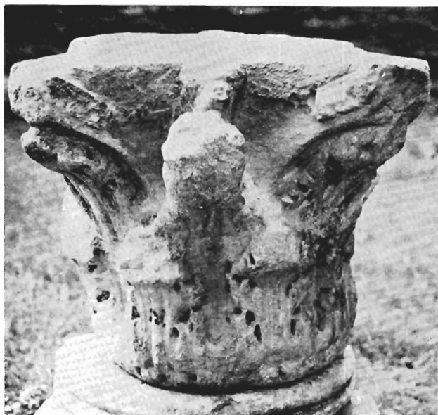
α. Κιονόκρανο με ζῶα ΑΓ 9 (ἀρ. κατ. 25)