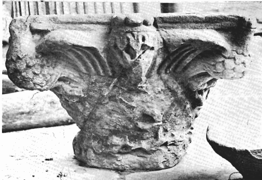
α. Κιονόκρανο με ζῶα ΑΓ 99 (ἀρ. κατ. 30)