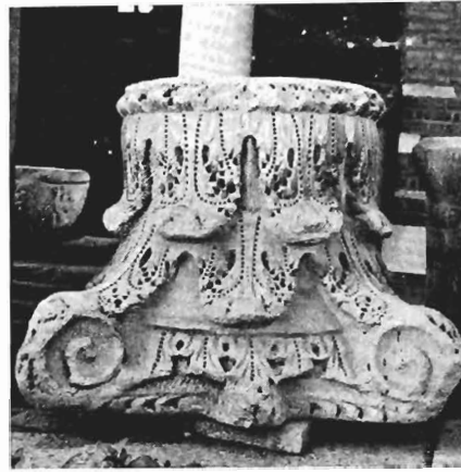
β. Θεοδοσιανό κιονόκρανο ΑΓ 4 (άρ. κατ. 23)