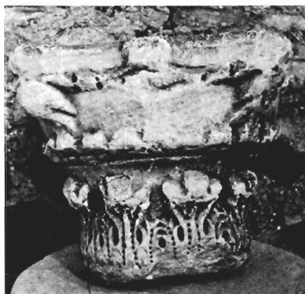
γ. Κιονόκρανο με ζῶα ΑΓ 42 (ἀρ. κατ. 27)