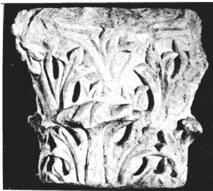
α. Κορινθιακό κιονόκρανο ΑΓ 48 (ἀρ. κατ. 17)