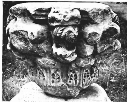
γ, δ. Κιονόκρανο με ζῳα ΑΓ 21 (ἀρ. κατ. 29)