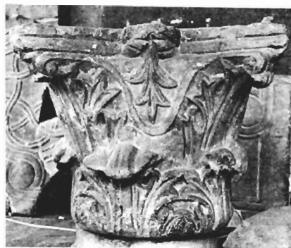
β. Κορινθιακό κιονόκρανο ΑΓ 1 (ἀρ. κατ. 19)