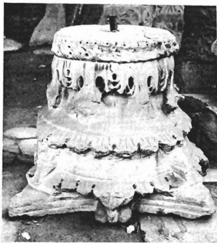
β. Κιονόκρανα με ζῶα ΑΓ 8 (ἀρ. κατ. 26)