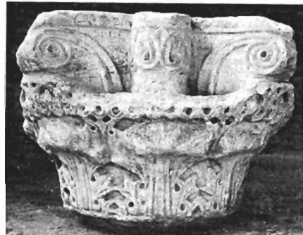
δ. Κορινθιακό κιονόκρανο ΑΓ 39 (άρ. κατ. 32)