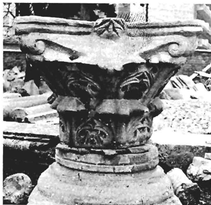
α. Κορινθιακό κιονόκρανο ΑΓ 24 (ἀρ. κατ. 11)