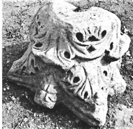
β. Κορινθιακό κιονόκρανο ΑΓ 46 (ἀο. κατ. 16)