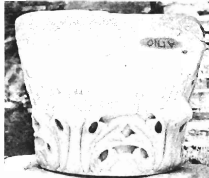
γ, δ. Κορινθιακό κιονόκρανο ΑΓ 110 (ἀο. κατ. 18)