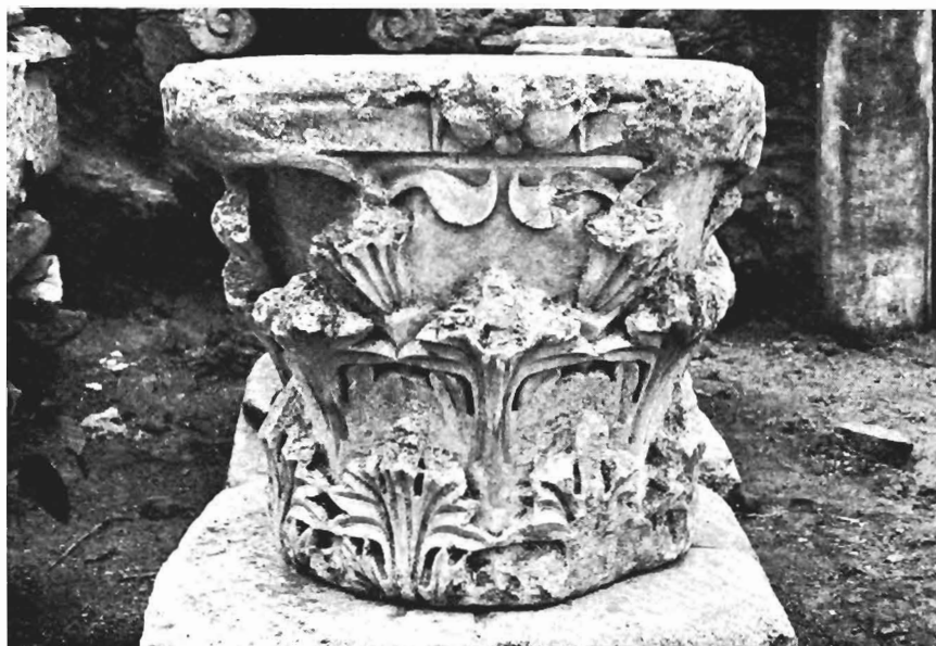
α. Κορινθιακό κιονόκρανο ΑΓ 16 (ἀρ. κατ. 3)