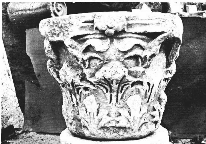
β. Κορινθιακό κιονόκρανο ΑΓ 17 (ἀρ. κατ. 4)