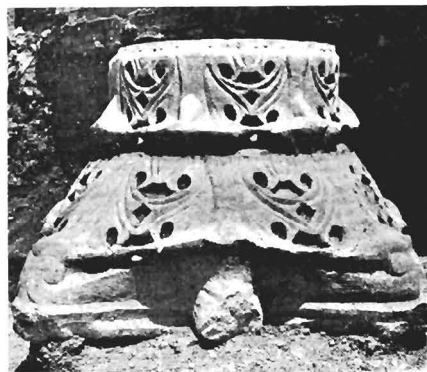
δ. Κορινθιακό κιονόκρανο ΑΓ 894 (ἀρ. κατ. 14)