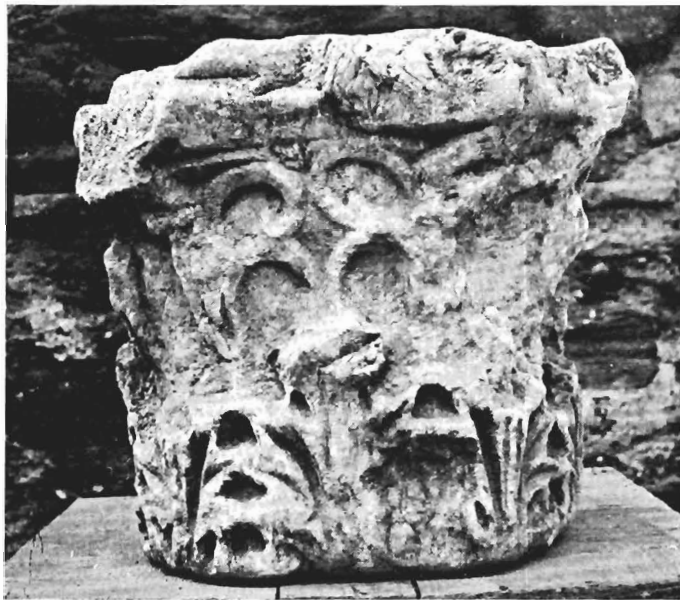
β. Κορινθιακό κιονόκρανο ΑΓ 26 (άρ. κατ. 9)