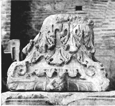
α. Θεοδοσιανό κιονόκρανο ΑΓ 10 (άρ. κατ. 22)