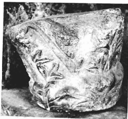
γ. Κορινθιακό κιονόκρανο ΑΓ 3 (ἀρ. κατ. 20)