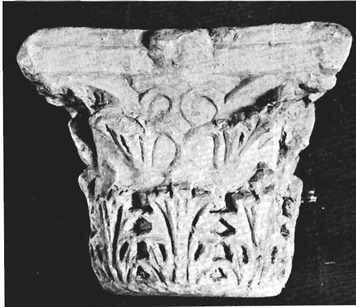
α. Κορινθιακό κιονόκρανο ΑΓ 47 (άρ. κατ. 8)