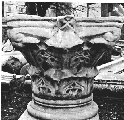
β. Κορινθιακό κιονόκρανο ΑΓ 23 (ἀρ. κατ. 12)