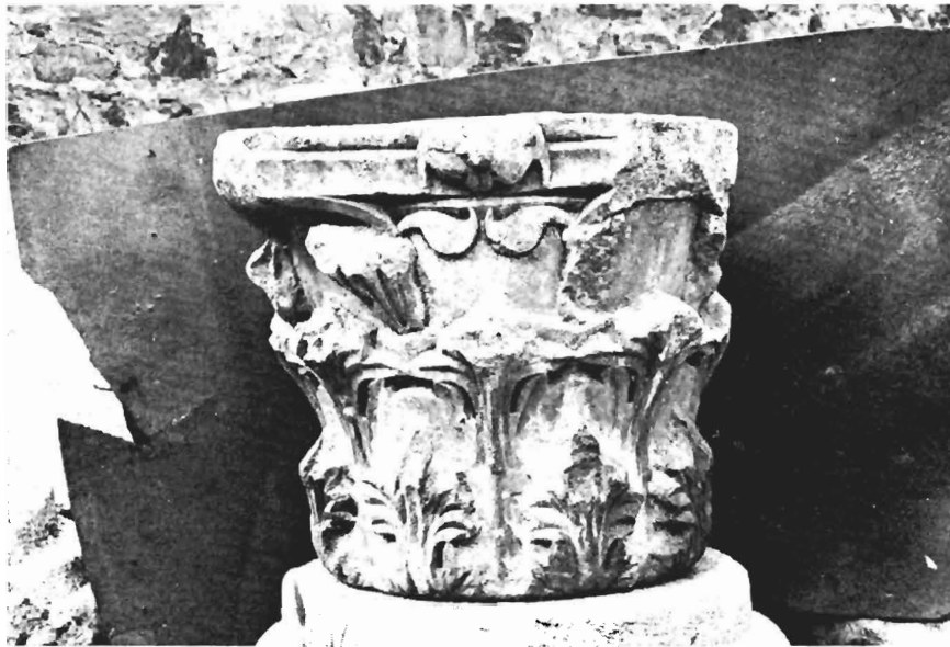
β. Κορινθιακό κιονόκρανο ΑΓ 19 (άρ. κατ. 2)