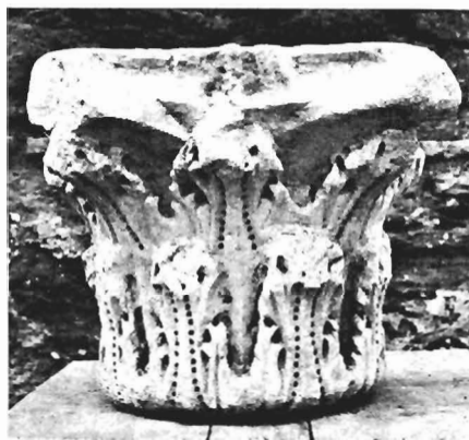
δ. Κορινθιακό κιονόκρανο ΑΓ 29 (ἀρ. κατ. 21)