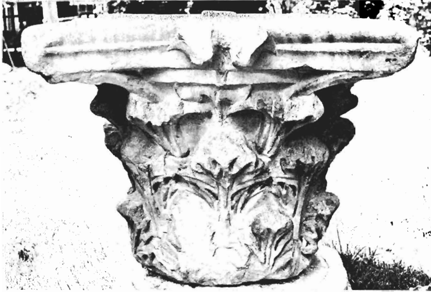
α. Κορινθιακό κιονόκρανο ΑΓ 2 (άρ. κατ. 1)