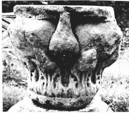
α, β. Κιονόκρανο με ζῳα ΑΓ 20 (ἀρ. κατ. 28)