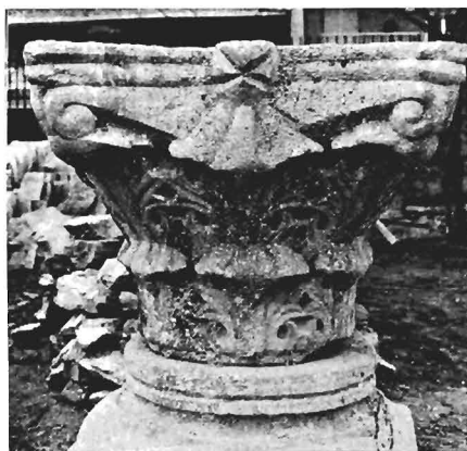
γ. Κορινθιακό κιονόκρανο ΑΓ 25 (ἀρ. κατ. 13)