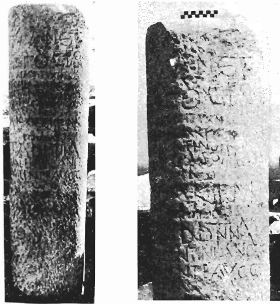
Εἰκ. 5 - 6. Μιλιάριον ὑπ' ἀριθ. 3.

Παρατηρήσεις: Ἡ Α' ἐπιγραφή (1,2,3,4,5,6,7,8,9,10,11) — διάστιχον 0,015μ - 0,02μ — χρονολογεῖται πιθανὸν εἰς τοὺς χρόνους τοῦ Γορδιανοῦ Γ' (238-244). Ὁ τύπος παρὰ C a g n a t, ἔ.ἀ., σ. 278 (8η ὁμάς). Ἡ Β' ἐπιγραφή (ἀριθμοὶ ἐντὸς παρενθέσεων) ἐπὶ αὐτοκράτορος Φλ. Κλ. Ἰουλιανοῦ (355-363) καὶ συγκεκριμένως μετὰ τὸ 360, χρονολογίαν ἀναγορεύσεώς του εἰς Αὐγούστον (πβλ. C a g n a t, ἔ.ἀ.,σ.245). Ἡ Γ' τέλος, ἡ λατι-