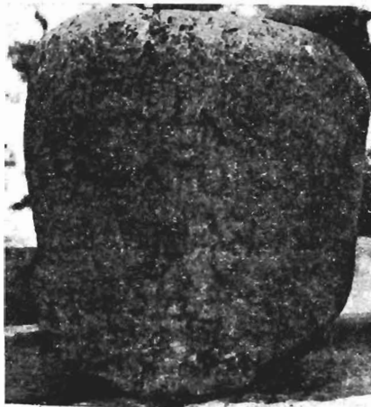
Εἰκ. 7. Μιλιάριον ὑπ' ἀριθ. 4.

Π α ρ α τ η ρ ῆ σ ε ι ς: Ἡ A' ἐπιγραφή τῆς πρώτης ὄψεως, ἡ ἐλληνικὴ, χρονολογεῖται εἰς τοὺς χρόνους τοῦ Γαλ. Βαλ. Μαξιμιανοῦ (293-311), συγκεκριμένως δὲ μετὰ τὸ ἔτος 305 (πβλ. C a g n a t, ἔ.ἀ., σ. 236). Ὁ τύπος παρὰ C a g n a t, ἔ.ἀ., σ. 278 (8ῃ ὁμάς). Ἡ ἐπιγραφή τῆς B' ὄψεως, εἰς τοὺς χρόνους τοῦ Φλ. Ἰοβιανοῦ (27 Ἰουνίου 363-16 Φεβρουαρίου 364).