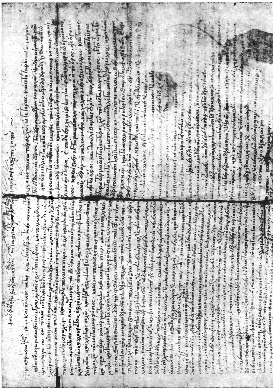
Εικ. 2. Η αρχή του χειρογράφου της διαθήκης του Όσίου Νικάνορος.