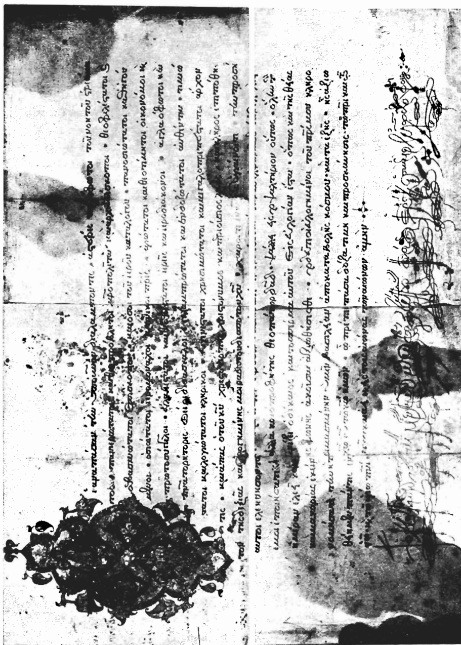
Εἰκ. 6. Ἡ ἀπαταγῶσα τοῦ ἡγουμένου Φιλοθέου (ἀρχὴ καὶ τέλος τοῦ χειρογράφου).