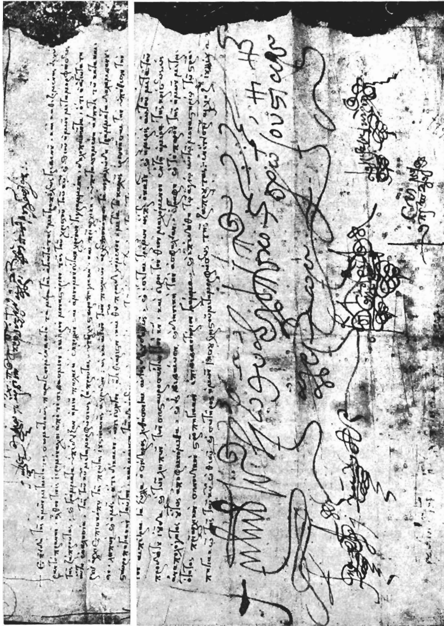
Εἰκ. 4. Τὸ σιγβλίον τοῦ ἀρχιεπισκόπου Ἀχιλλῶν Μελετίου (ἀρχή) καὶ τέλος τοῦ χειρογράφου.