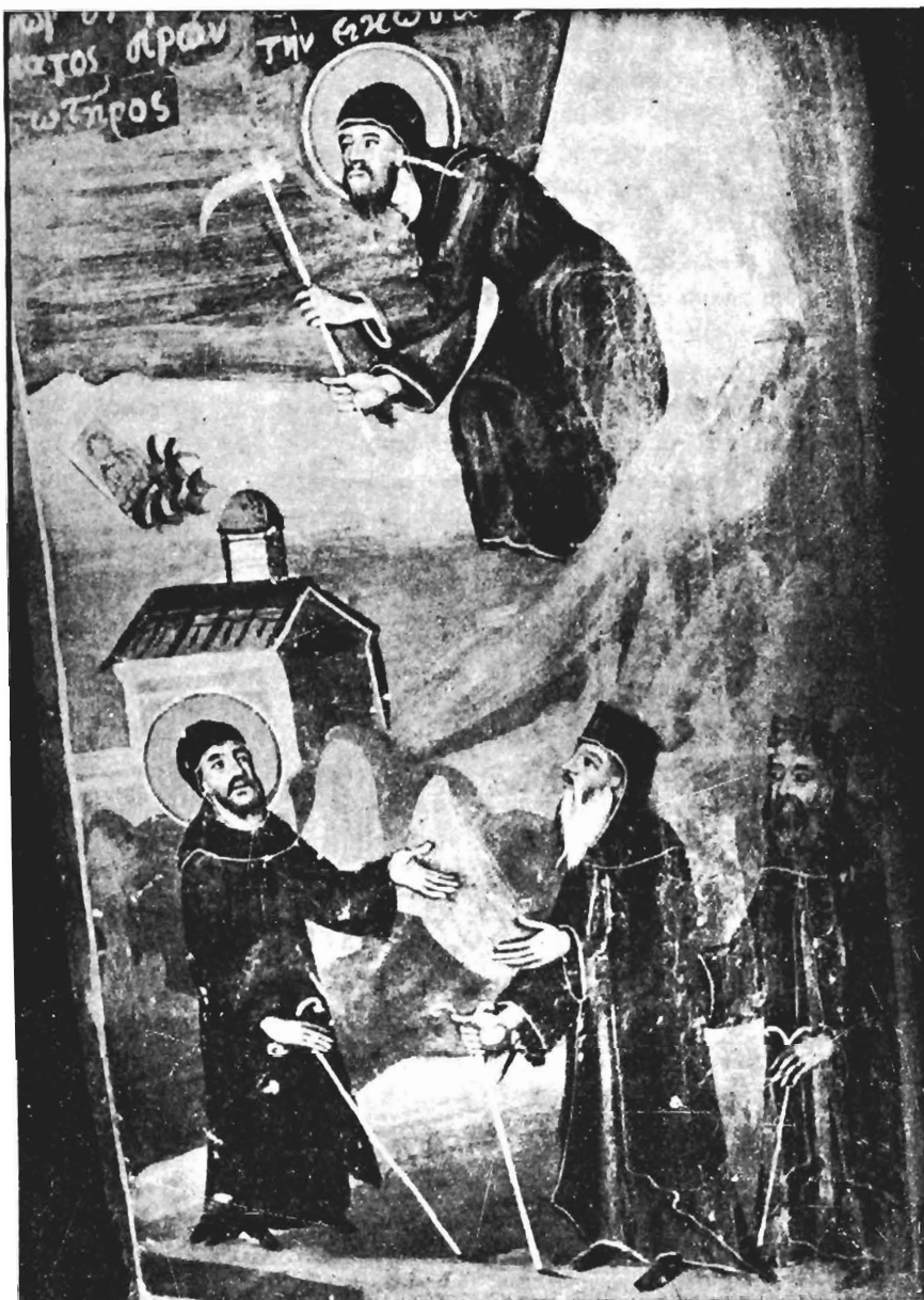
Εἰκ. 3. Ὁ Ὁσιος Νικάνωρ σκάβοντας βρῖσκει τὴν εἰκόνα τοῦ Χριστοῦ. Τοιχογραφία τοῦ ναοῦ τῆς Μεγάλης Παναγίας στὴ Σαμαρίνα.