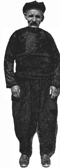
Μπαλαφτσινὸς χω- ρὶς κουπαράν