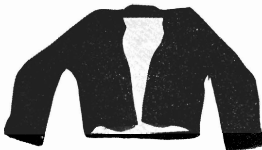
Κουντὸ ἢ λιμπαντές

Τὸ κουντὸ ἢ λιμπαντές φορεῖται πάνω ἀπὸ τὸν ντουλαμά ἢ τὸ γελέκο. Γίνεται ἀπὸ «γρίζο» 3 ὕφασμα, σιαγιάκι. Γίνεται κὶ ἀπὸ τσόχα, ὅταν ἢ ὅλη φορεσιά εἶναι τσόχινη. Τὸ κουντὸ φτάνει ὡς τὴ μέση καὶ σκεπάζει