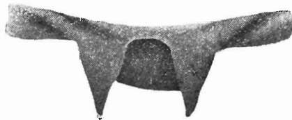
Κουντὸ ἢ λιμπαντές.

Γίνεται ἀπὸ μαῦρο γορζο. Εἶναι ὅπως καὶ τὸ ἀνδρικό, μὲ μανίκια καὶ γαϊτανωμένο. Λιμπαντέ φοροῦσαν στὸ Ζαγόρι 3 τῆς Ἡπείρου καὶ στὸ Πήλιο. 4