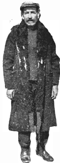
Μπαλαφτσινὸς μὲ κουπαράν