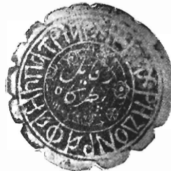
Εἰκ. 3. Σφραγὶς Ἀρχιεπισκόπου Ἀχρίδος Ραφαήλ