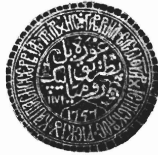
Εικ. 5. Σφραγίς Ἀρχιεπισκόπου Ἰπεκίου Γαβριήλ