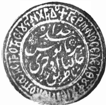
Εἰκ. 2. Σφραγὶς Ἀρχιεπισκόπου Ἀχρίδος Γερμανοῦ