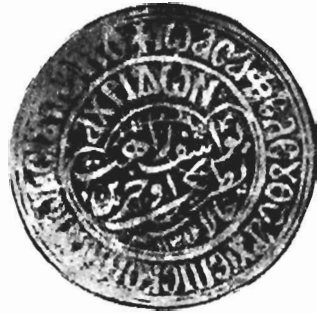
Εικ. 4. Σφραγίς Ἀρχιεπισκόπου Ἀγίδος Ἰωάσαφ