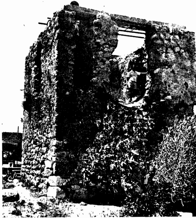
Εικ. 4. Νοτιοανατολική άποψη του πύργου

τος 0.90 μ. και καταλαμβάνει σε μήκος δλόκληρο τὸ ὕψος τοῦ διατηρημένου τμήματος τοῦ πρώτου ὀρόφου (βλ. εικ. 4.).