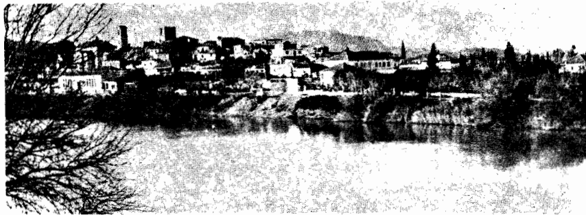
Εἰκ. 1. Βορειοανατολικὴ ἄποψη τῆς Κατοχῆς

Δυτικὰ ἀπὸ τὸ χωριὸ Νιοχώρι τῆς αἰτωλικῆς Παραχελωίτιδας, στὴν προ- έκταση τοῦ δρόμου ποὺ τὸ ἐνώνει μὲ τὸ Αἰτωλικὸ καὶ τὸ Μεσολόγγι, βρί- σκεται ἡ Κατοχή 1 , τὸ πρῶτο ἀκαρνανικὸ χωριὸ ποὺ συναντᾶ ὁ ἐπισκέπτης διαβαίνοντας τὸν ποταμὸ Ἄχελῶ ἀπὸ τὴν Λίτωλία στὴν Ἀκαρνανία. Τὸ ση- μερινὸ χωριὸ εἶναι χτισμένον πάνω σὲ μικρὸ λόφο ποὺ οἱ πρόποδες του ἀγγίζου- ν τὴ δεξιὰ ὄχθη τοῦ Ἄχελῶου 2 . Στὸ σημεῖο αὐτὸ ὁ ποταμὸς στενεύει περισσό- τερο καὶ σχηματίζει κάποιον φυσικὸ πόρο ποὺ διευκολύνει τὴ διάβασή του.