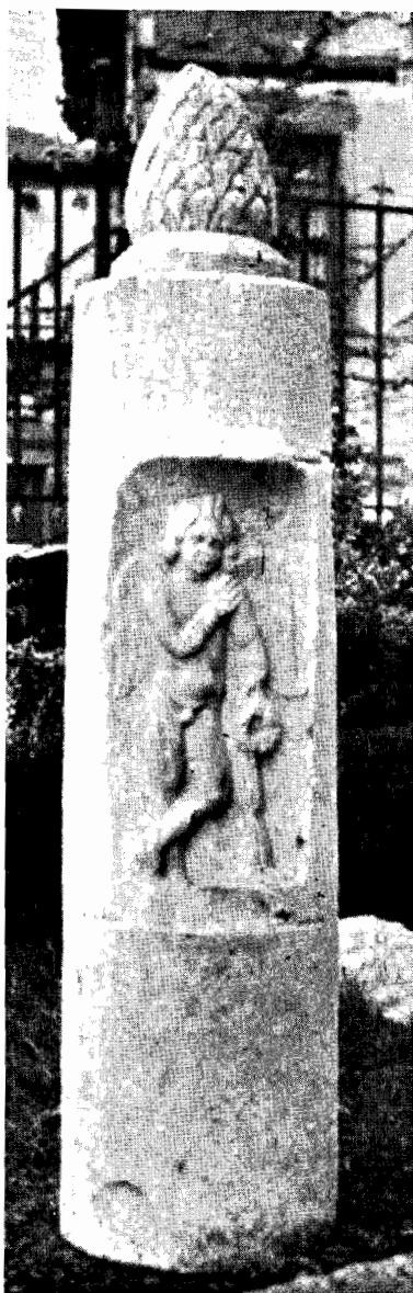
Είκ. 1. Ἐπιτυμβία στήλη ἐκ Θεσσαλονίκης.