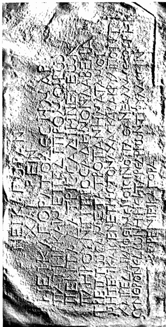
Είκ. 2. Τὸ ἐπίγραμμα τῆς στήλης.