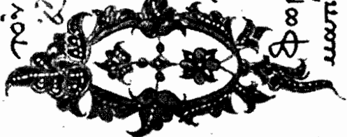
Εικ. 1. Κώδ. Καραγάλλου 250 (Α. 1763).

Ησ παρθεσίας ἀρεάμ τον οίβου, κρηφου Πόνυ δκρας καια βτημήβωπλίου· Σί δώαμς καιηδδξα Ξπες, Στουύον, Σ τονονον πης· κίν ζω, ἀπιφώμου, Γ· τρισκομας τωτ και Γυφώμου λιμψχρισάμερ περσάχας· ΟΣ δνοκαι ρισι Γυ Φωμοισιμωη Ξόμο λον, Ξς αττισει Γ ματια, Ξς αττισει Γ