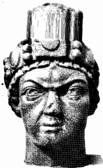
Κεφαλή Καομανιόλα (Fuchs, Langobard. Goldblattkr. eiz. 18)