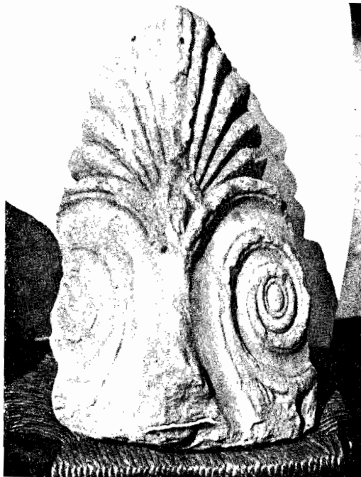
α. Τὸ γωνιακὸ ἀκρομήριον τοῦ πίνακος I. (Καὶ οἱ δύο ἄψεις του)