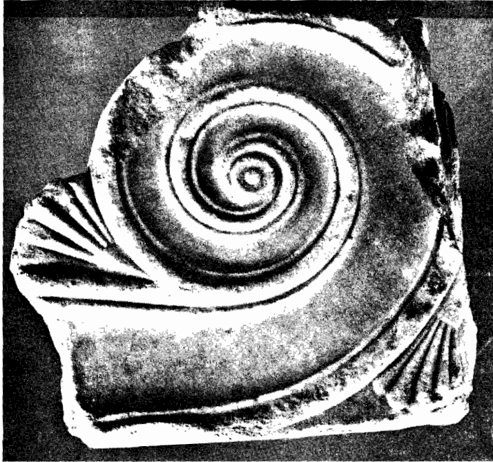
α. Ἡ ἄλλη πλάγια ὄψη τοῦ ἀκροτηρίου πίν. 2 β. (Φωτογραφία ΡΜ. ἀριθ. 6829)