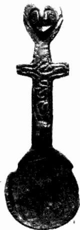
Κοχλιάριον Κορίνθου ἀριθ. 1509 (10)