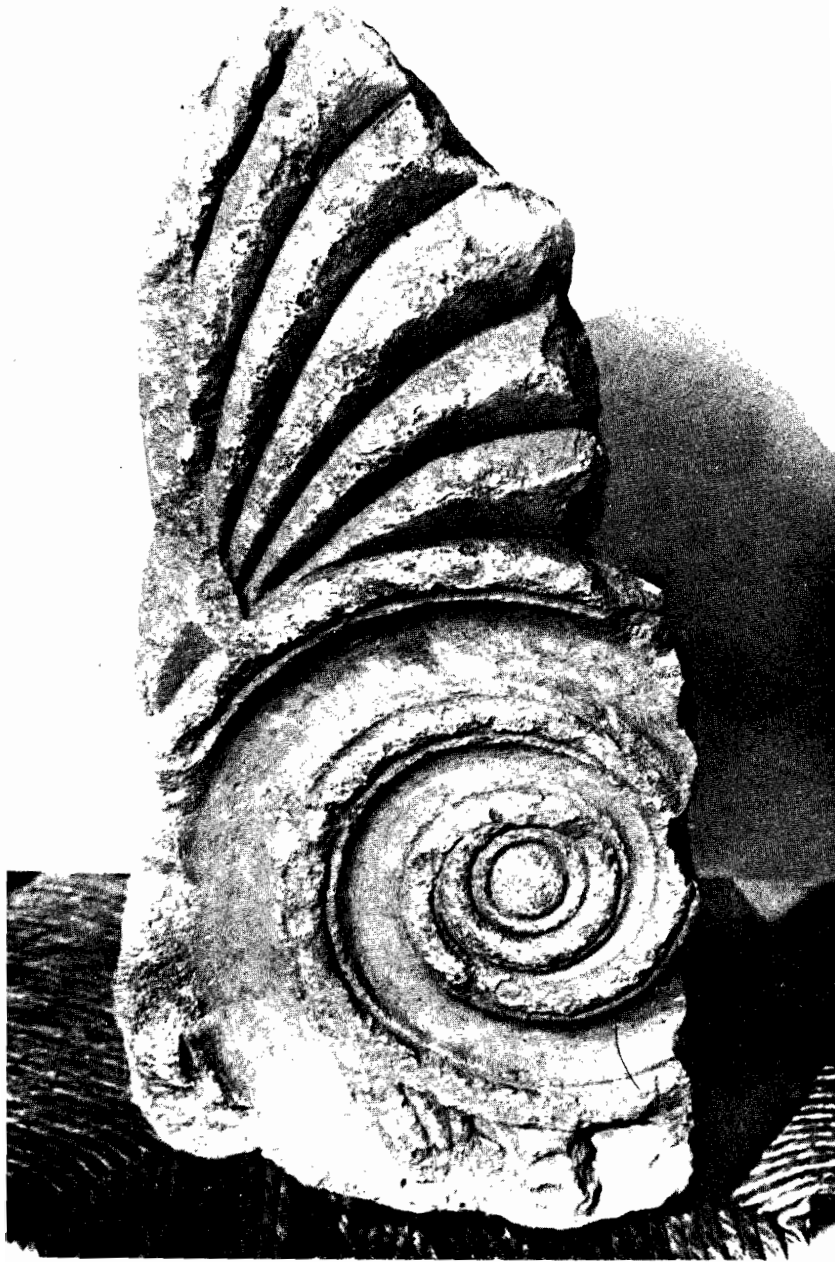
Γουιακό ἀροστήριο ἀπὸ τῆ Μαρόνεια. (Πλάγια ὄψη)