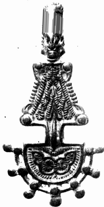
Περόνη ἐκ τῆς Νέας Ἀγχιάλου