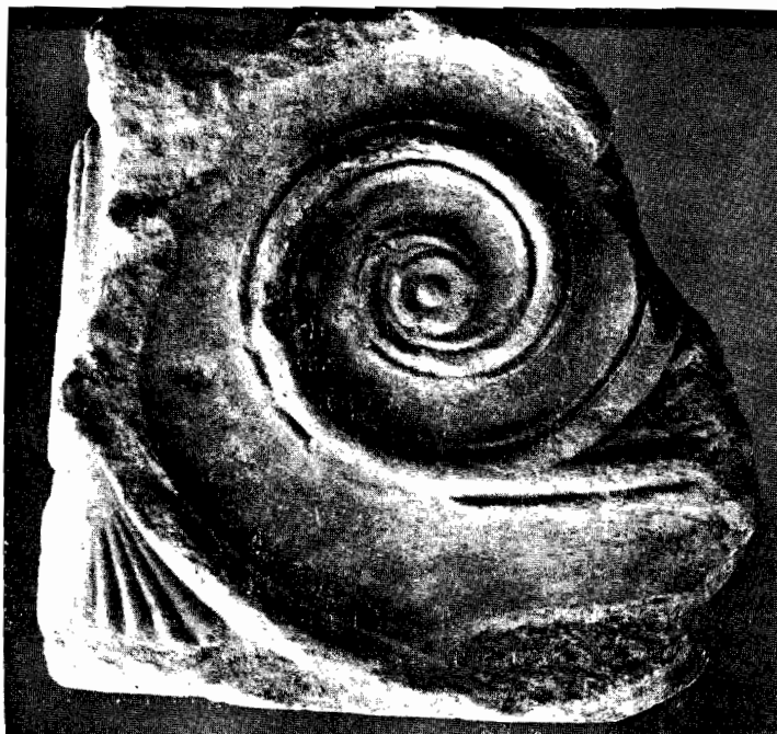
β. Γωνιακὸ ἀκρομήριον στὸ Μουσεῖο τοῦ Βερολίνου. (Φωτογραφία τοῦ ΡΜ. ἀριθ. 6830)