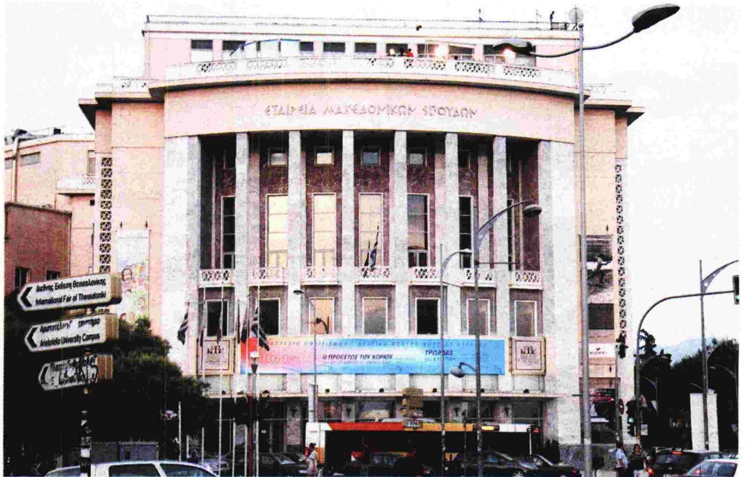
Το θέατρο της Εταιρείας Μακεδονικών Σπουδών είναι ένα από τα ακίνητα που ανήκουν στο κοινωφελές σωματείο.

Άλλη μία δράση της Εταιρείας Μακεδονικών Σπουδών στο πλαίσιο του εορτασμού για την επέτειο των 100 χρόνων από την απελευθέρωση της Θεσσαλονίκης είναι η έκθεση «Οι Βαλκανικοί Πόλεμοι βήμα-βήμα σε εικόνες», της οποίας ο σχεδιασμός μόλις ολοκληρώθηκε. Η έκθεση περιλαμβάνει 360 φωτογραφίες, λιθογραφίες, ζωγραφικούς πίνακες, ιστορικά πρωτοσέλιδα εφημερίδων και βιβλία της εποχής εκείνης. «Πολλά από αυτά πα-