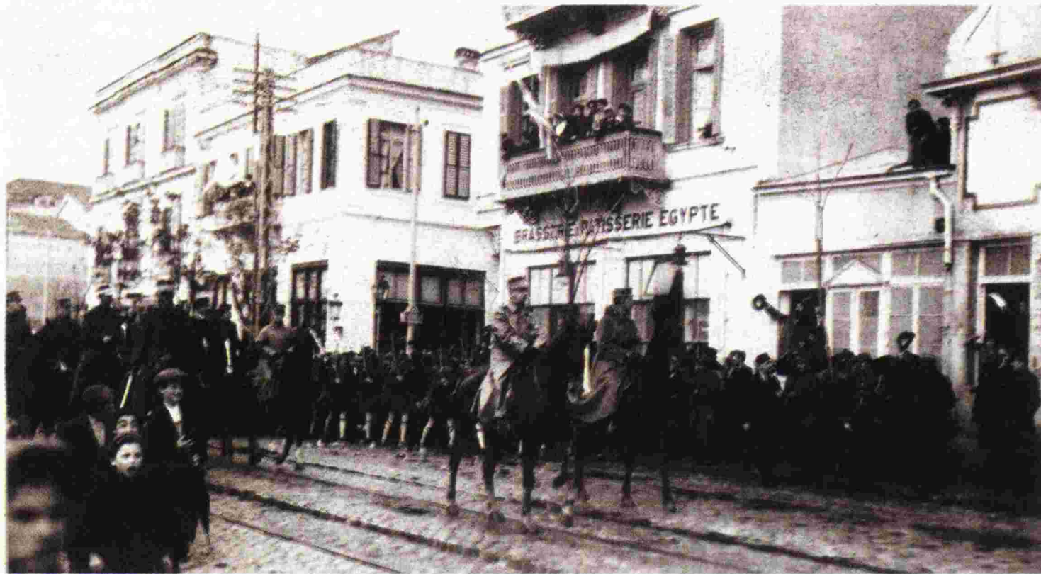
Φωτογραφίες της έκθεσης «Οι Βαλκανικοί Πόλεμοι βήμα-βήμα σε εικόνες».