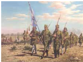
Θεοία Σιμιτλήτικη Εξόρμησις προς Σιμιτλή

Στον αμέσως επόμενο Β΄ Βαλκανικό Πόλεμο, από 16 Ιουνίου μέχρι 17 Ιουλίου 1913, μέσα σε ένα μόνον μήνα ο Ελληνικός Στρατός απελευθέρωσε την υπόλοιπη Κεντρική Μακεδονία, όλη την Ανατολική Μακεδονία, την Ξάνθη και την Αλεξανδρούπολη. Κινούμενος ακάθεκτος προς Βορράν διέσπασε τα Στενά του ιστορικού Κλειδίου, εξεπόρθησε τα αδιάβατα Στενά της Κρέσνας, εισήλθε στην πεδιάδα της Σόφιας και έδωσε την τελευταία νικηφόρα μάχη του στο Σιμιτλή.