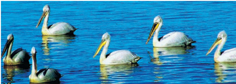
Πρέσπες: Οι πελεκάνοι

θνές σημείο ανάμεσα στα τρία κράτη. (Η ευθεία προέκταση του συνόρου συμπίπτει με το γεωγραφικό παράλληλο 40° 51'20'')». 28