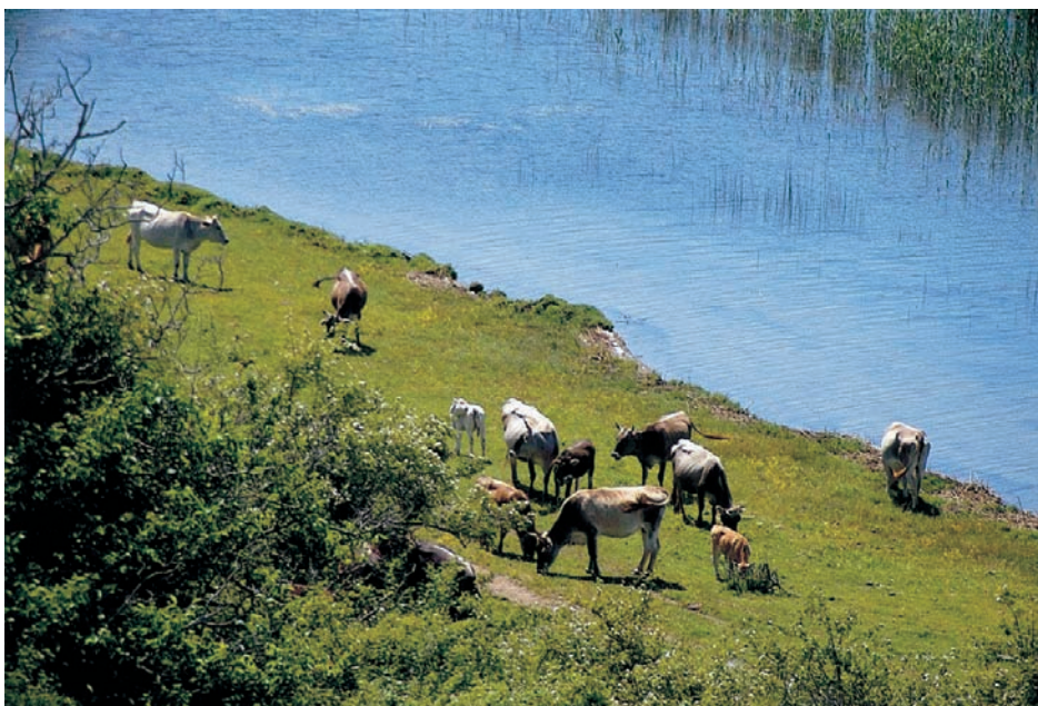
Ψαράδες Πρεσπών: Οι μικρόσωμες αγελάδες