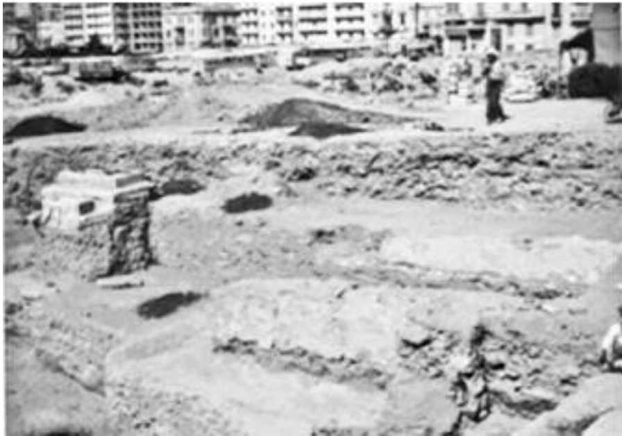
Εικ. 3 . Θεσσαλονίκη 1963. Ανασκαφή στην πλατεία Δικαστηρίων. Αρχικές φάσεις.