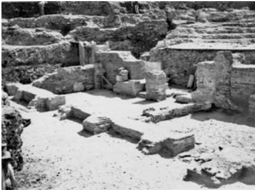
Εικ. 10. Θεσσαλονίκη 1963. Ανασκαφή στην πλατεία Δικαστηρίων. Ωδείο . γ-δ : μερικές απόψεις της στοάς με τη διπλή κιονοστοιχία.