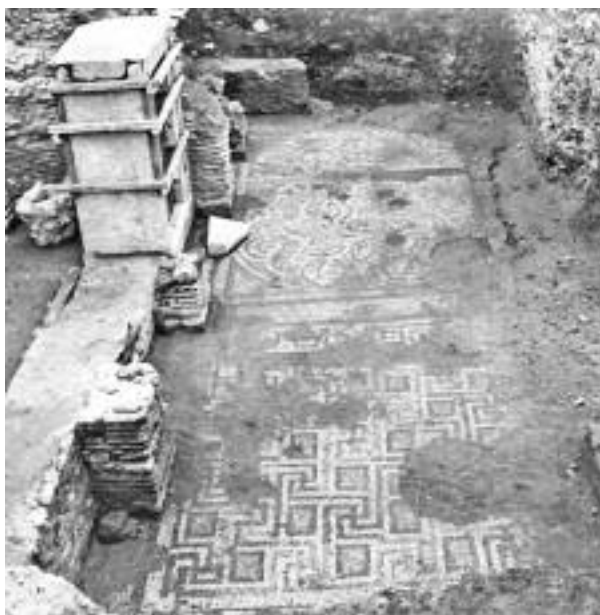
Εικ. 11-12 . Θεσσαλονίκη 1963. Ανασκαφή πλατείας Δικαστηρίων. Ωδείο. Πύλη και ψηφιδωτό δάπεδο.