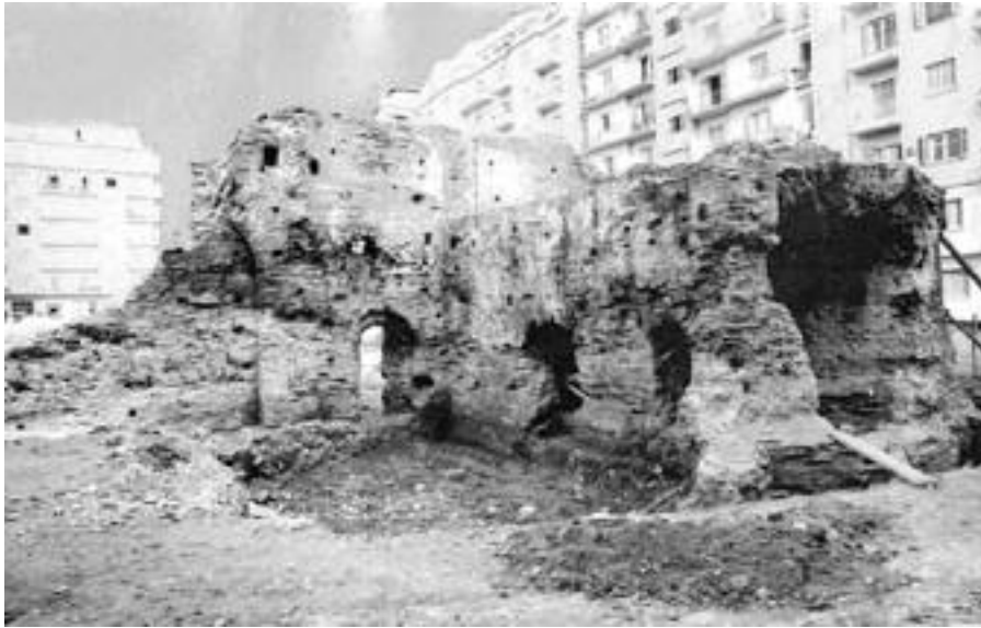
Εικ. 2. Θεσσαλονίκη 1963. Ανασκαφή πλατείας Ναυαρίνου.