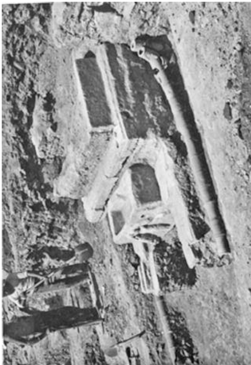
Εικ. 4. Θεσσαλονίκη 1963. Ανασκαφή στην πλατεία Δικαστηρίων. Τουρκική κρήνη με μικρή μαρμάρινη ρωμαϊκή σαρκοφάγο σε δεύτερη χρήση.