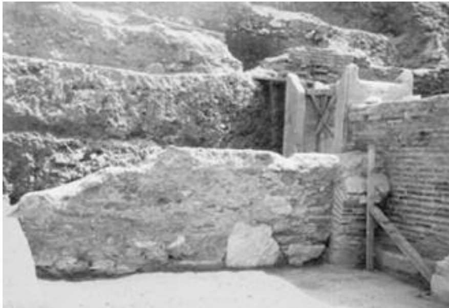
Εικ. 7. Θεσσαλονίκη 1963. Ανασκαφή στην πλατεία Δικαστηρίων. Μερικές απόψεις του Ωδείου.