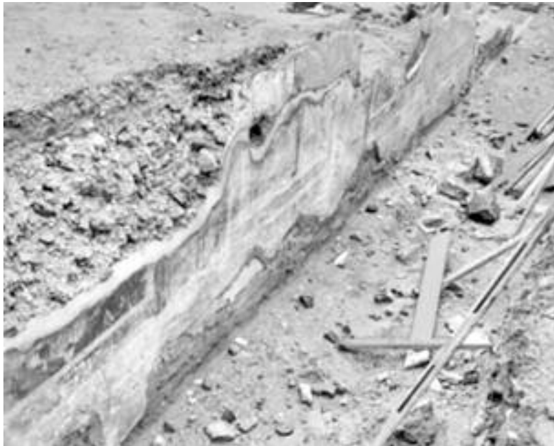
Εικ. 2 γ.