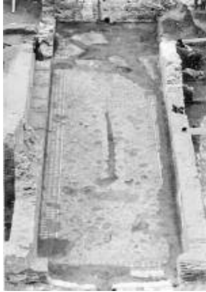
Εικ. 2 β.