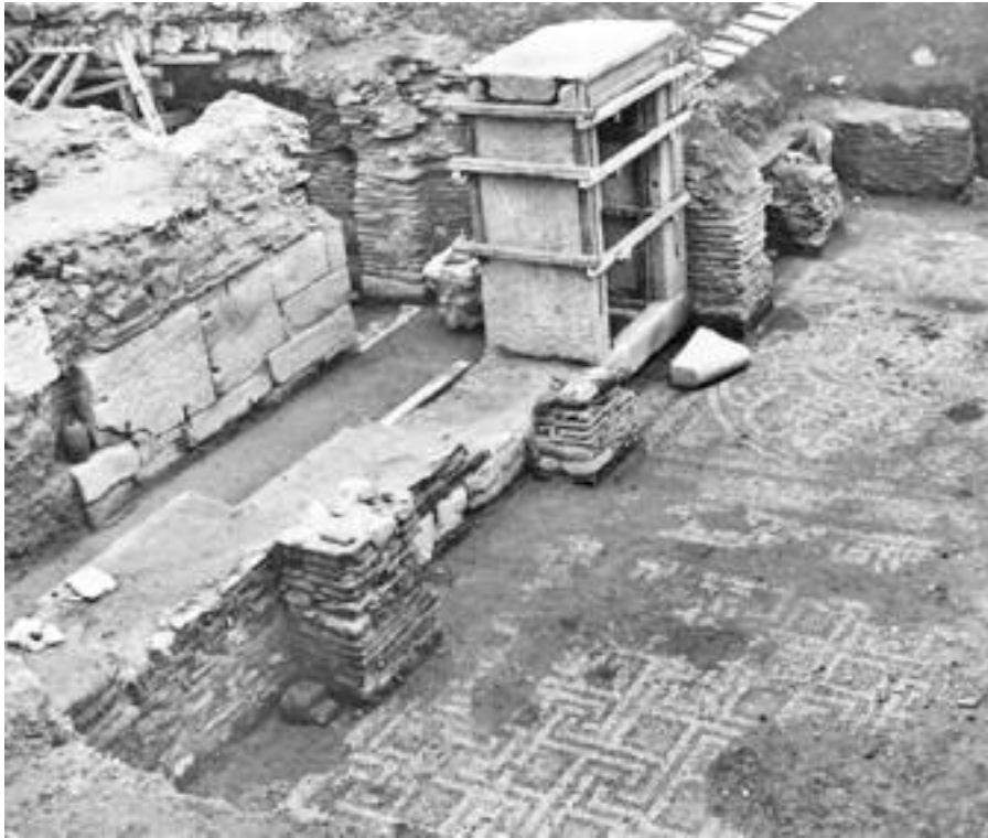
Εικ. 12 . Θεσσαλονίκη 1963. Ανασκαφή πλατείας Δικαστηρίων. Ωδείο. Πύλη και ψηφιδωτό δάπεδο.