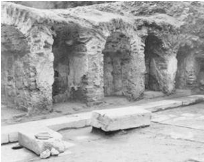
Εικ. 9. Θεσσαλονίκη 1963. Ανασκαφή στην πλατεία Δικαστηρίων. Ωδείο, οι κόγχες του προσκηπίου .