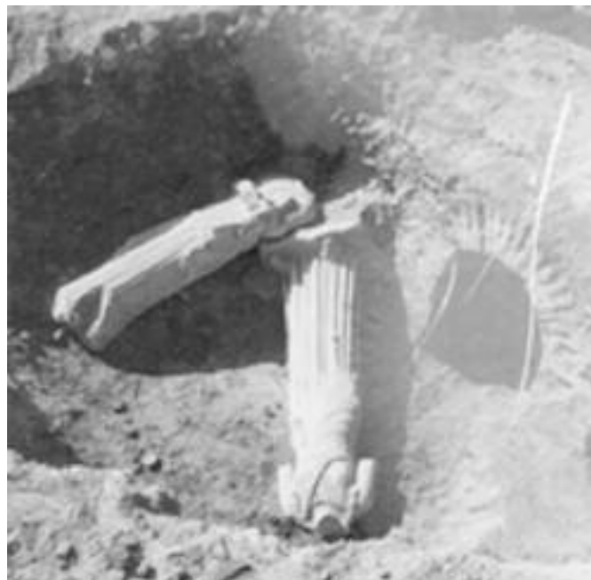
Εικ. 8. Θεσσαλονίκη 1963. Ανασκαφή στην πλατεία Δικαστηρίων. Τα αγάλματα των Μουσών όπως βρέθηκαν εμπρός από τις κόγχες του προσκηνίου του Ωδείου