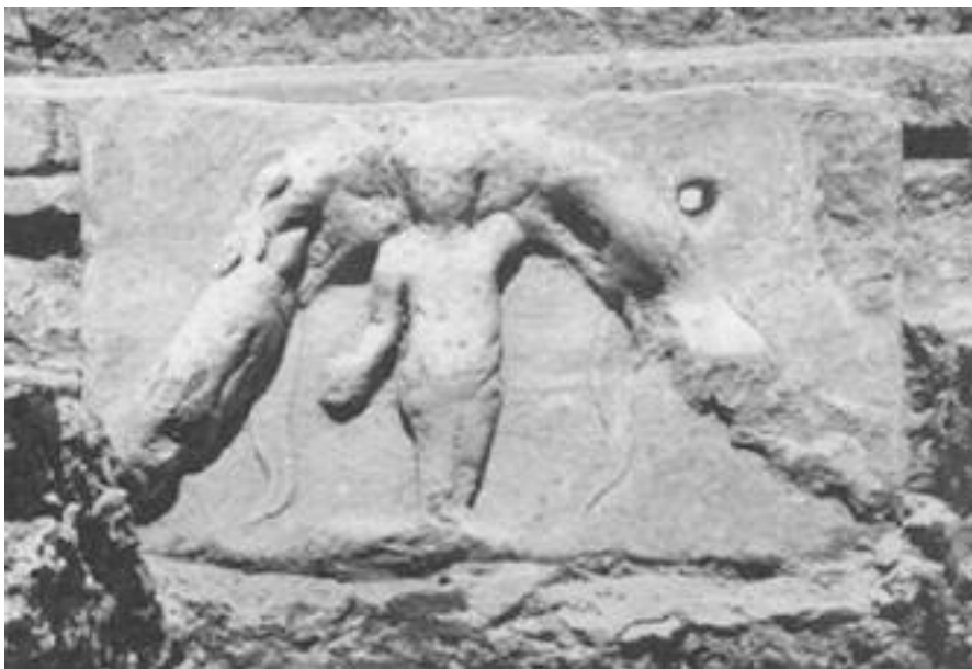
Εικ. 10. Θεσσαλονίκη 1963. Ανασκαφή στην πλατεία Δικαστηρίων. Ωδείο . α - β : τμήματα από αρχιτεκτονικά μέλη