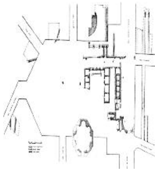
Εικ. 2 α. Κάτοψη β. Ψηφιδωτό δάπεδο γ. Τοίχοι με κονιάματα