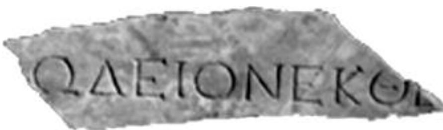
Εικ. 6. Θεσσαλονίκη 1963. Ανασκαφή στην πλατεία Δικαστηρίων. Μερική άποψη του Ωδείου και η επιγραφή του.