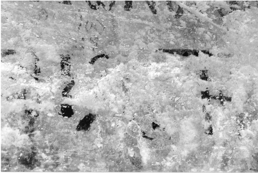
Εικ. 3. Σέρβια Κοζάνης. Ναός Αγίων Αναργύρων, κτητορική επιγραφή (λεπτομέρεια).