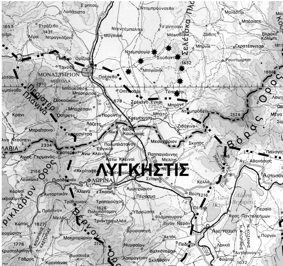
ΧΑΡΤΗΣ 4: ΚΑΙΜΑΚΑ 1 : 500.000