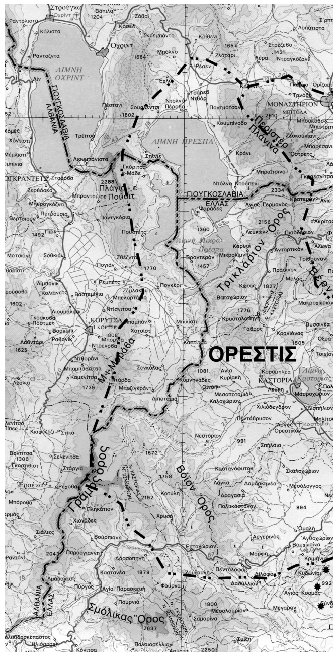
ΧΑΡΤΗΣ 3: ΚΑΙΜΑΚΑ 1 : 500.000