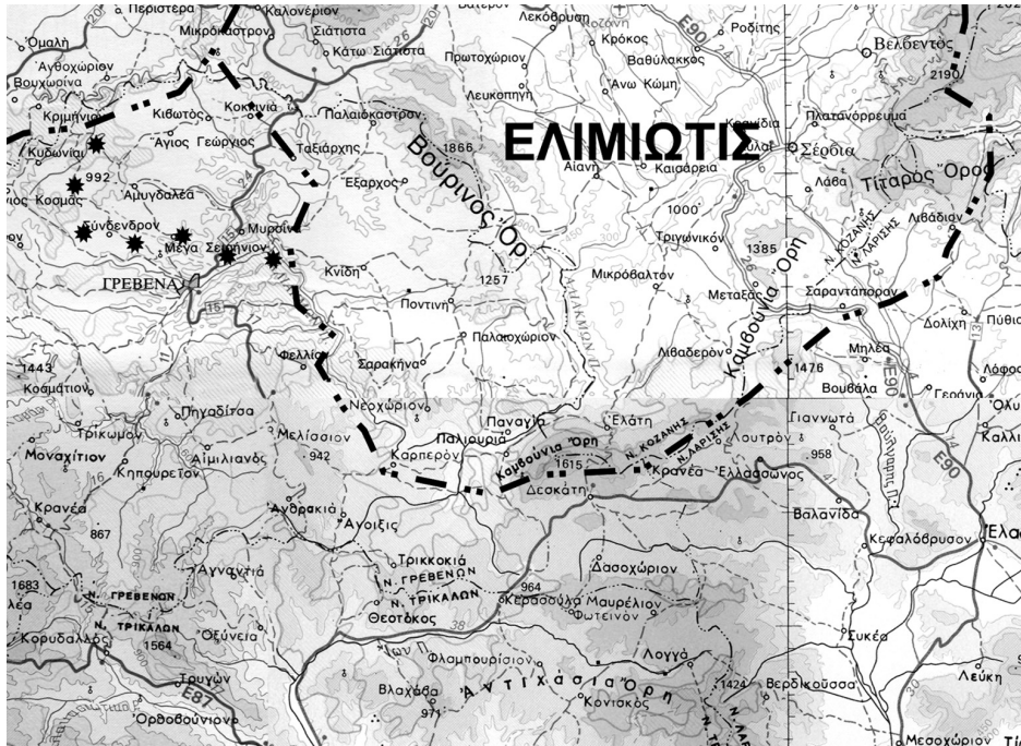
ΧΑΡΤΗΣ 2: ΚΑΙΜΑΚΑ 1 : 500.000