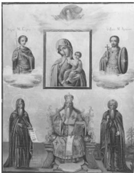
Εικ. 19. Μονή Βατοπαιδίου. Παρεκκλήσιο Αγίου Παντελεήμονα. Αντίγραφο της Παναγίας Παραμυθίας. Δεύτερο μισό 19ου αι.