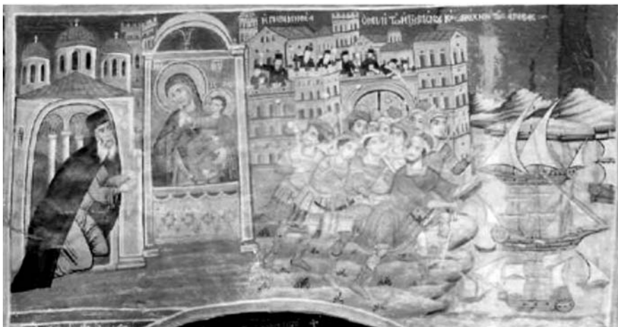
Εικ. 14. Μονή Βατοπαιδίου. Παρεκκλήσι Αγίου Δημητρίου. Αντίγραφο της Παναγίας Παραμυθίας, 1791.