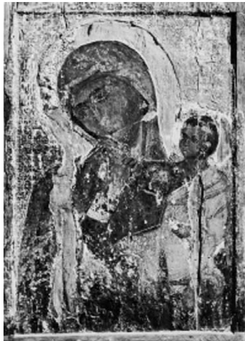
Εικ. 21. Κύπρος, ναός Παναγίας Χρυσαινιώτισσας. 13ος αι.