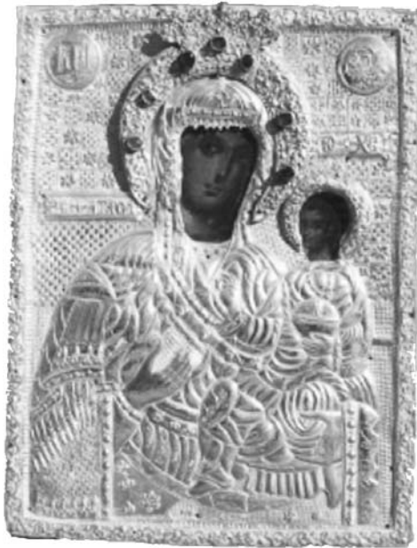
Εικ. 7. Μονή Βατοπαιδίου. Αντίγραφο της Παναγίας Βηματάρισσας. 18ος αι.