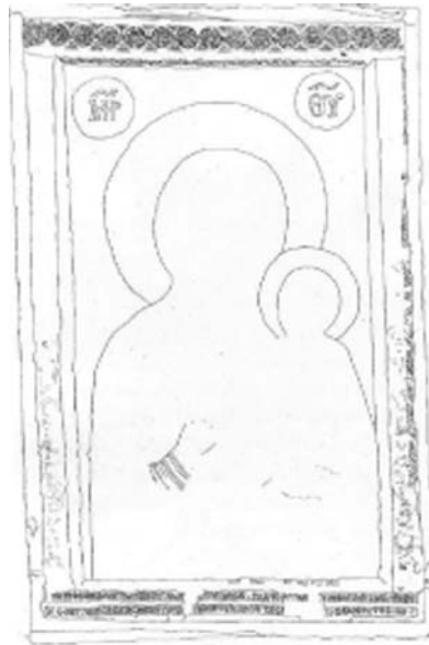
Εικ. 3. Σχεδιαστική απόδοση της Παναγίας Βηματάρισσας και της επενδύσεως του δεύτερου μισού του 12ου αι.