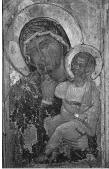
Εικ. 22. Κύπρος, Μονή του Αγίου Ιωάννη του Χρυσσοστόμου του Κουτζοβέντη. 14ος αι.