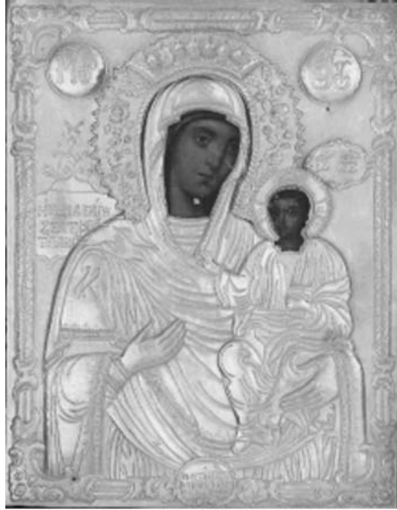
Εικ. 8. Μονή Βατοπαιδίου. Αντίγραφο Παναγίας Βηματάρισσας. 1812.