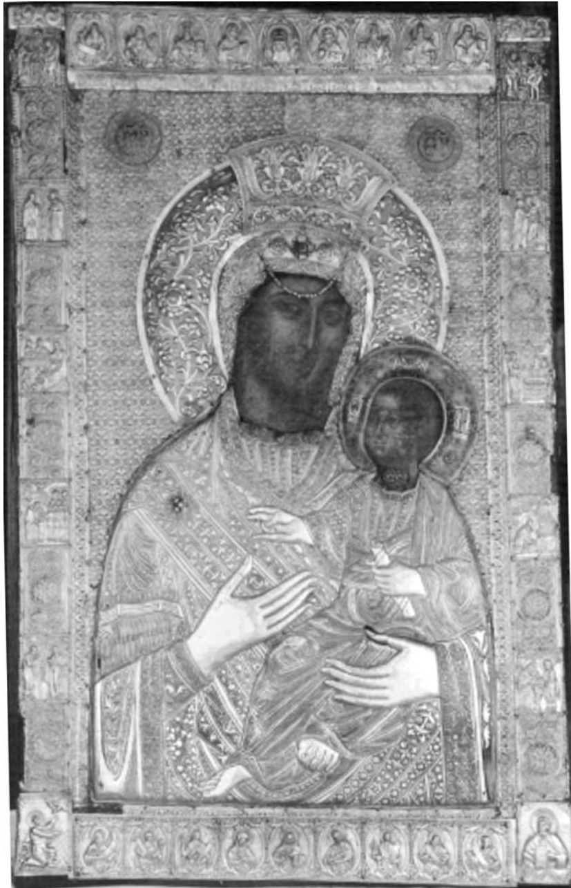
Εικ. 1. Μονή Βατοπαιδίου, η Παναγία Βηματάρισα ή Κτητόρισα.