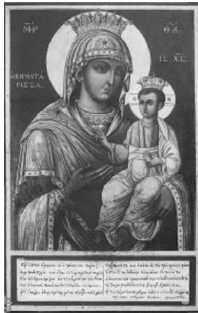
Εικ. 10. Μονή Βατοπαιδίου. Παρεκκλήσιο Αγίου Δημητρίου. Αντίγραφο της Παναγίας Βηματάρισσας. 1856.