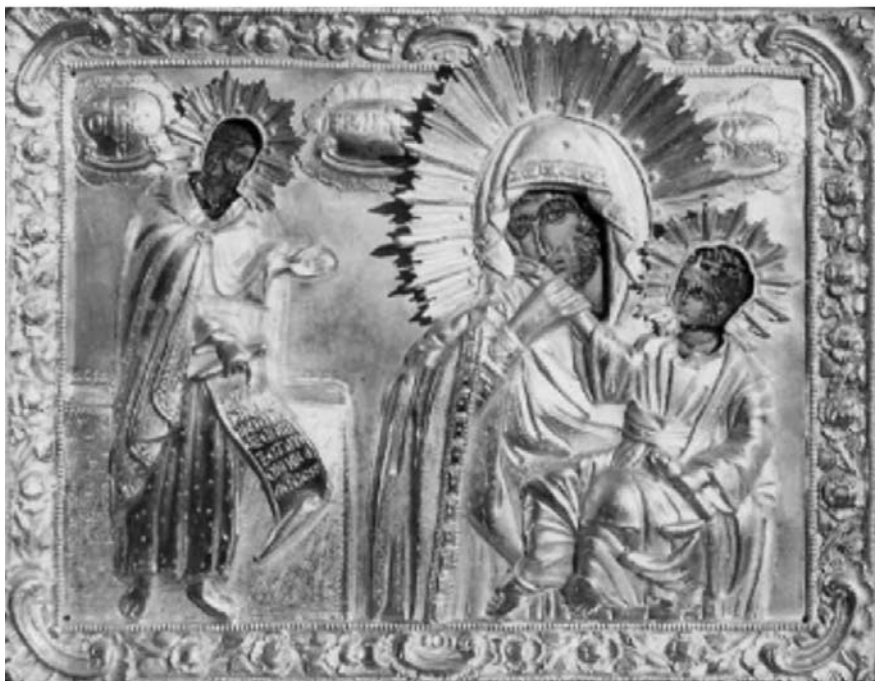
Εικ. 15. Μονή Βατοπαιδίου. Αντίγραφο της Παναγίας Παραμυθίας. 17ος αι.