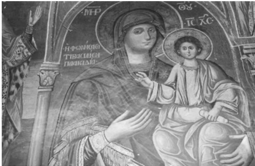
Εικ. 27. Μονή Βατοπαιδίου. Αντίγραφο της Παναγίας Αντιφωνήτριας. 19ος αι.