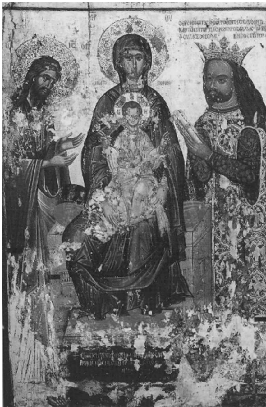
Εικ. 12. FYROM, Μοναστήρι (Bitola), ναός Αγίου Δημητρίου. Η Παναγία «Βατοπεδινή». 1502.