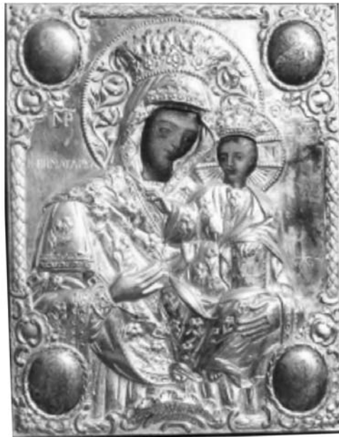
Εικ. 9. Μονή Βατοπαιδίου. Αντίγραφο της Παναγίας Βηματάρισσας. 1835.