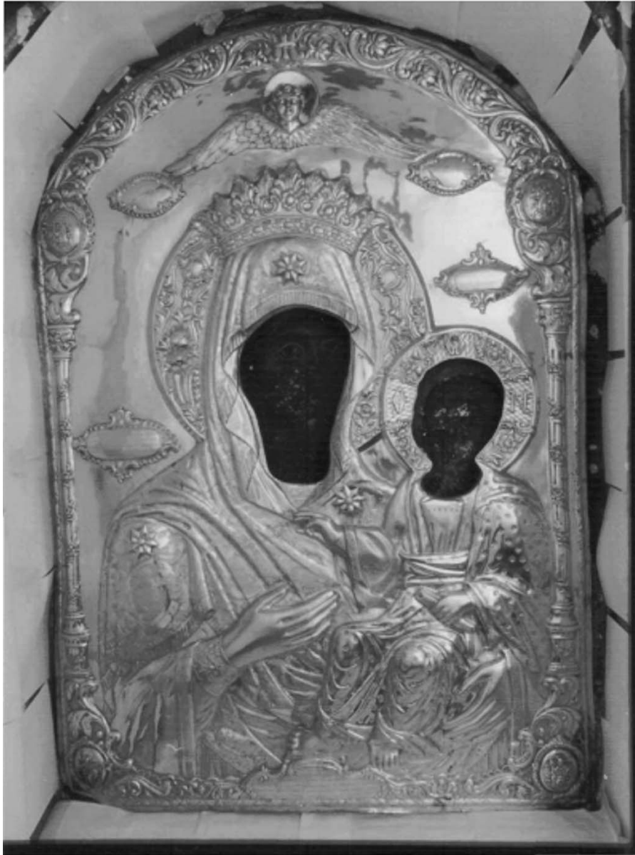
Εικ. 24. Μονή Βατοπαιδίου, η Παναγία η Αντιφωνήτρια.