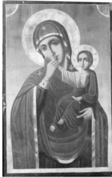
Εικ. 17. Μονή Βατοπαιδίου. Αντίγραφο της Παναγίας Παραμυθίας. Δεύτερο μισό 19ου αι.