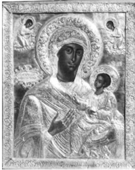
Εικ. 6. Μονή Βατοπαιδίου. Αντίγραφο της Παναγίας Βηματάρισσας. 1781.