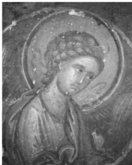
Εικ. 26. Μονή Βατοπαιδίου, η Παναγία η Αντιφωνήτρια. Λεπτομέρεια, ο άγγελος.