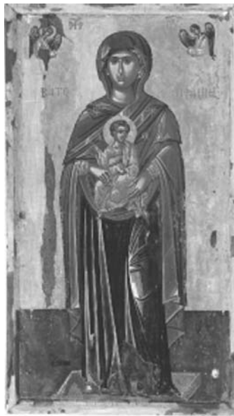
Εικ. 11. Πρωτάτο. Παναγία η Βατοπεδινή. Δεύτερο μισό 16ου αι.