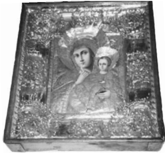
Εικ. 20. Βουλγαρία. Σόφια, ναός Αγίας Σοφίας. Η Παναγία Παραμυθία. 19ος-20ός αι.