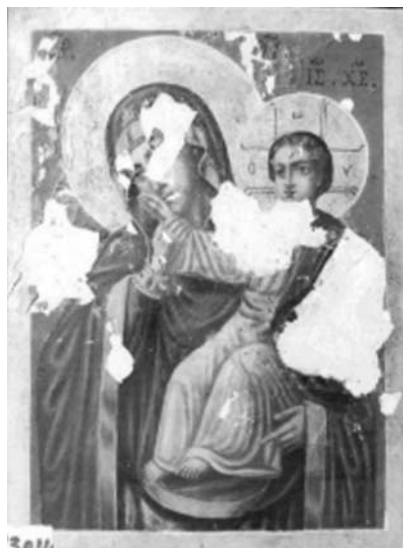
Εικ. 18. Μονή Βατοπαιδίου. Αντίγραφο της Παναγίας Παραμυθίας. Δεύτερο μισό 19ου αι.