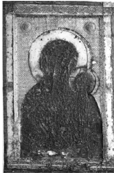
Εικ. 2. Η Παναγία Βηματάρισσα με την επένδυση του 12ου και του 16ου αι.