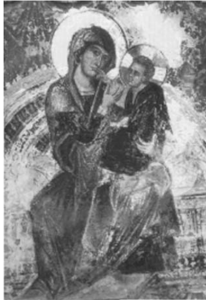
Εικ. 23. Κρήτη, Μονή Οδηγήτριας του Καινουργίου. Αρχές 14ου αι.