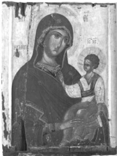
Εικ. 4. Μονή Βατοπαιδίου. Αντίγραφο της Παναγίας Βηματάρισσας. Τρίτο τέταρτο του 14ου αι.