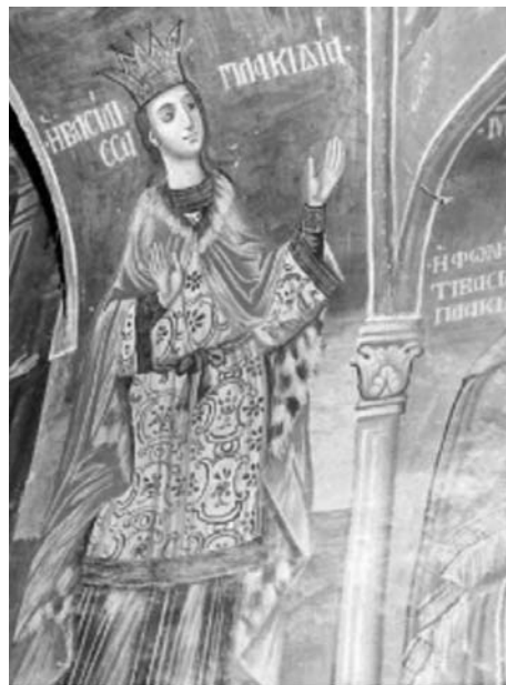
Εικ. 28. Μονή Βατοπαιδίου. Αντίγραφο της Παναγίας Αντιφωνήτριας. Λεπτομέρεια, η βασίλισσα Πλακιδιά. 19ος αι.