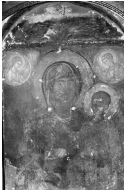
Εικ. 25. Μονή Βατοπαιδίου, η Παναγία η Αντιφωνήτρια χωρίς επένδυση.