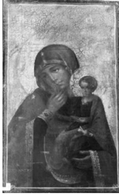
Εικ. 16. Μονή Βατοπαιδίου. Αντίγραφο της Παναγίας Παραμυθίας. 19ος αι.