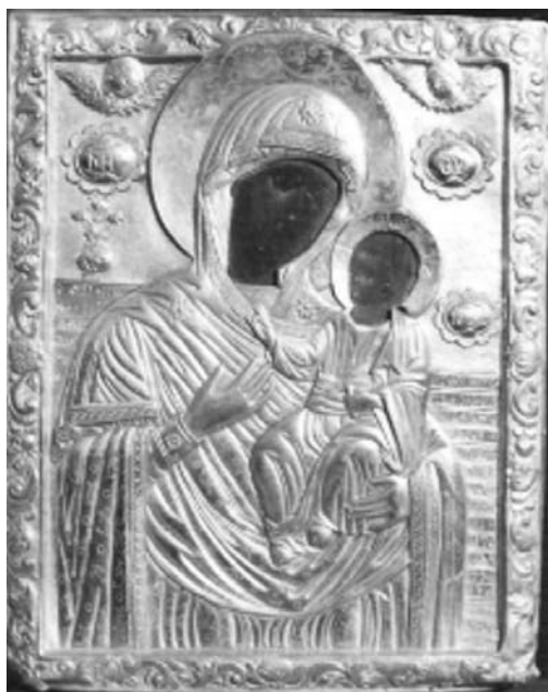
Εικ. 5. Μονή Βατοπαιδίου. Αντίγραφο της Παναγίας Βηματάρισσας. 1772.