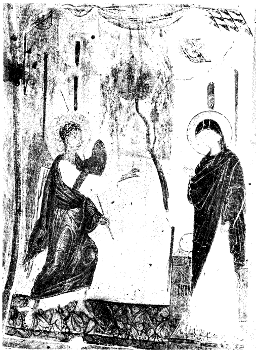
Ειζ. 3. Ο Ευαγγελισμός.