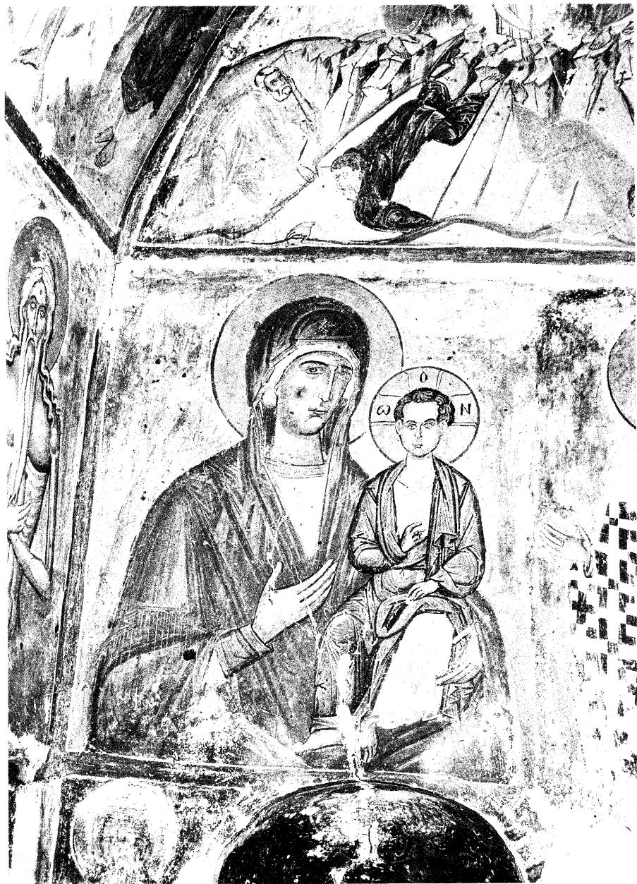
Ειζ. 9. Η Παναγία Οδηγήτρια.