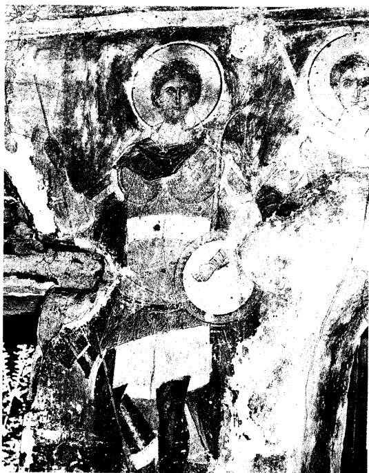
Ειχ. 14. Ο άγιος Γεώργιος και ο άγιος Δημητριος.