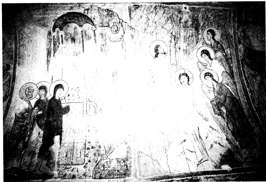
Ειχ. 5. Η Υπαπαντή και η Βάπτιση.