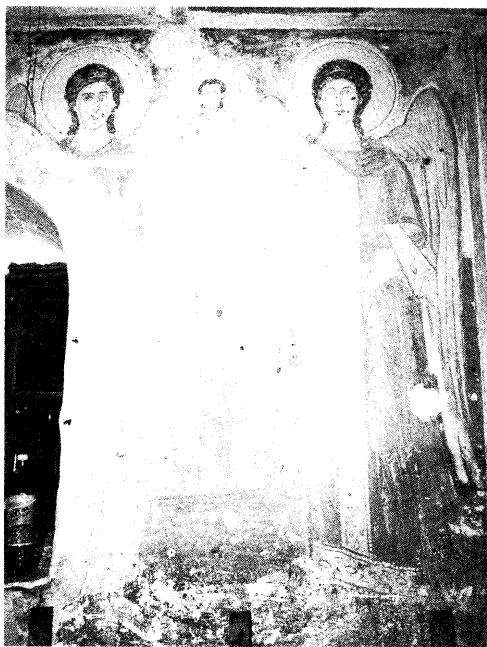
Ειζ. 7. Η Συναξίη των Αρχαγγέλων.