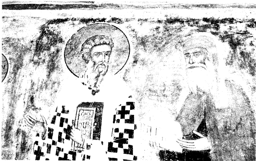
Ειχ. 10. Ο άγιος Βλάσιος και ο ζητήτωρ μοναχός.