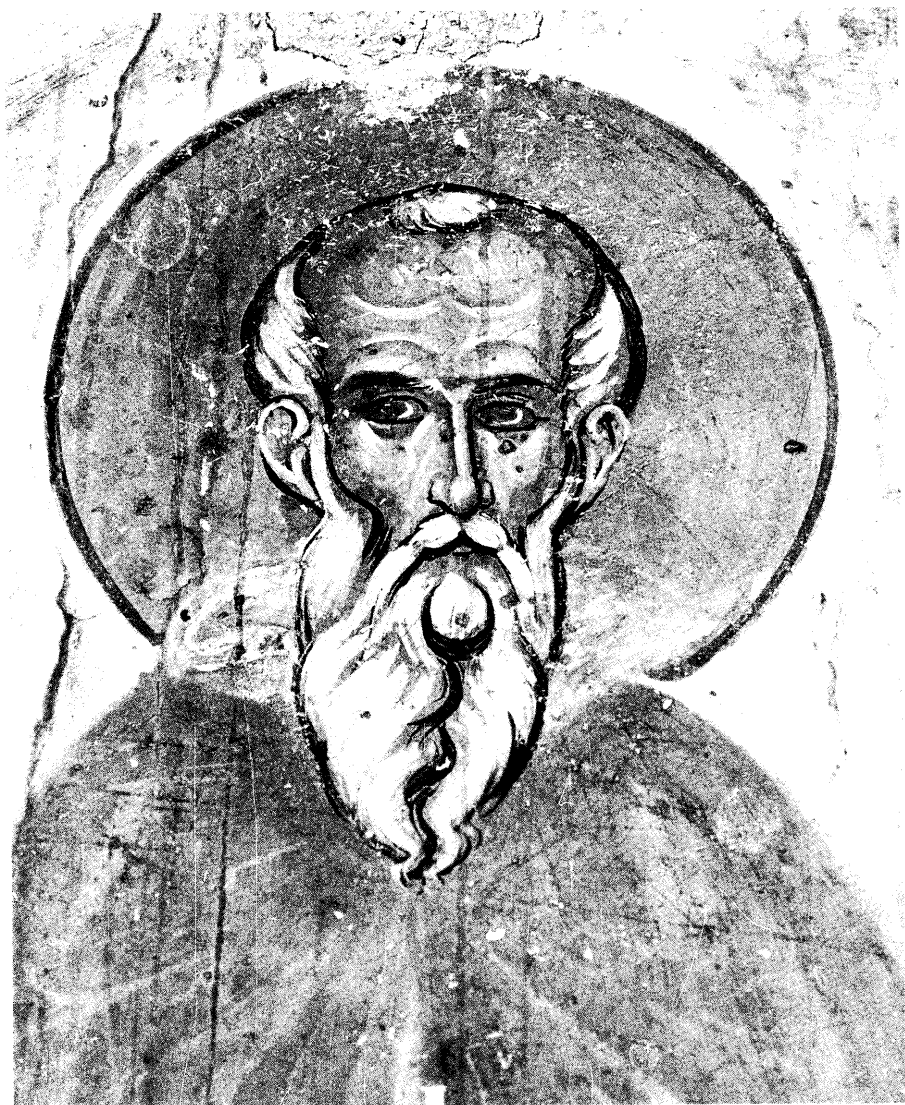
Ειχ. 18. Ο άγιος Αθανάσιος ο Αθωνίτης (λεπτομέρεια).