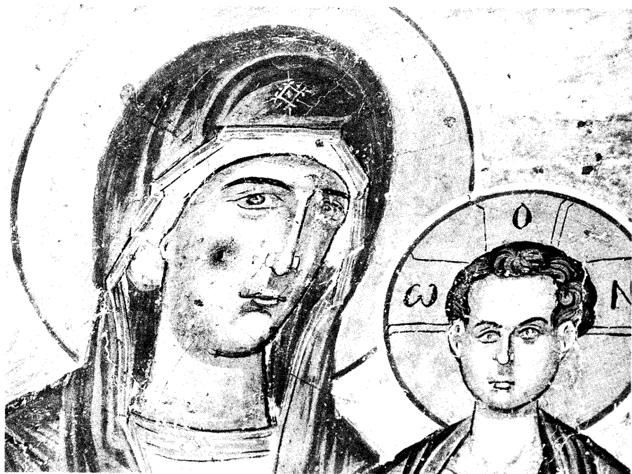
Ειχ. 11. Η Παναγία Οδηγήτρια (λεπτομέρεια).