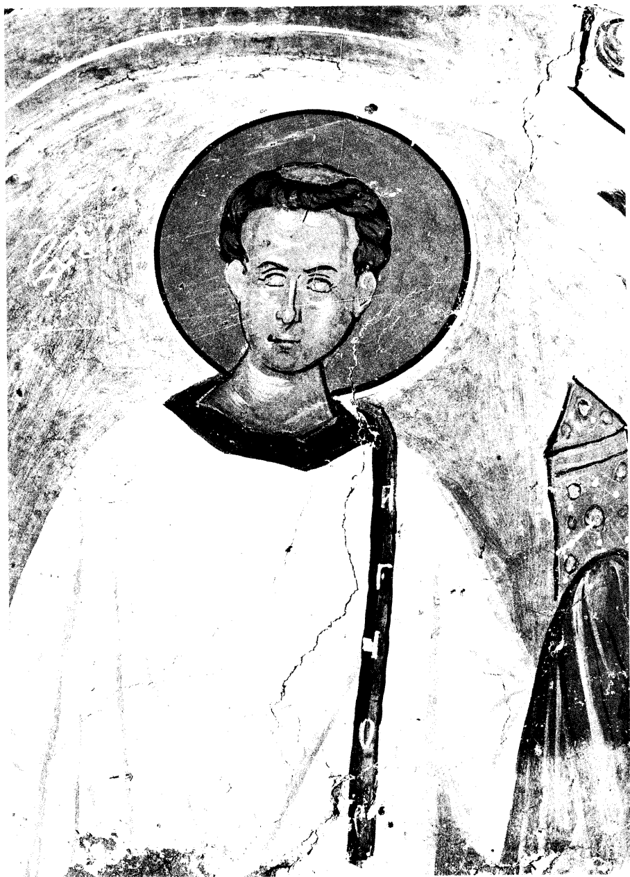
Εικ. 20. Ο άγιος Λαυρέντιος.