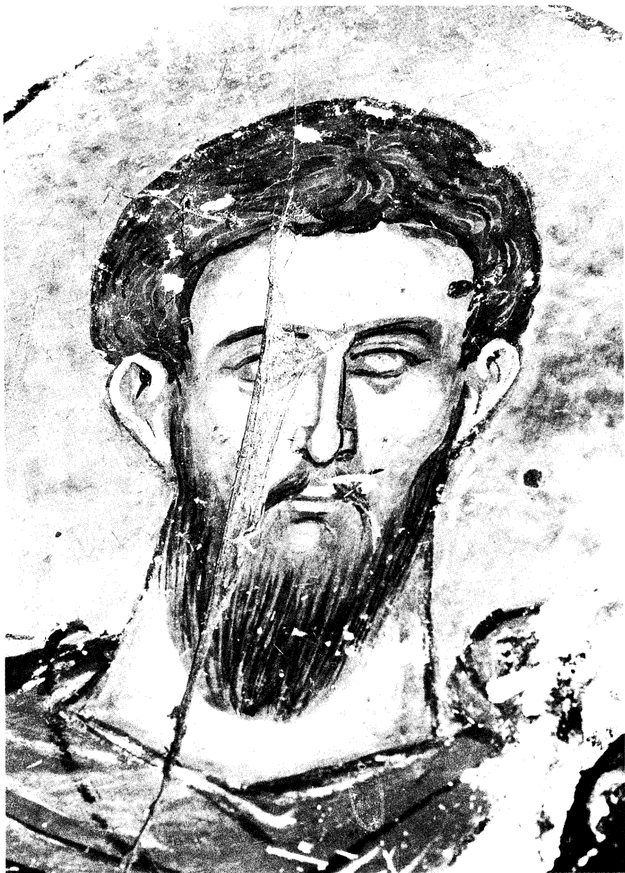
Εικ. 15. Ο άγιος Θεόδωρος ο στρατηλάτης (λεπτομέρεια).