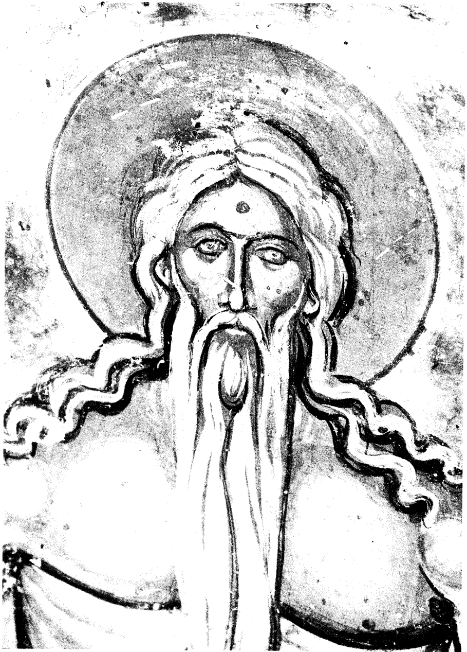
Ειχ. 19. Ο άγιος Ονούφριος (λεπτομέρεια).