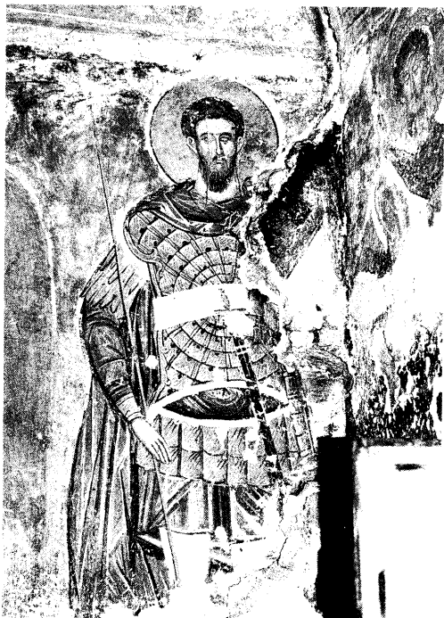
Ειχ. 13. Ο άγιος Θεόδοσος ο Στρατηλάτης.