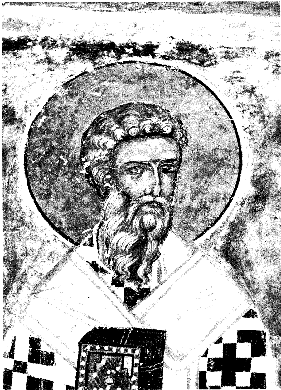
Ειχ. 12. Ο άγιος Βλάσιος (λεπτομέρεια).