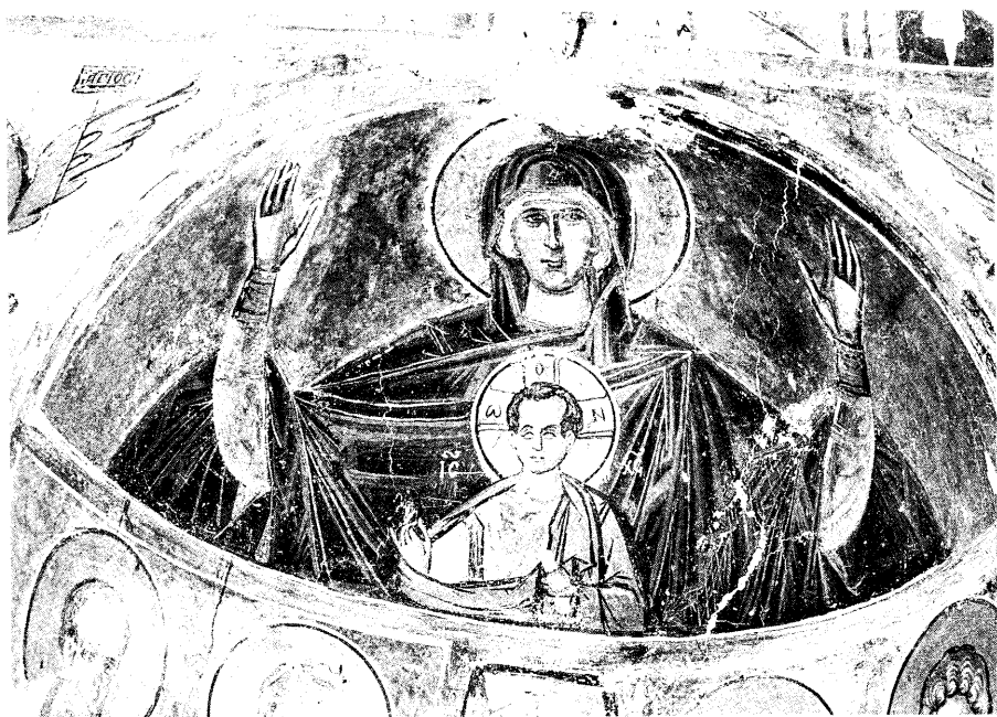
Ειζ. 2. Η Παναγία δεομένη με τον Χριστό στην αψίδα του ναού.