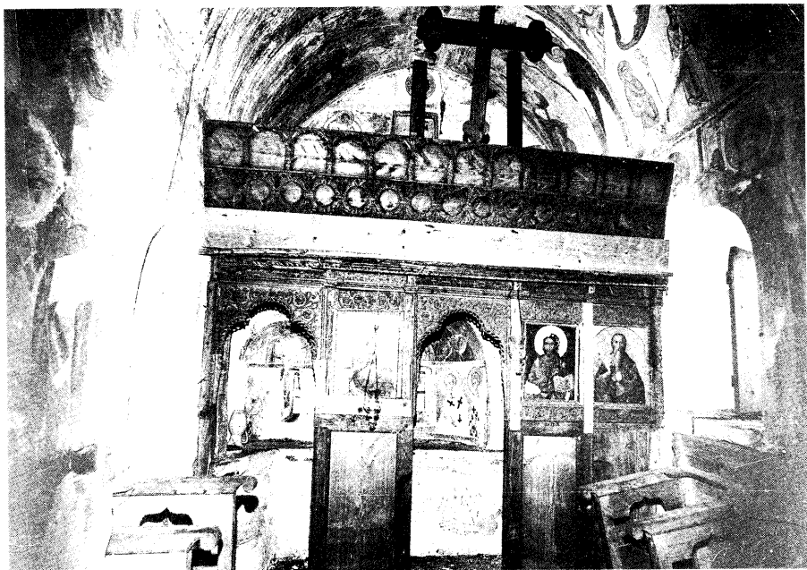
Ειζ. 1. Γενική άποψη του ναού από δυτικά.