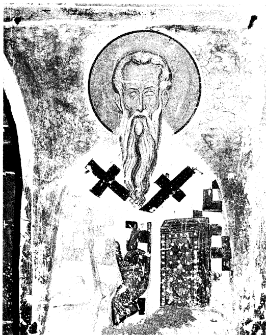
Ειχ. 17. Αδιάγνωστος ιεράρχης.