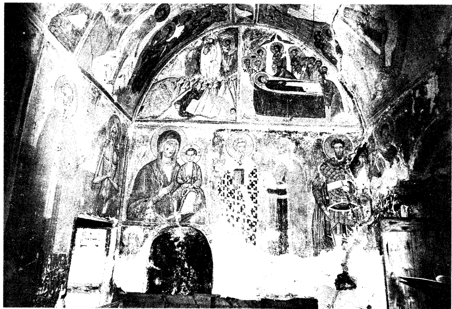
Ειζ. 8. Γενική άποψη του ναού από ανατολικά.