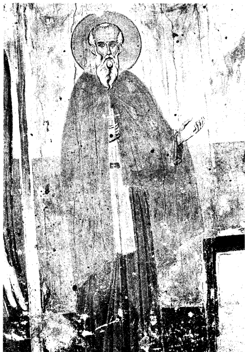
Ειχ. 16. Ο άγιος Αθανάσιος ο Αθωνίτης.