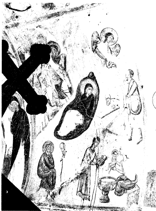
Ειζ. 4. Η Γέννηση.