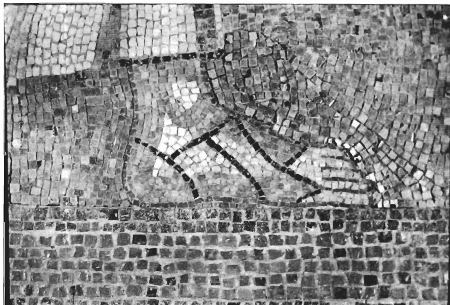
γ. Ο Απόστολος Ανδρέας (Αρχαιολογικό Μουσείο Σερρών, λεπτομέρεια με το αριστερό πέλιμα).