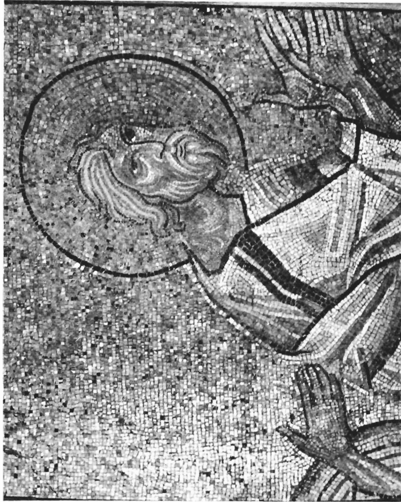
Ο Απόστολος Ανδρέας (Αρχαιολογικό Μουσείο Σερρών, λεπτομέρεια από τη μέση και πάνω).