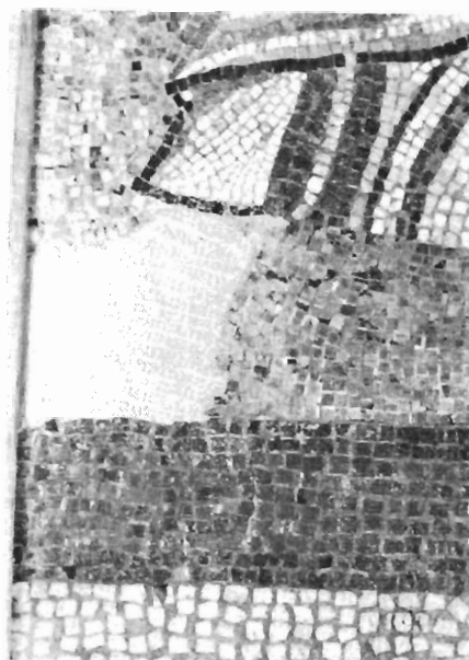
β. Ο Απόστολος Ανδρέας (Αρχαιολογικό Μουσείο Σερρών, λεπτομέρεια το δεξί πέλιμα).