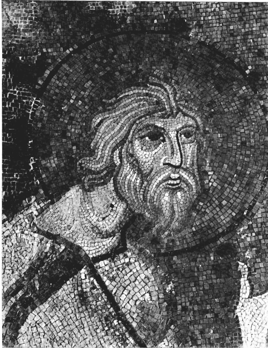
Ο Απόστολος Ανδρέας (Π. Μητρόπολη Σερρών, λεπτομέρεια).