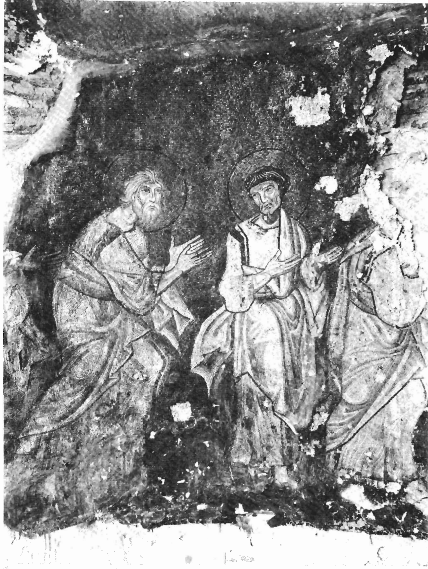
Οι Απόστολοι Ανδρέας και Λουκάς (Π. Μητρόπολη Σερρών, πριν από τη συντήρηση).