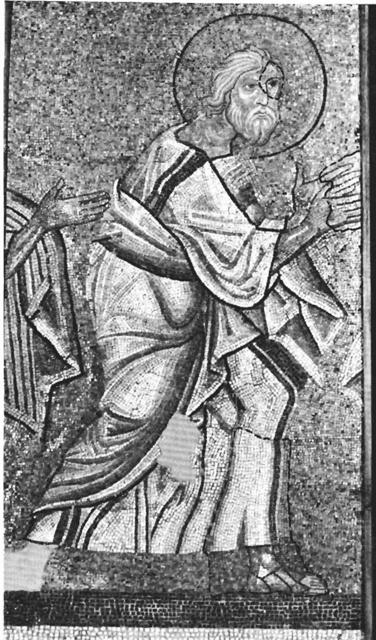
Ο Απόστολος Ανδρέας (Αρχαιολογικό Μουσείο Σερρών, υπάρχουσα κατάσταση).