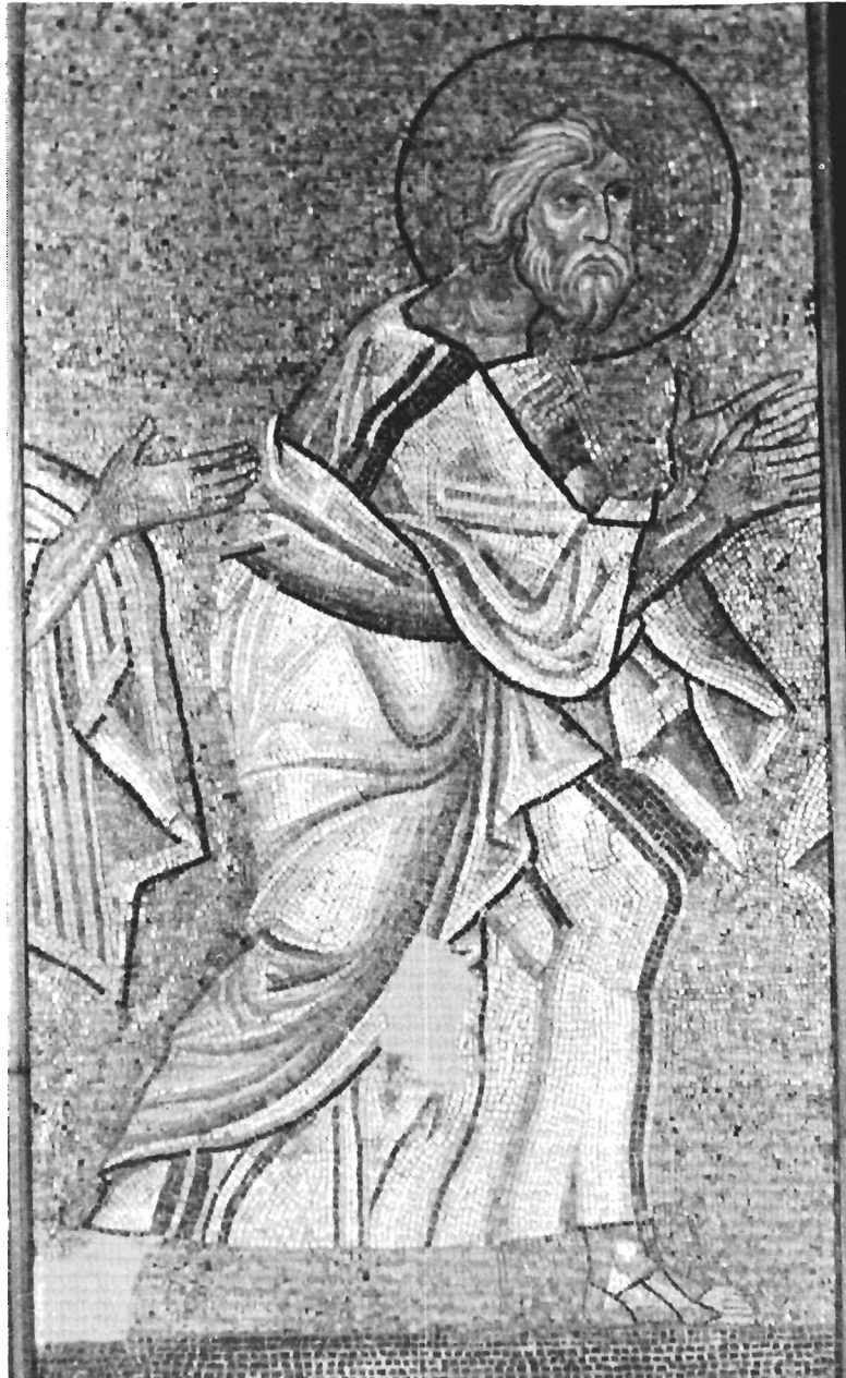
Ο Απόστολος Ανδρέας (Αρχαιολογικό Μουσείο Σερρών).