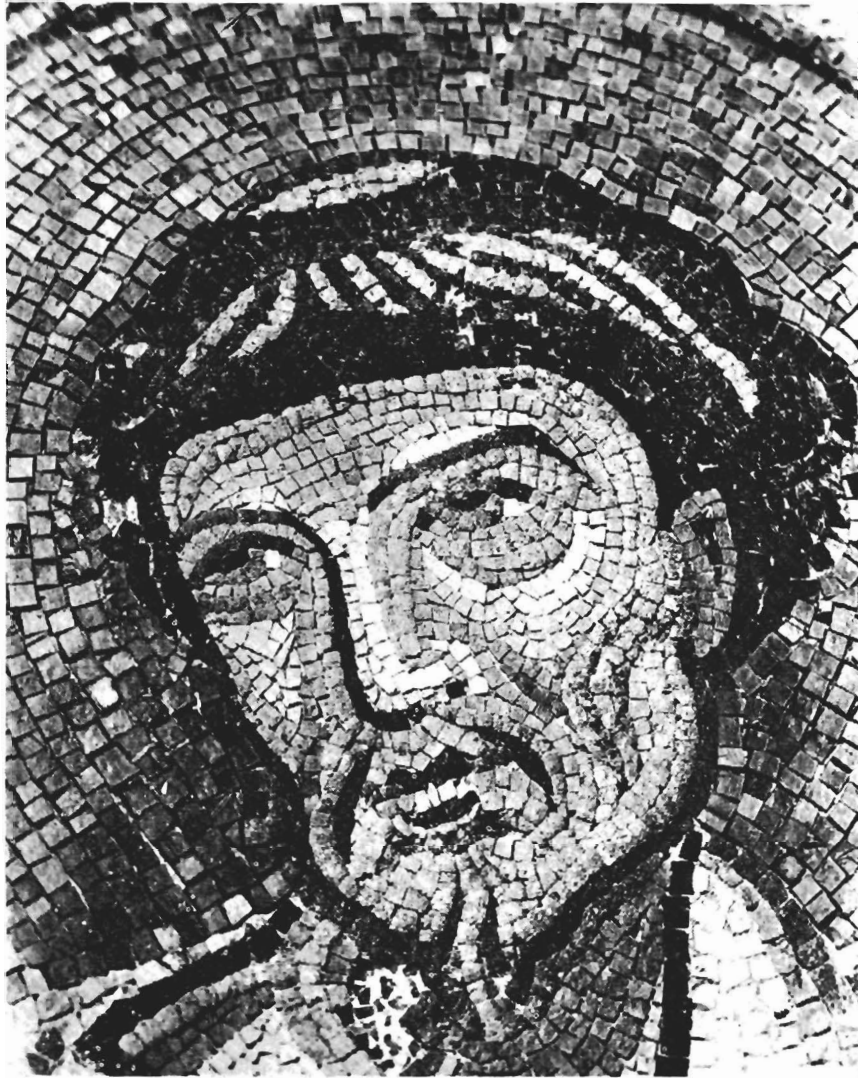
Ο Απόστολος Λουκάς (Π. Μητρόπολη Σερρών, λεπτομέρεια).