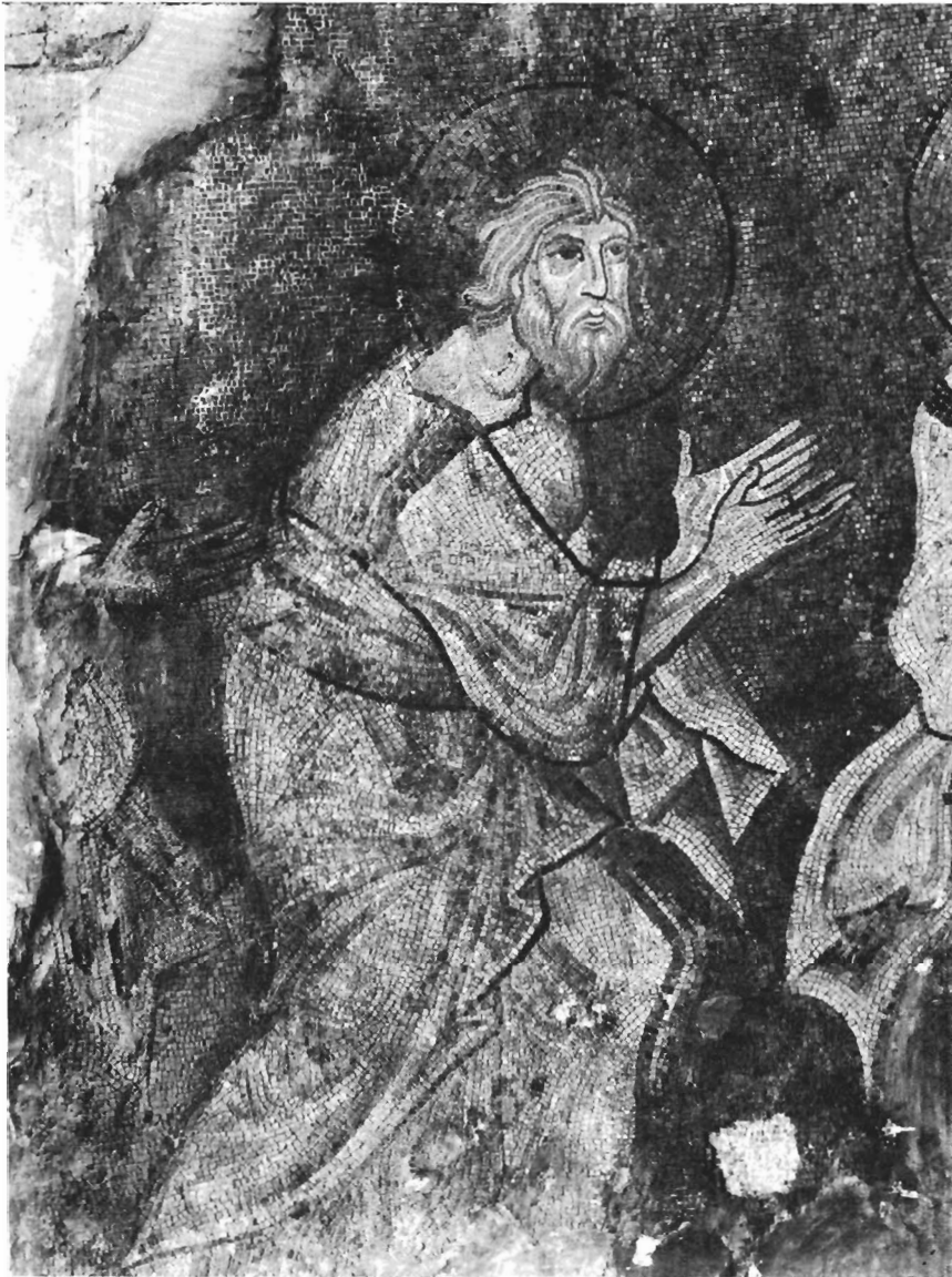
Ο Απόστολος Ανδρέας (Π. Μητρόπολη Σερρών, πριν από τη συντήρηση).