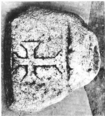
α. Ἰωνικὸ κιονόκρανο μὲ συμφρῶνές ἐπίθλημα ΑΓ 90 (ἀριθ. κατ. 26)