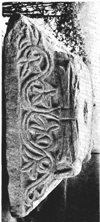
δ. Ίωνικό κιονόκρανο με συμφρές επίθημα ΑΓ 84 (ἀριθ. κατ. 21)