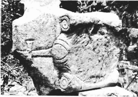
β. Ίωνικό κιονόκρανο με συμφυρές επίθημα ΑΓ 103 (ἀριθ. κατ. 23)