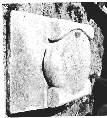
γ. Ἰωνικὸ κιονόκρανο μὲ συμφρῶνές ἐπίθλημα ΑΓ 96 (ἀριθ. κατ. 28)