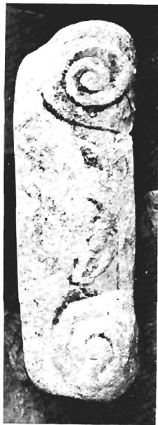
β. Ίωνικό κιονόκρανο ΑΓ 76 (ἀριθ. κατ. 13)