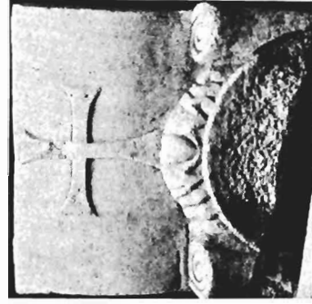
δ. Ίωνικό κιονόκρανο με συμφυρές επίθημα ΑΓ 97 (ἀριθ. κατ. 25)