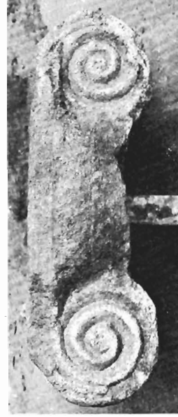
δ. Ἰωνικὸ κιονόκρανο ΑΓ 68 (ἀριθ. κατ. 4)