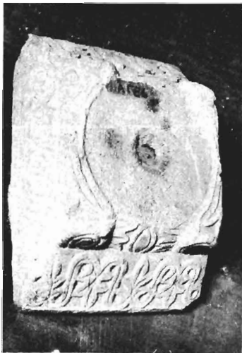
α-β. Ίωνικό κιονόκρανο με συμφρές επίθημα ΑΓ 86 (ἀριθ. κατ. 19)