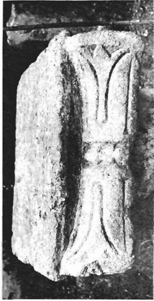
β. Ἴωνικὸ κιονόκρανο ΑΓ 74 (ἀριθ. κατ. 19)