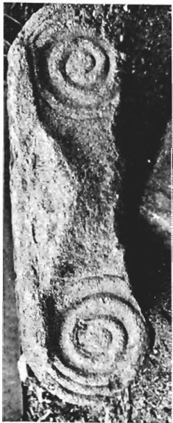
α. Ἰωνικὸ κιονόκρανο ΑΓ 72 (ἀριθ. κατ. 5)