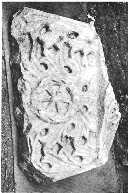
δ. Ίωνικό κιονόκρανο με συμφρές επίθημα ΑΓ 127 (ἀριθ. κατ. 15)