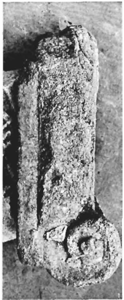
β. Ἰωνικὸ κιονόκρανο ΑΓ 71 (ἀριθ. κατ. 6)