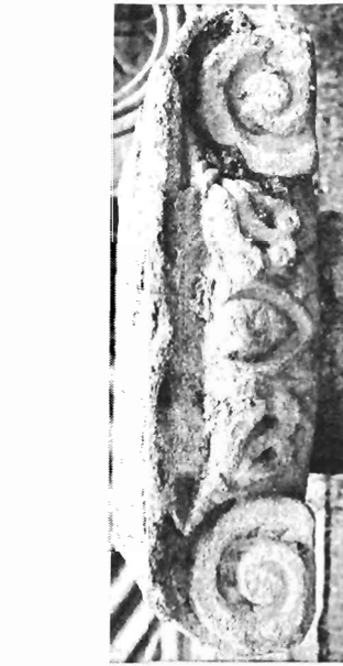
α. Ἴωνικὸ κιονόκρανο ΑΓ 74 (ἀριθ. κατ. 9)