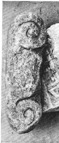
γ. Ἰωνικὸ κιονόκρανο ΑΓ 73 (ἀριθ. κατ. 7)