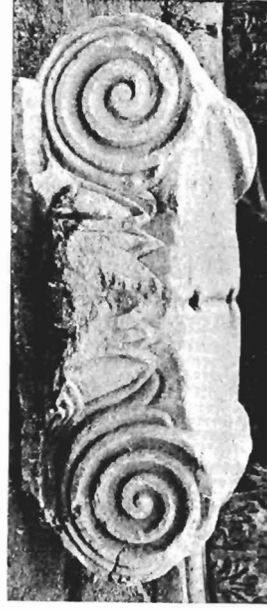
δ. Ἴωνικὸ κιονόκρανο ΑΓ 6 (ἀριθ. κατ. 11)