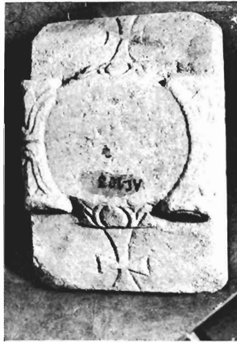
γ. Ίωνικό κιονόκρανο με συμφυρές επίθημα ΑΓ 89 (ἀριθ. κατ. 24)