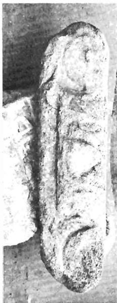
α. Ίωνικό κιονόκρανο ΑΓ 75 (ἀριθ. κατ. 12)