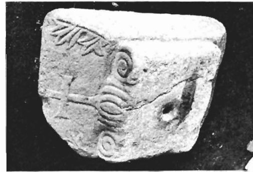
α. Ίωνικό κιονόκρανο με συμφυρές επίθημα ΑΓ 87 (ἀριθ. κατ. 22)