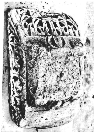
α. Ἰωνικό κιονόκρανο με συμμετρὲς ἐπίθημα ΑΓ 88 (ἀφθ. κατ. 16)