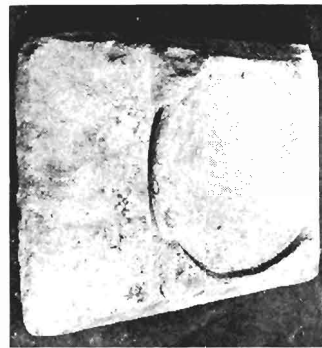
δ. Ἰωνικὸ κιονόκρανο μὲ συμφρῶνές ἐπίθλημα ΑΓ 102 (ἀριθ. κατ. 29)