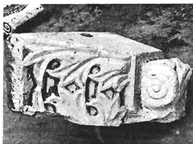
β. Ἰωνικό κιονόκρανο με συμμετρὲς ἐπίθημα ΑΓ 91 (ἀφθ. κατ. 17)