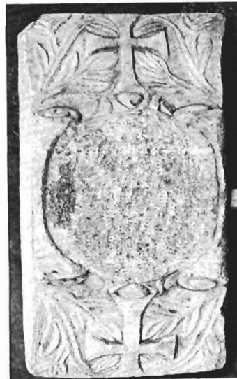
γ. Ίωνικό κιονόκρανο με συμφρές επίθημα ΑΓ 83 (ἀριθ. κατ. 20)