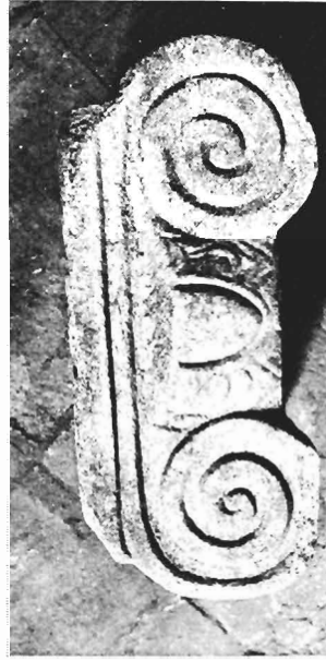
γ. Ἴωνικὸ κιονόκρανο ΑΓ 887 (ἀριθ. κατ. 10)