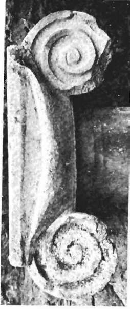
β. Ἰωνικὸ κιονόκρανο ΑΓ 116 (ἀρ. κατ. 2)