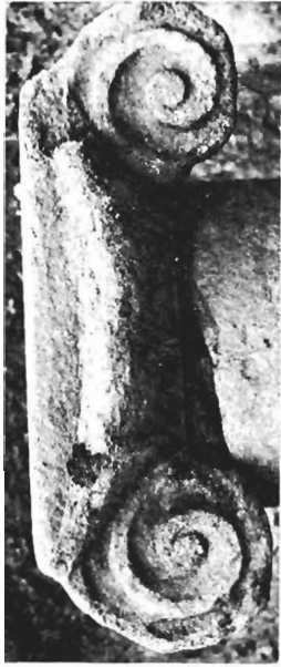
α. Ἰωνικὸ κιονόκρανο ΑΓ 70 (ἀριθ. κατ. 1)