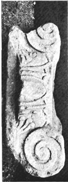
δ. Ἰωνικὸ κιονόκρανο ΑΓ 77 (ἀριθ. κατ. 8)