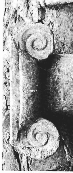
γ. Ἰωνικὸ κιονόκρανο ΑΓ 69 (ἀριθ. κατ. 3)