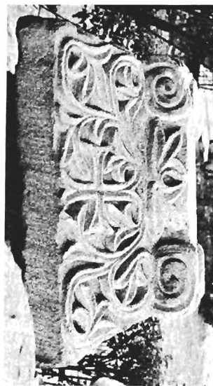
γ-δ. Ἰωνικό κιονόκρανο με συμμετρὲς ἐπίθημα ΑΓ 85 (ἀφθ. κατ. 18)