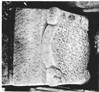
β. Ἰωνικὸ κιονόκρανο μὲ συμφρῶνές ἐπίθλημα ΑΓ 93 (ἀριθ. κατ. 27)