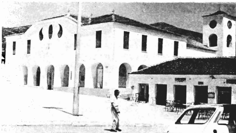
Εἰκ. 1. Ὁ μητροπολιτικὸς ναὸς τῆς Δεσκάτης στὴν πλατεία Μανουσάκη

ΑΡΧΙΕΡΑΤΕΥΟΝΤΟΣ ΤΟΥ ΠΑΝΙΕΡΩΤΑΤΟΥ ΜΗΤΡΟΠΟΛΙΤΟΥ ΔΙΣΚΑΤΗΣ ΚΥΡΙΟΥ ΚΥΡΙΟΥ ΙΩΑΝΝΟΥ ΕΓΕΝΕΤΟ ΤΟ ΠΑΡΟΝ ΕΙΚΟΝΟΣΤΑΣΙΟΝ ΔΑΠΑΝῆ ΤΗΣ ΑΥΤΗΣ ΕΚΚΛΗΣΙΑΣ ΚΑΛΛΙΤΕΧΝΟΥΝΤΟΣ ΤΟΥ ΕΚ ΜΕΤΣΟΒΟΥ ΓΕΩΡΓΙΟΥ ΚΑΙ ΣΥΝΤΡΟΦΙΑΣ ΜΗΝΙ ΑΥΓΟΥΣΤΟΥ 1895.