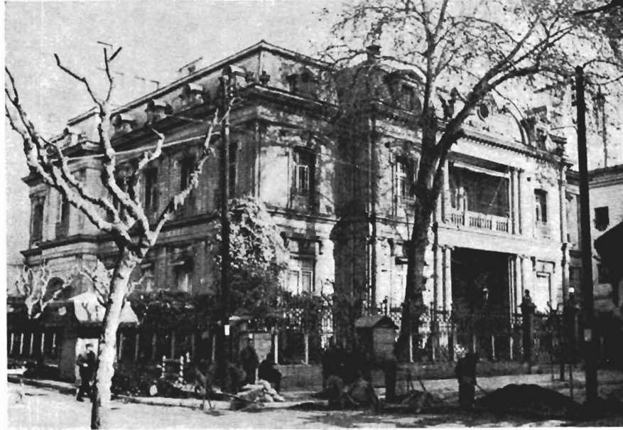
Fig. 5. La maison de Djeck Abbot. Aujourd'hui : les bureaux de I.K.A. (de la Sécurité Sociale)

chênes et des platanes d'Italie. La vie de ce quartier était pittoresque. Chaque matin les commerçants européens partaient par groupes pour descendre à la ville, d'où, ils revenaient le soir. Leurs familles les attendaient sur les rochers entourés de gazon et là elles les recevaient et écoutaient les nouvelles du jour. Chaque soir ils se rassemblaient tous chez un consul ou un commerçant et ils dansaient. Quelquefois ils s'entendaient pour de petites excursions aux alentours.