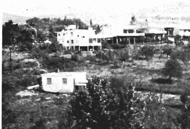
Fig. 1. Vue d'une partie d'Urendjik