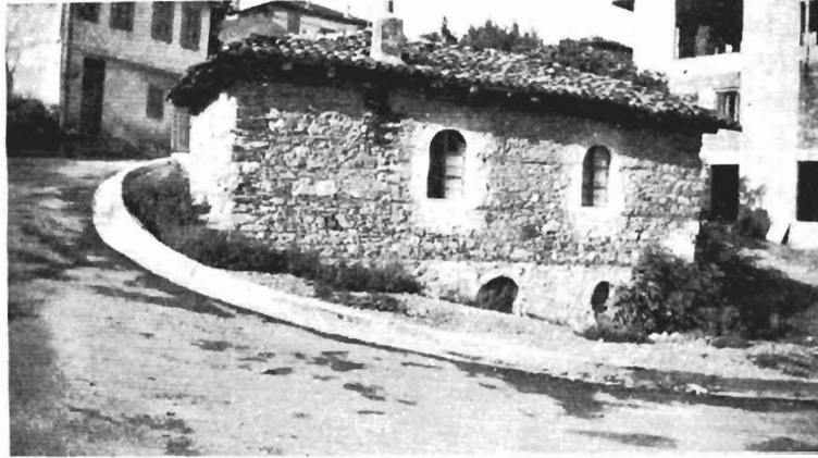
Fig. 9. La plus vieille maison d'Asvestohori