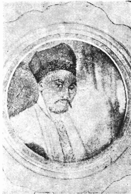
Fig. 2. Barthélemy Edouard Abbot (Ἀγγλικῆς Β. Μεταλλινού (π. Τσιώμου), Παλαιὰ Θεσσαλονίκη - Εἰκονογραφημένη Θεσσαλονίκη, vol. 1, p. 170)

Urendjick avait acquis renommée assez grande pour être mentionné jusque dans le livre du célèbre géographe italien Andrien Valvi 1 , traduit de l'italien en grec et édité à Vienne vers 1839 par l'érudit de Larissa Constantin Koumas. Un siècle plus tard, le géographe allemand Leonhard-Shultze Jena, se fondant, sans doute sur des témoignages écrits, dit que les consuls d'Allemagne, d'Angle-