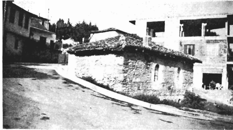
Fig. 11. La maison d'Asvestohori vue du NE

Charnaud, mentionné, comme nous l'avons vu, par Holland dans son livre) acheta le domaine de Djeck. Frédéric de Charnaud enleva les marbres et les rares arbres du domaine pour embellir les maisons et les jardins qu'il possédait dans le quartier des occidentaux et dans la campagne du Salonique, au-delà de la Tour Blanche.