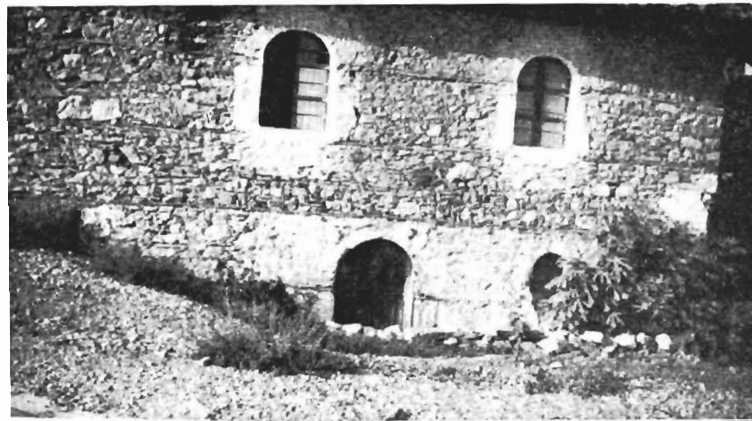
Fig. 10. La maison d'Asvestohori vue du côté septentrional