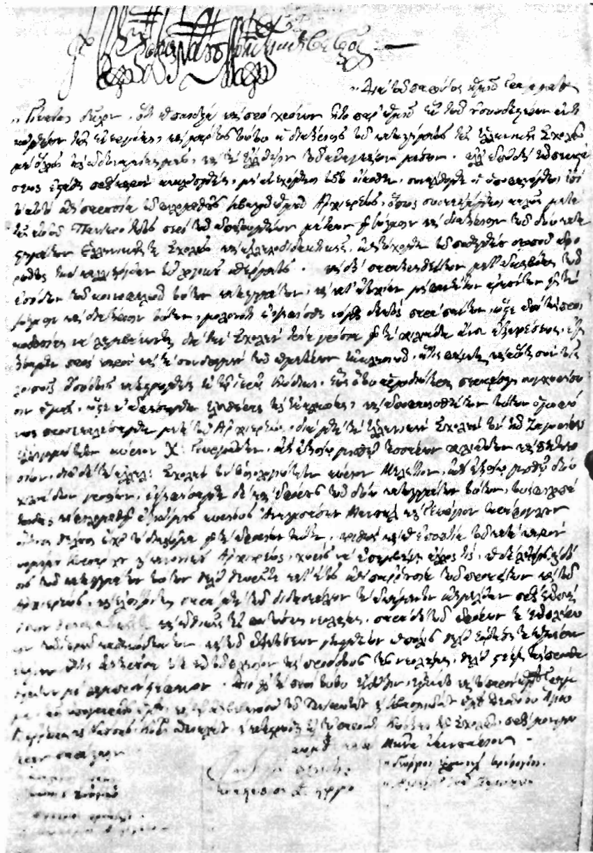
Είκ. 2. Το πρωτότυπον του πρακτικῆς τῆς ιδρύσεως τῆς «Ἀλληλοδιδασκτικῆς Σχολῆς» τῆς Βεροίας (σελ. 1 τοῦ κώδικος)