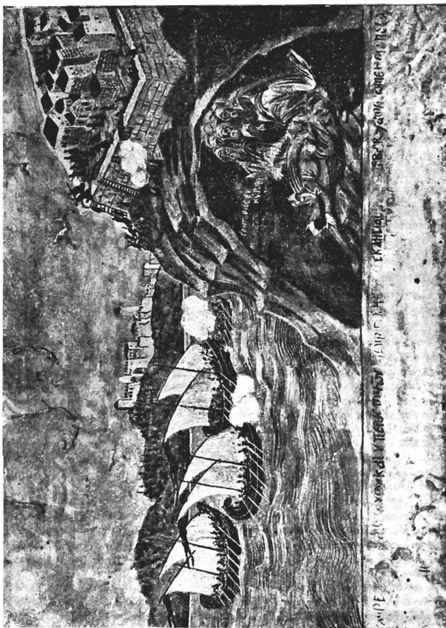
Εἰκὼν ἐπὶ περιγραφῆς παριστώσα ἐπιθεσὶν πειρατῶν κατὰ τοῦ Ἁγίου Ὁρους.