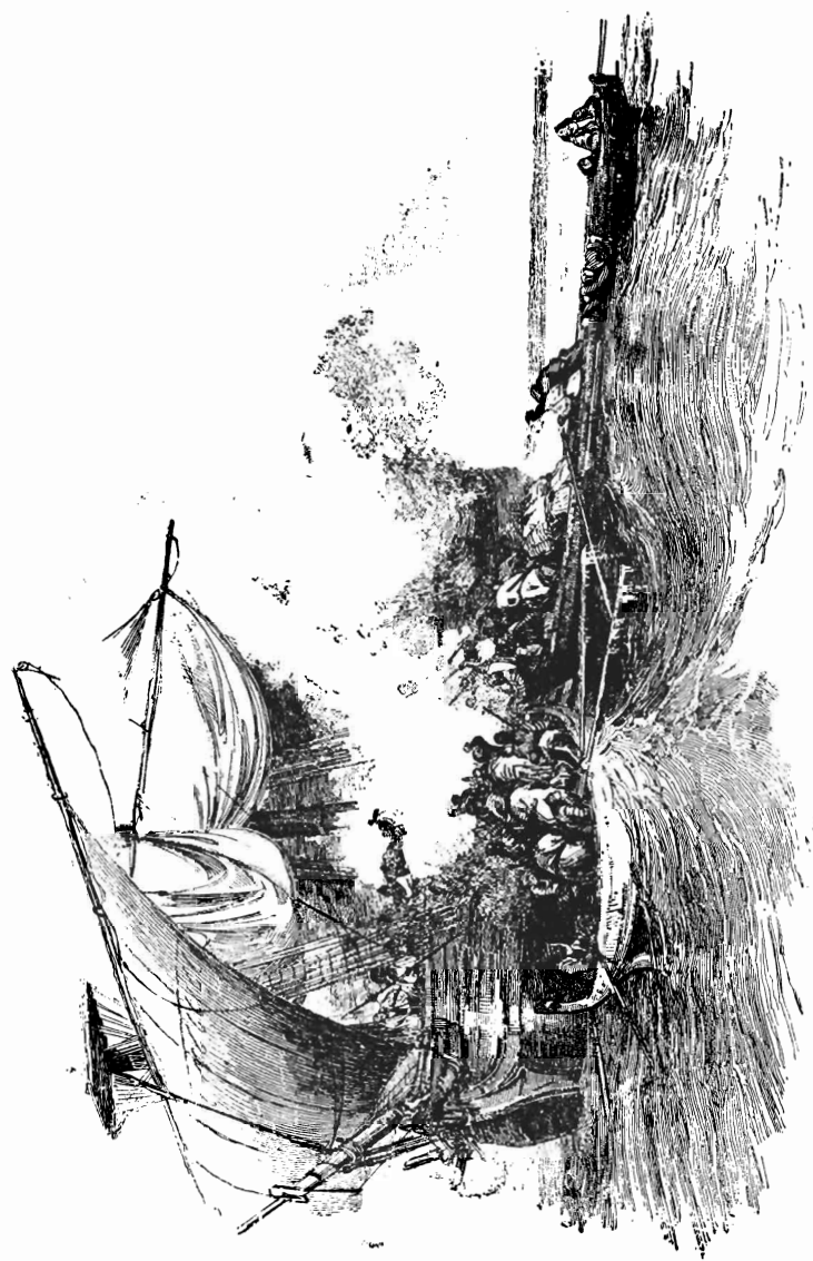
Ἐπίθεσις ἑλληνικῶν πειρατικῶν κατὰ ἐμπορικῶν σκάφους.