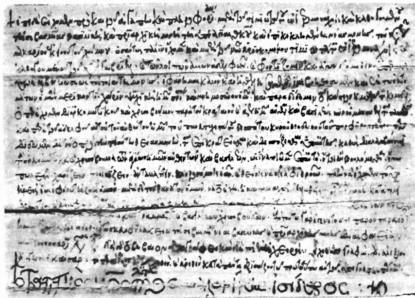
Τὸ ἀντίγραφον τοῦ δωρητηρίου ἐγγράφου τοῦ καίσαρος Ἀλεξίου Ἀγγέλου διὰ τὴν Νέαν Μονὴν με ὑπογραφήν τοῦ μητροπολίτου Θεσσαλονίκης Ἰσιδώρου (τοῦ Γλαβᾶ).