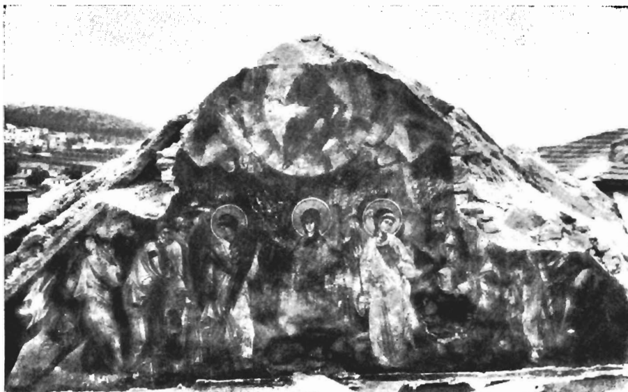
Εικ. 1. Ἀνατολικὸν ἀέτωμα. Ἡ Ἀνάληψις τοῦ Χριστοῦ