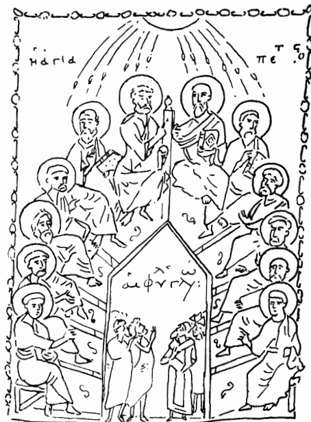
Εἰκ. 3. Ἡ Πεντηκοστή. Μικρογραφία τοῦ ὑπ' ἀριθ. 3 Εὐαγγελίου τοῦ Οἴκουμ. Πατριαρχείου Κωνσταντινουπόλεως.

ἀντὶ τῆς συνήθους ἡμικυκλικῆς, 1 εἶναι ἀρκούντως σπανία. Ἰδέαν πάντως τῆς ὅλης συνθέσεως εἰς τοὺς Ταξιάρχας, ὅπως περίπου θὰ εἶχεν αὐτή, ὅταν ἦτο πλήρης, μᾶς δίδει ἡ μικρογραφία τοῦ ὑπ' ἀριθμὸν 3 Εὐαγγελίου τοῦ Πατριαρχείου Κωνσταντινουπόλεως, ἀνήκοντος εἰς τὸν 12 ον πιθανῶς αἰ. 2 Ταύτης σχεδίασμα παραθέτομεν ἐνταῦθα (εἰκ. 3).