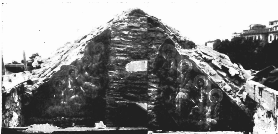
Εικ. 2. Δυτικὸν ἀέτωμα. Ἡ Πεντηκοστή