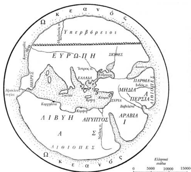
Εικ. 2. Ο χάρτης του Εκαταίου του Μιλήσιου (περ. 550-475 π.Χ.), που χρησιμοποιήθηκε ευρέως στην εποχή του (αναπαράσταση). Διατηρείται η αντίληψη σχετικά με τον Ωκεανό που περιβάλλει τον γήινο δίσκο.