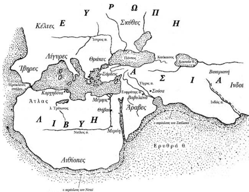
Εικ. 5. Ο κατοικημένος κόσμος, κατά τον Ηρόδοτο, τον 5ο αιώνα π.Χ.