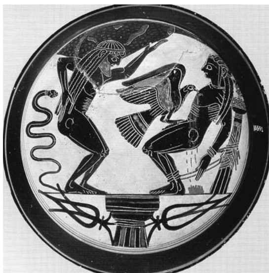
Εικ. 4. Εσωτερικό λακωνικής μελανόμορφης κύλικας του Ζωγράφου του Αρχεσιλάου (560-555 π.Χ.). Απεικονίζονται ο Άτλας και ο Προμηθέας στις δύο άκρες της γης, να υποφέρουν τα μαρτύριά τους. Από το Cerveteri (Caere) της Ετρουρίας. Βατικανό, Museo Gregoriano Etrusco 16592 (φωτ. από Μ. Τιβέριος, Αρχαία Αγγεία, Αθήνα, Εκδ. Αθηνών, 1996, ειχ. 65.