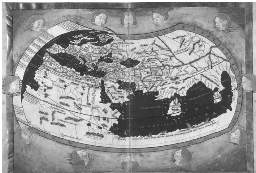
Εικ. 6. Ο χάρτης της οικουμένης, σύμφωνα με τη Γεωγραφία του Κλαύδιου Πτολεμαίου (περ. 90-178 μ.Χ.), στη «δύτηρη πτολεμαϊκή προβολή» (Urb. lat. 274, ff. 74v-75r).