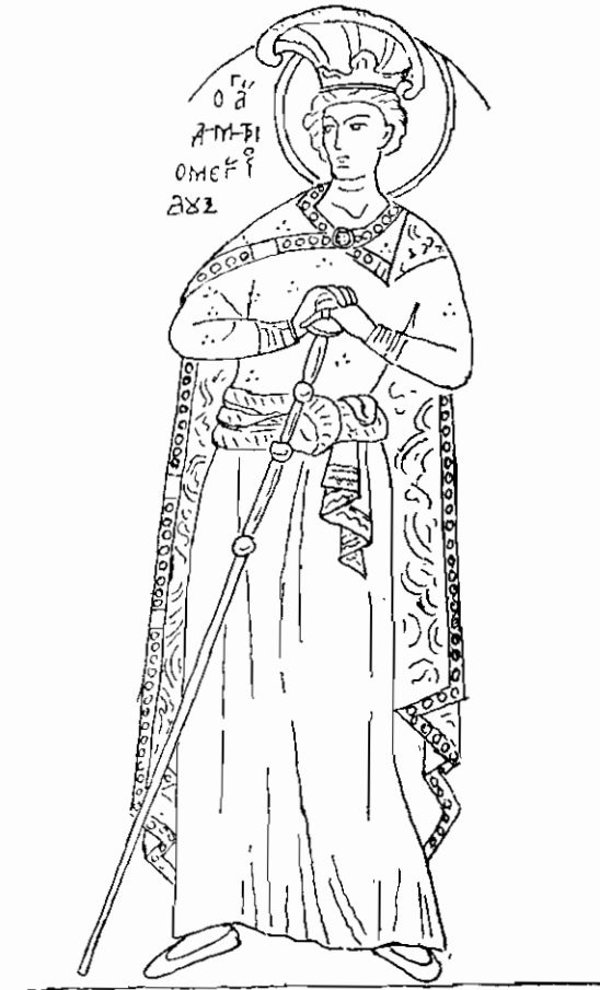
Εἰκ. 2. Ὁ Ἅγιος Δημήτριος ὁ Μέγας Δούξ. Τοιχογραφία τοῦ ἔτους 1483 εἰς τὸ παλαιὸν Καθολικὸν τῆς Μονῆς Μεταμορφώσεως τῶν Μετῶρων.

νον ἐξ ὑφάσματος μὲ πλατείας κατακορύφους ραβδώσεις. Ὁ ἅγιος στηρίζεται δι' ἀμφοτέρων τῶν χειρῶν ἐπὶ ὑψηλῆς ράβδου μετὰ χρυσῶν κόμβων κατὰ διαστήματα.