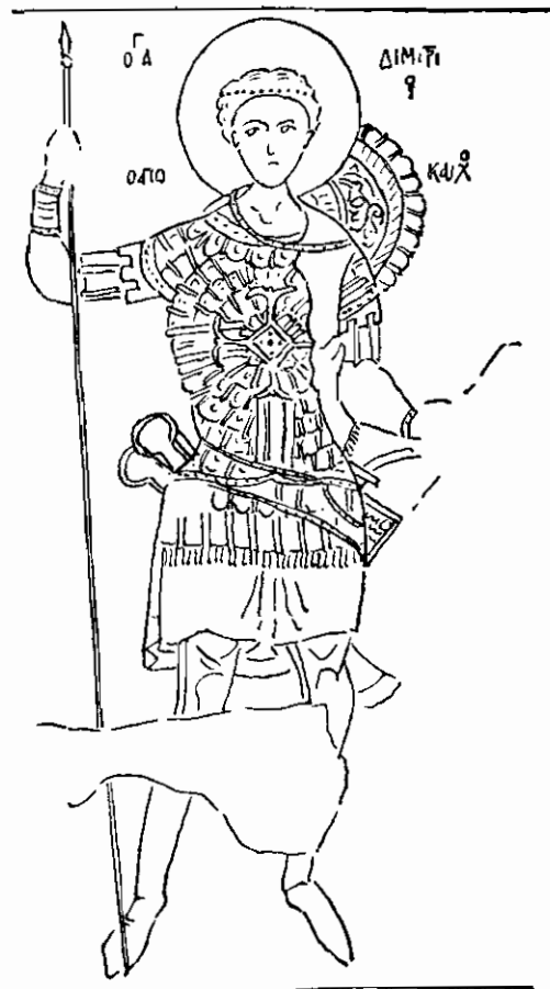
Εἰκ. 3. Ὁ Ἅγιος Δημήτριος ὁ Ἀπόκαυκος. Τοιχογραφία τοῦ ἔτους 1384 εἰς τὸν Ἅγιον Ἀθανάσιον Καστοριάς.

μειον, εἶπου ὁ Ἅγιος Δημήτριος ὀνομάζεται ἀπλῶς ὁ Ἀπόκαυκος. Εἶναι τοῦτο ἢ ἀπὸ τοῦ 1384 τοιχογραφία τοῦ Ἁγίου Ἀθανασίου τῆς Καστοριάς 1 (εἰκ. 3).