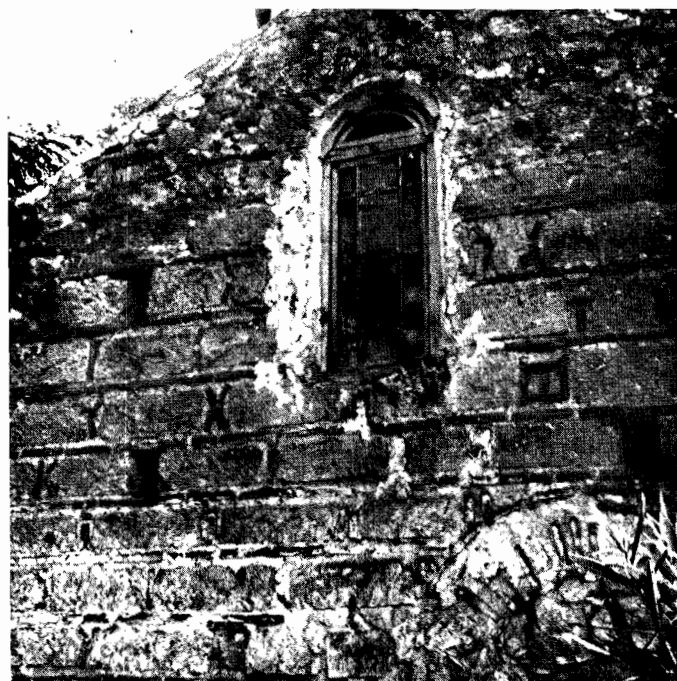
β) Ὁ ναὸς τοῦ Προφήτου Ἡλία τῆς Κοιτίτσας. Ὅψεις τοῦ Β. σκέλους τοῦ σταυροῦ.