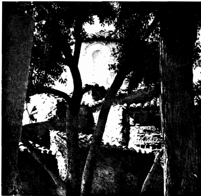
α) Ὁ ναὸς τοῦ Προφήτου Ἡλία τῆς Κοιτίτσας ἀπὸ Ν.Α.