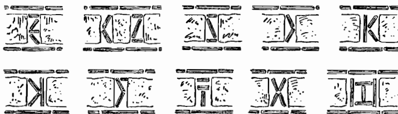
Εἰκ. 2. Κεράμια γράμματα κατὰ τοὺς ἄρμους τῶν λίθων.

Τέλος ἡ μεγάλη κόγχη τοῦ ἱεροῦ ἐφωτίζετο δι' ἑνὸς καὶ μόνου, μονολόβου πιθανώτατα, παραθύρου, ὅπερ ὁμοίως μετεσχηματίσθη μεταγενεστέρως εἰς ὀρθογώνιον ἀνοιγμα.