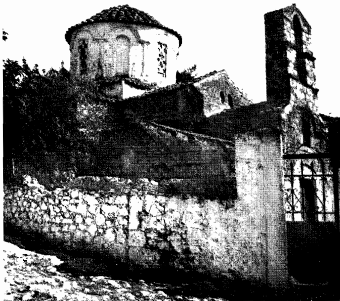
α) Ὁ ναός τοῦ Προφήτου Ἡλίας τῆς Κονιδίτσας. Ὅψεις ἀπὸ Β. Δ.