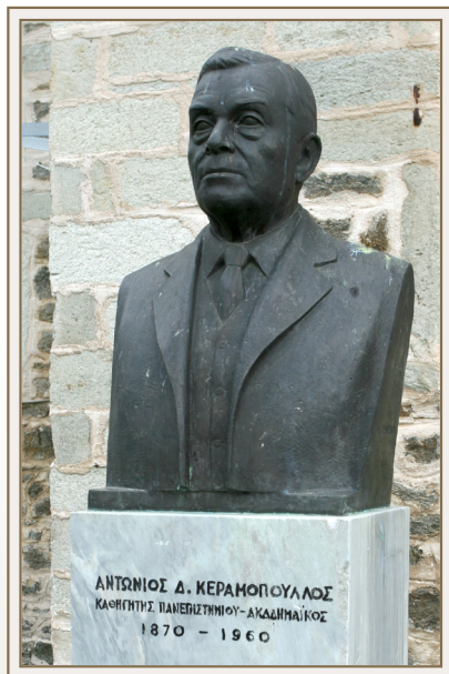
Προτομή του τιμωμένου στην Βλάστη